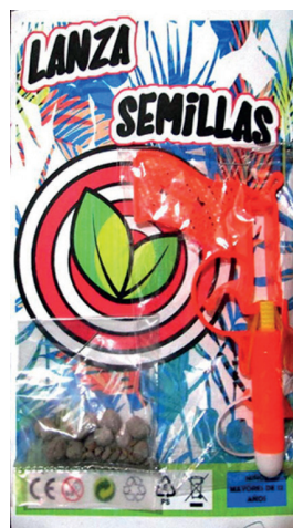
Figura 2 - Juguete didáctico lanza semillas, Julio Cruz, Ciudad de México, 2019.