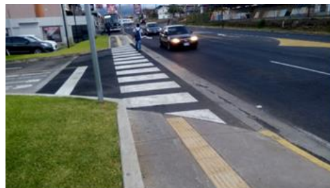
Ilustración 9: Guías tactopodales en banquetas que se interrumpen en los arroyos, cuando el código debiera ser continuo, previa advertencia de la diferencia de uso (Solano, 2018)