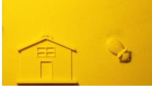
Ilustración 1: Libros táctiles para niños ciegos, partiendo erróneamente de figuras abstraídas de la realidad, no reconocibles por quien carece de la vista.

Partiendo de la falta de relación analógica formal, que se fundamente en la vista, las impresiones aquí mostradas parten de estilizaciones y concepciones formales no comprensibles para quien nunca ha observado sino tocado.