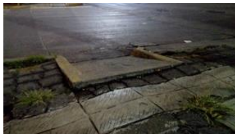
Ilustración 2: Rampas prefabricadas que no se ajustan a los niveles existentes, lo que imposibilita su uso (Solano, 2018).

Parte de la posverdad, es la supuesta atención hacia las personas con discapacidad. Los ajustes razonables se asumen como un compromiso obligado, pero no se resuelven de manera óptima. La última finalidad es realmente generar espacios inclusivos, se simula el cumplimiento porque las normas así lo exigen o para amortiguar los costos.