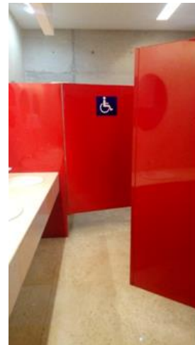
Ilustración 11: Sanitarios para personas con discapacidad colocados al fondo, lo que complica su acceso, sumado al inconveniente abatimiento exterior de las puertas (Solano, 2018).