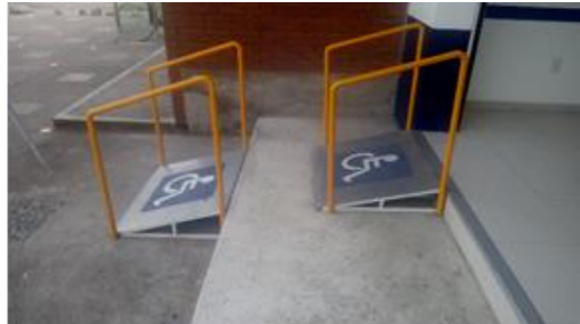
Ilustración 4: Rampas improvisadas y sin respeto por las pendientes óptimas (Solano, 2018).