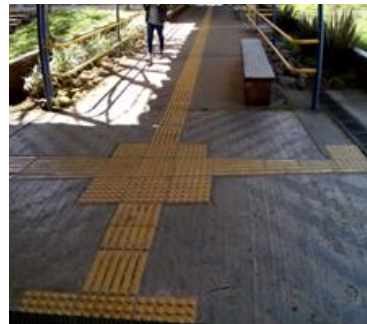
Ilustración 8: Falta de continuidad en el diseño de táctiles antideslizantes para invidentes (Solano, 2018)

Las guías tactopodales son auxiliares para el desplazamiento de personas con baja o nula visión, pero la claridad, congruencia y continuidad resultan imprescindibles para que cumplan su cometido. Si los trayectos se interrumpen, o si resultan confusos, resultan implementaciones inútiles, que permiten afirmar que este segmento está atendido, pero esta atención resulta nuevamente una simulación.