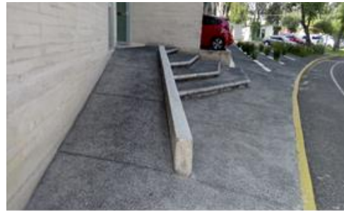
Ilustración 7: Anchos y pendientes poco confortables para usuarios de sillas de ruedas (Solano, 2018).