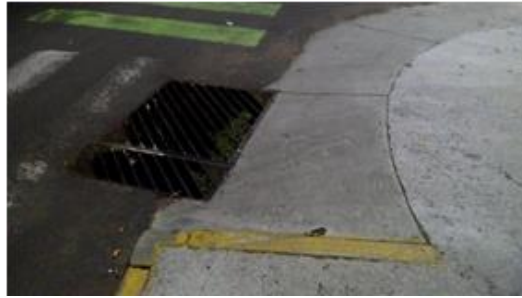
Ilustración 3: Rejas que obstruyen la circulación y uso de las rampas (Solano, 2018).