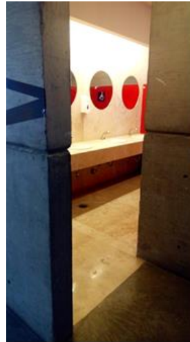
Ilustración 10: Accesos complicados para usuarios en silla de ruedas (Solano, 2018).

Nuevamente, con una política de simulación, los sanitarios públicos incluyen espacios para personas con discapacidad, pero en su diseño no se considera la dificultad en el manejo de una silla de ruedas, proponiéndose su ubicación al fondo, con quiebres de circulación y con abatimiento de puertas que invaden el espacio de circulación; todo ello dificulta el uso, siendo nuevamente una estrategia ilusoria de atención a los segmentos “vulnerables”.