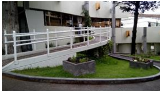
Ilustración 5: Rampa de acceso cuya forma curva dificulta la circulación con silla de ruedas (Solano, 2018).