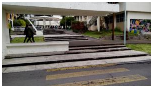
Ilustración 6: Discontinuidad de rampas, a la que se puede acceder librando primero una escalinata que le antecede (Solano, 2018).