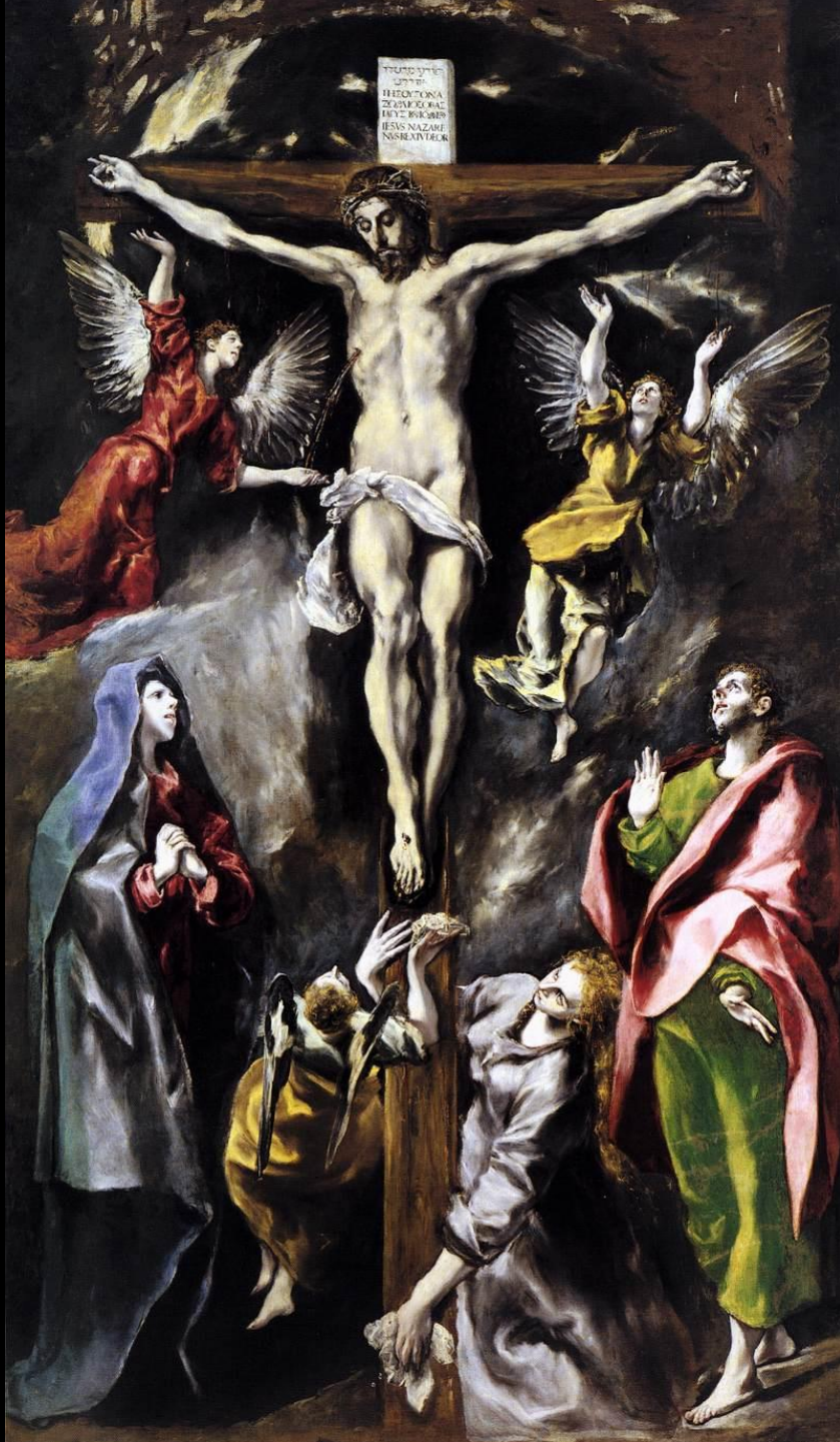
Doménikos Theotokópoulos "EL GRECO" LA CRUCIFIXIÓN