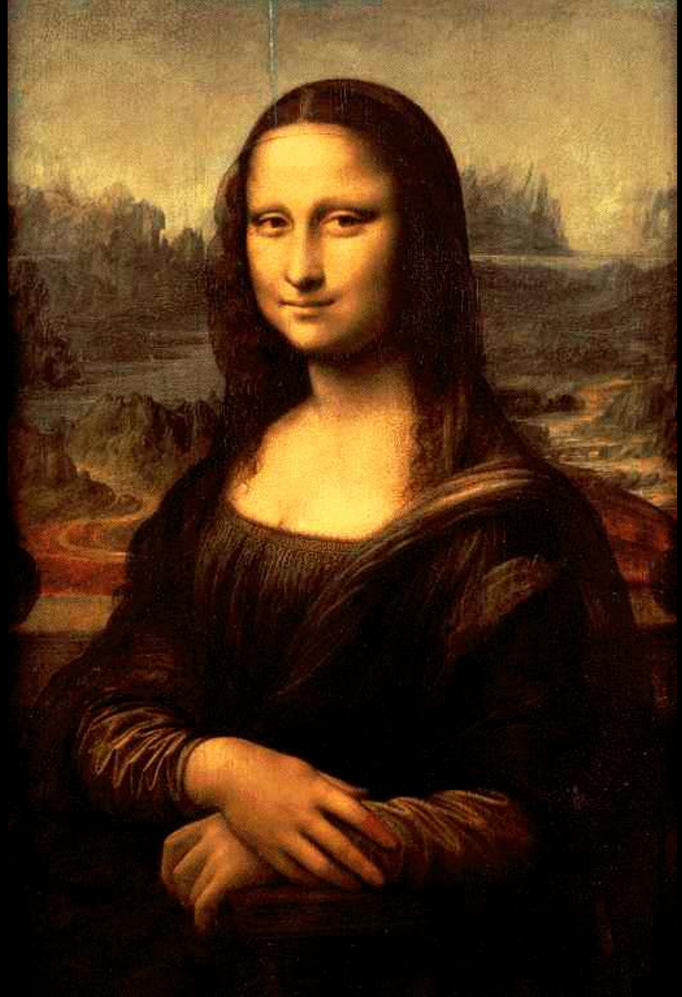
LA GIOCONDA LEONARDO DA VINC