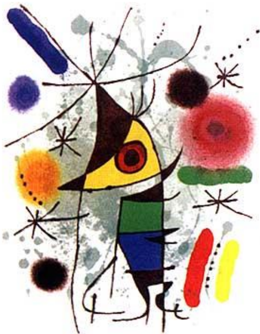
JOAN MIRÓ PEZ CANTANDO