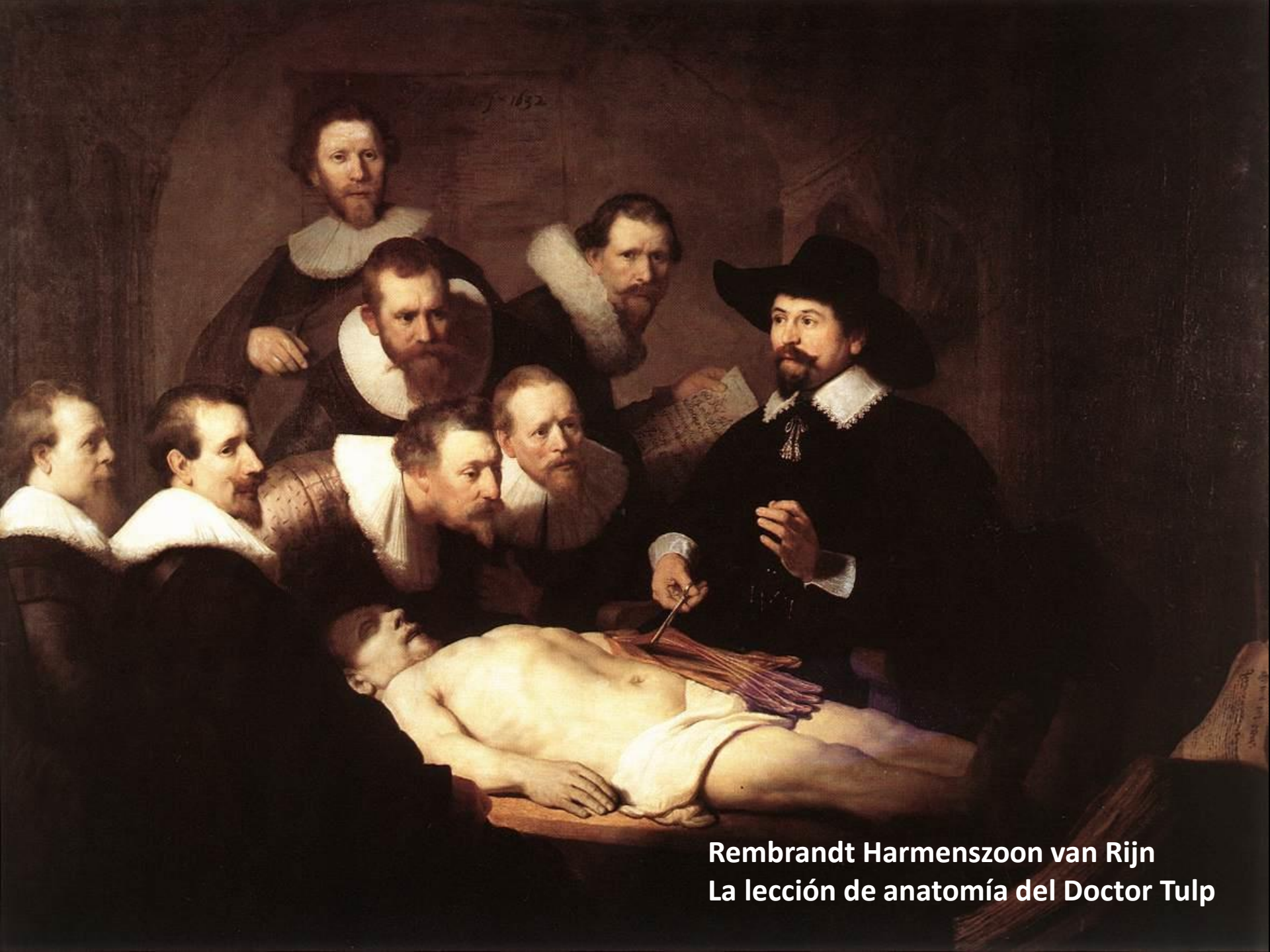
Rembrandt Harmenszoon van Rijn La lección de anatomía del Doctor Tulp