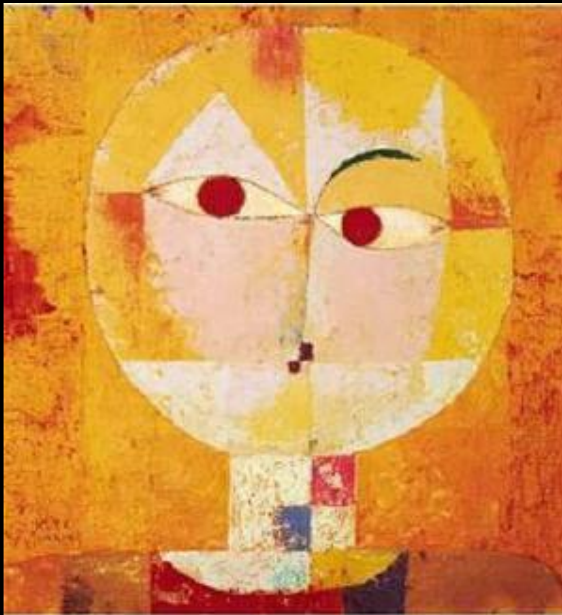
PAUL KLEE – SENCIO PAINTING