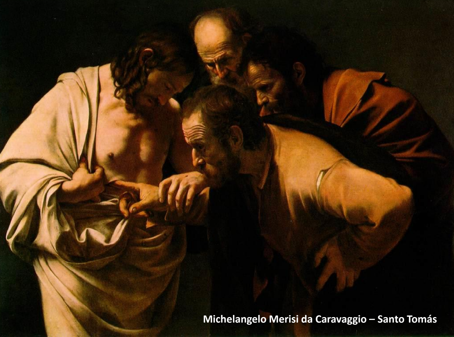
Michelangelo Merisi da Caravaggio – Santo Tomás