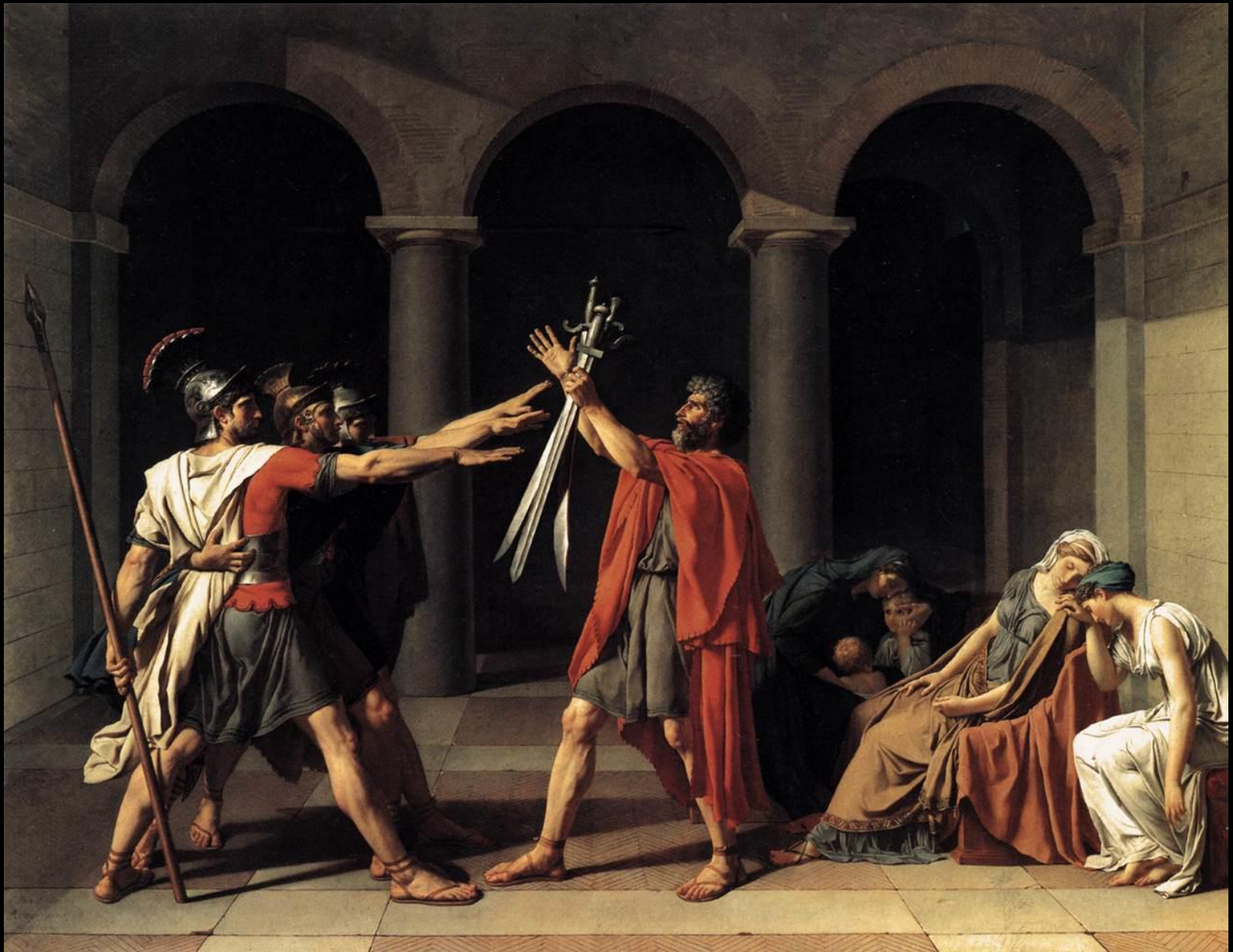
EL JURAMENTO DE LOS HORACIOS – JAQUES LOUIS DAVID