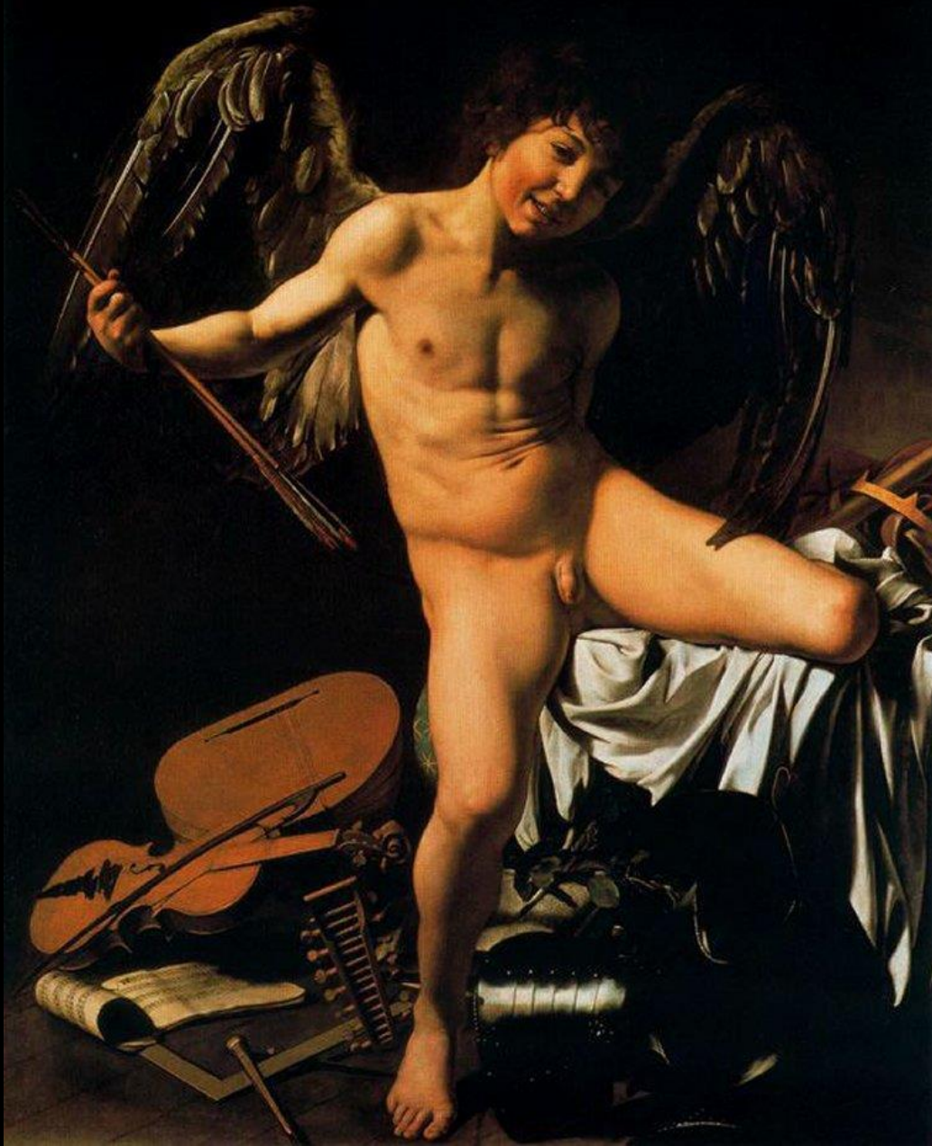
Michelangelo Merisi da Caravaggio Amor Victorious