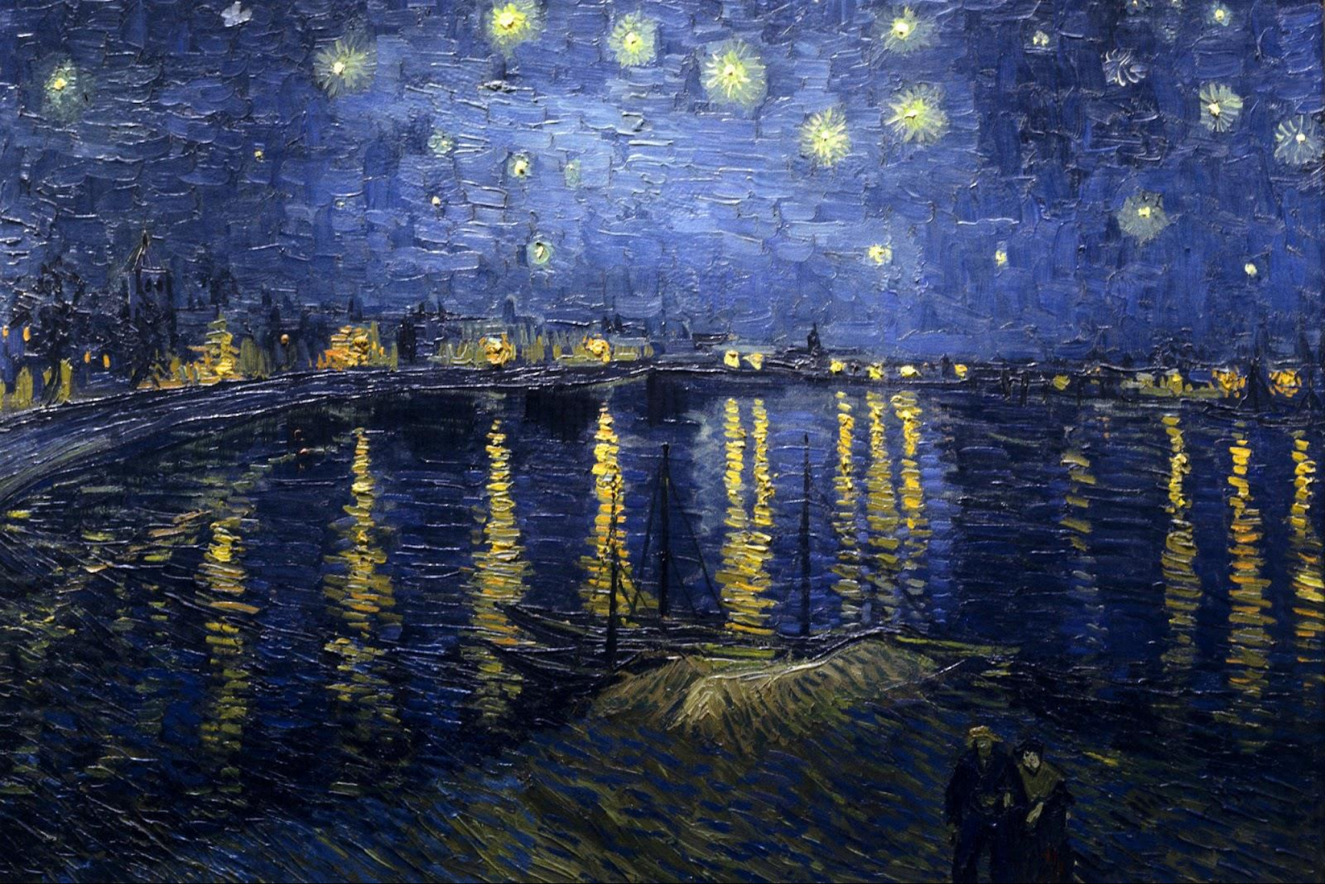
VINCENT VAN GOGH - Starry Night over the Rhone