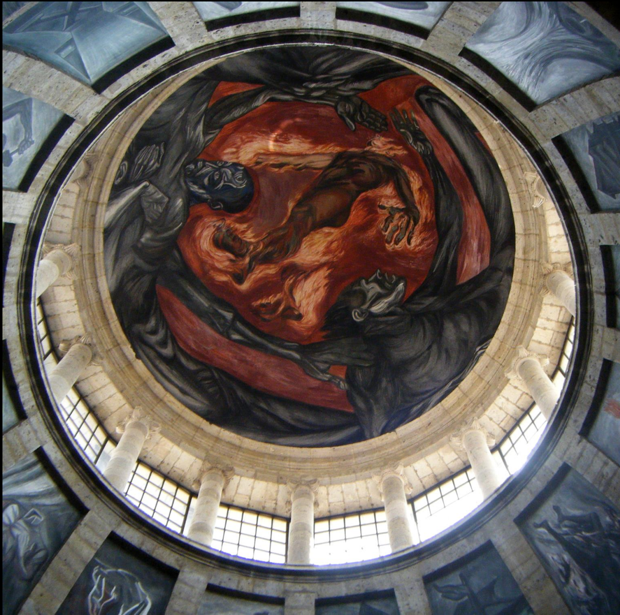
PROMETEO EN LLAMAS JOSÉ CLEMENTE OROZCO