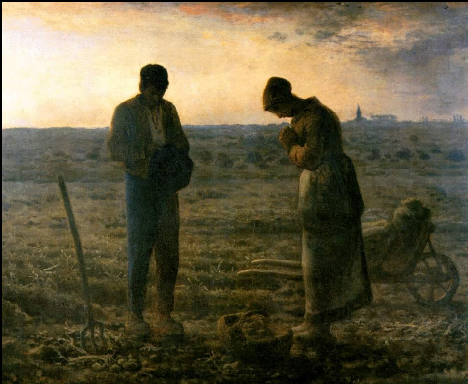
ANGELUS – JEAN FRANCOIS MILLET