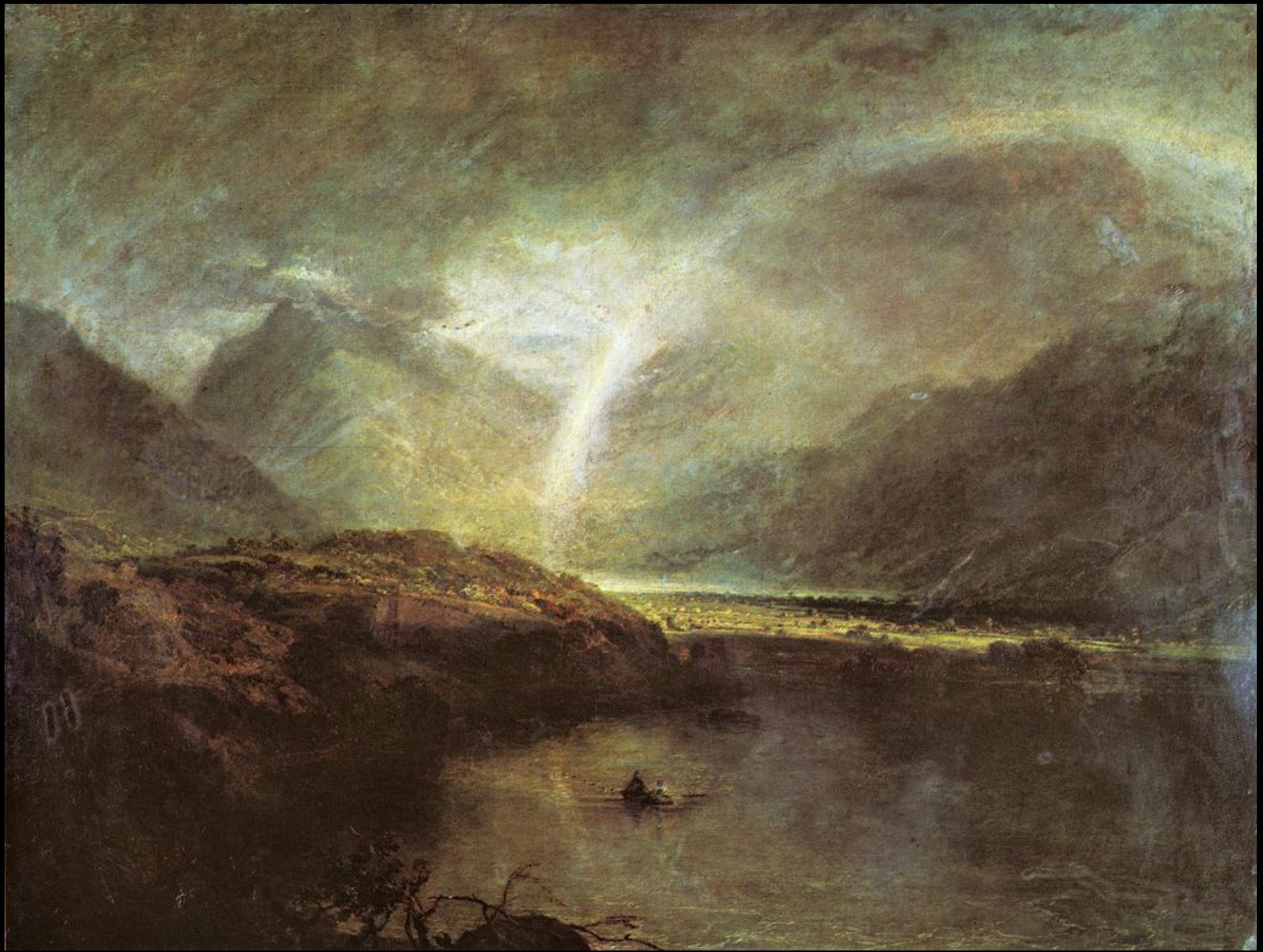
JOSEPH WILLIAM TURNER