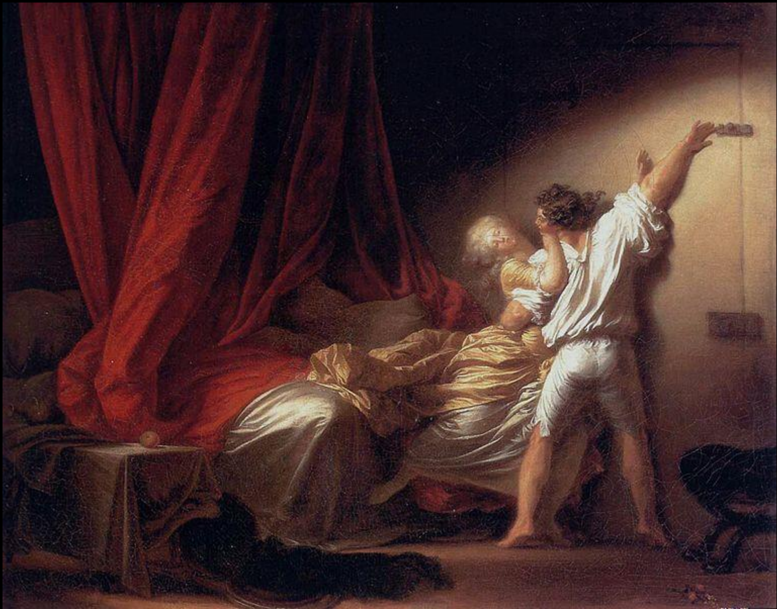
Jean-Honoré Fragonard - LA CERRADURA