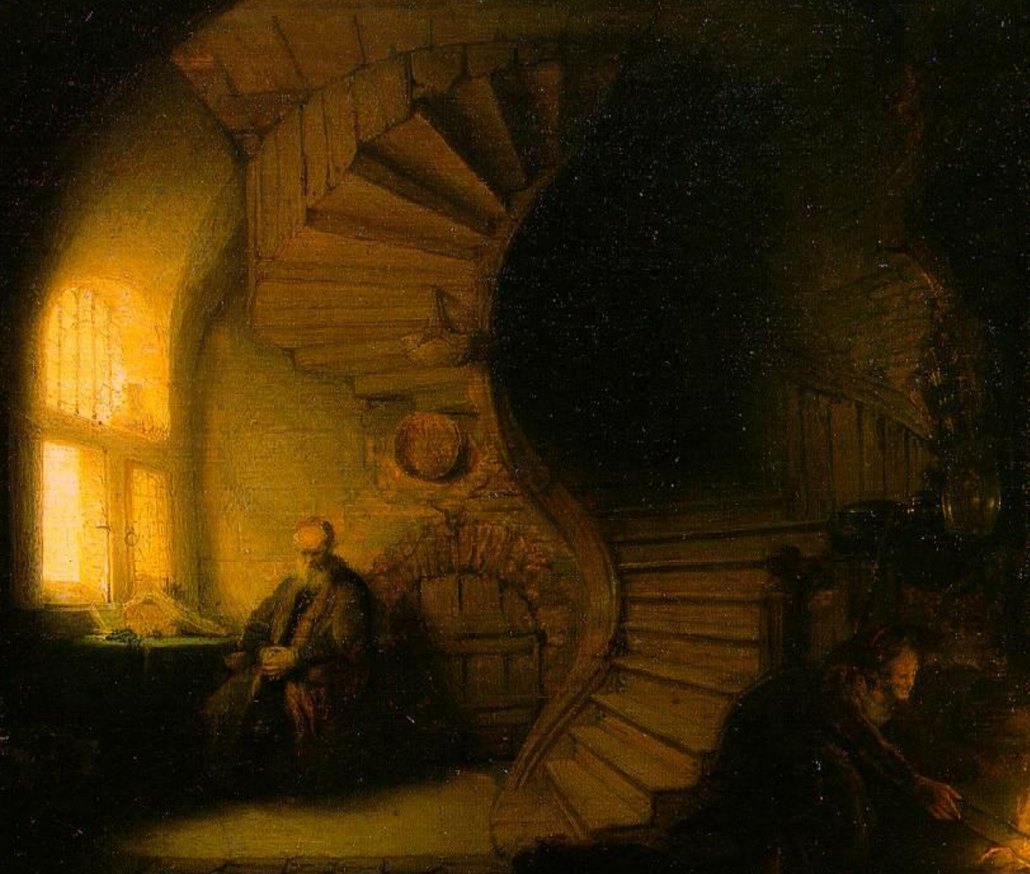
Rembrandt Harmenszoon van Rijn La meditación