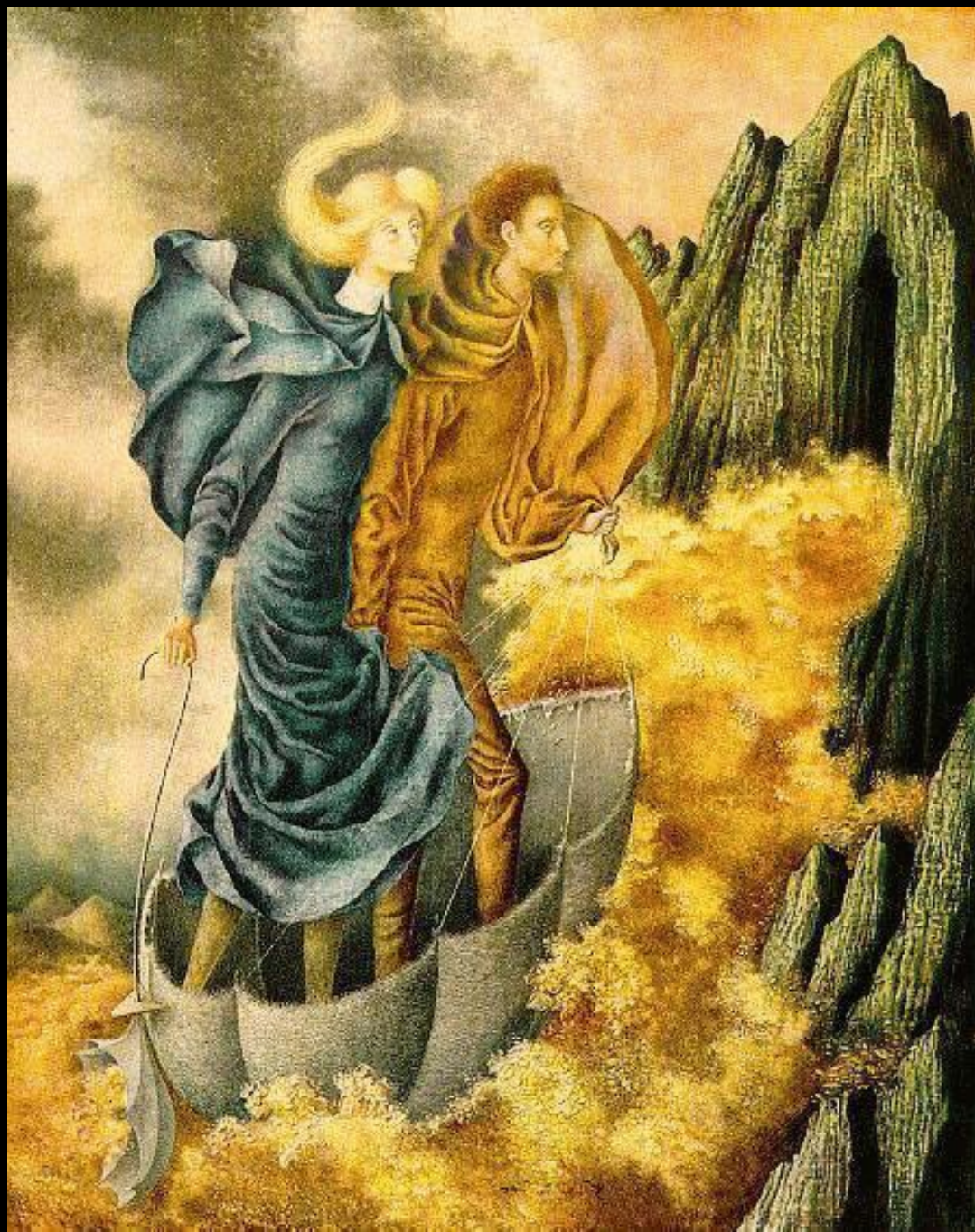
LA HUIDA REMEDIOS VARO