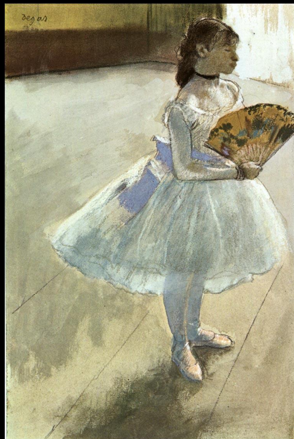
EDGAR DEGAS BAILARINA CON ABANICO