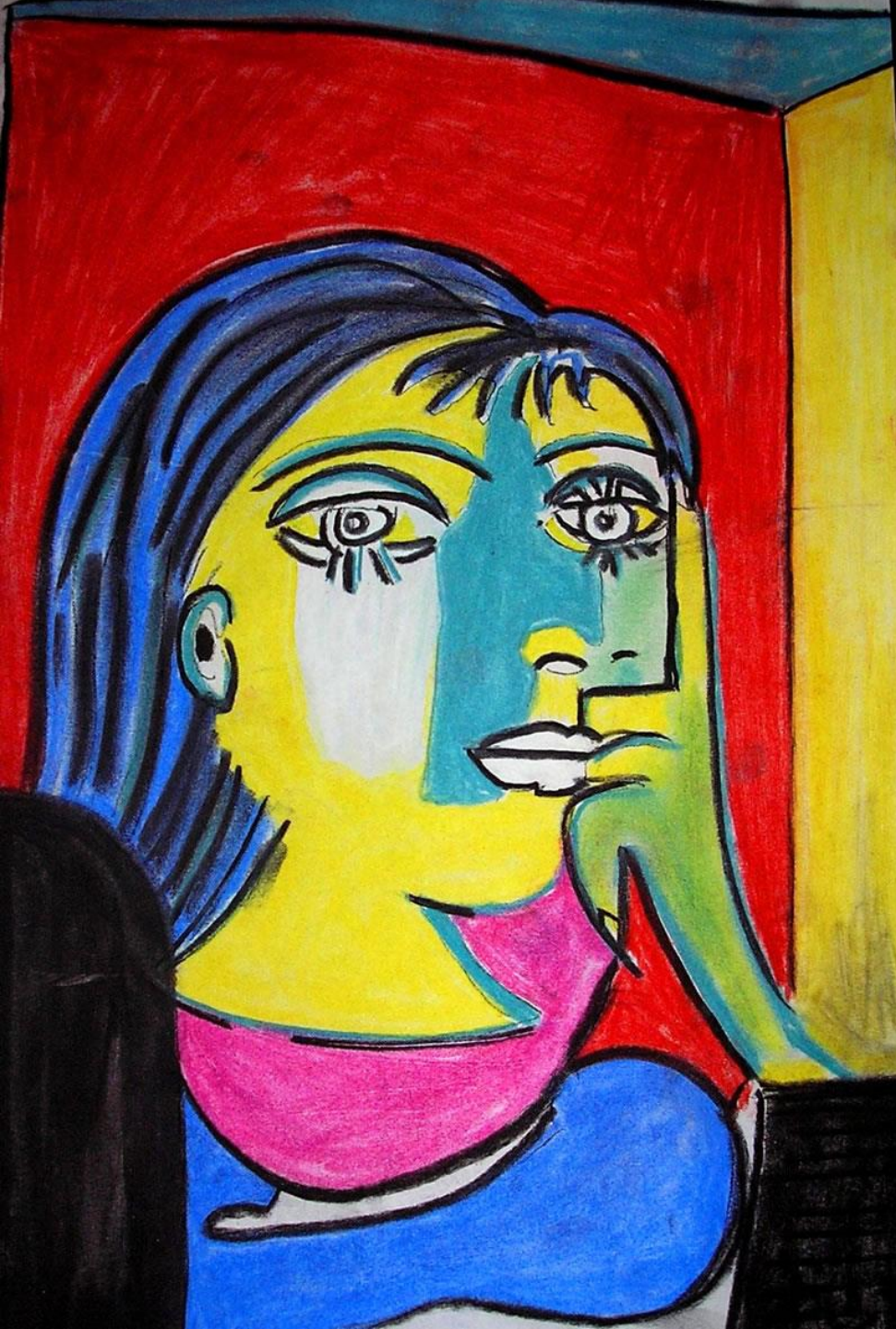
RETRATO DE MUJER PABLO PICASSO