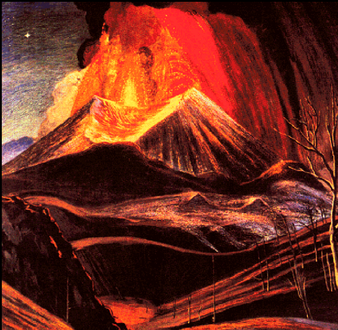
GERARDO MURILLO "DR. ATL" EL PARICUTIN