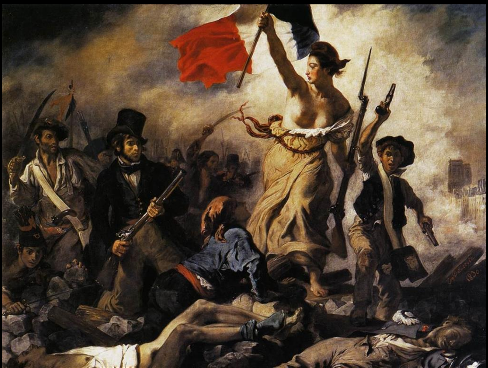
Ferdinand-Victor-Eugène Delacroix LA PATRIA GUIANDO AL PUEBLO