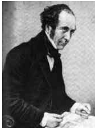
John Scott Russell