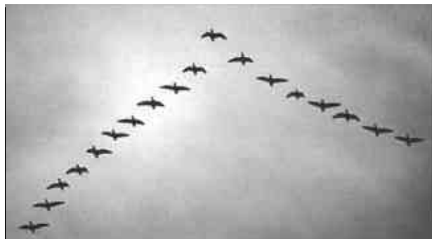
La estructura delta coherente de las aves emigrantes nos recuerda también a los solitones. En efecto, aquí hay una conjunción cooperativa de esfuerzos entre las aves débiles y fuertes para viajar a grandes distancias.

La pérdida de información en fibras ópticas se debe a varios fenómenos físicos, como se mencionó, y depende también de la longitud de onda de la luz. Comúnmente las pérdidas ocurren debido a la absorción; y para entender estas pérdidas, es necesario indagar cómo las ondas de luz interactúan con la materia.