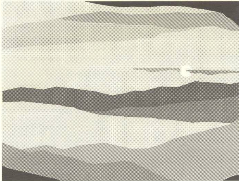
"Paisaje de útero al atardecer", (1995)

permite acumular y que se manifiesta como la posibilidad real de ir a trabajar al Norte. Lo que importa es poder realizar sus sueños posibles.