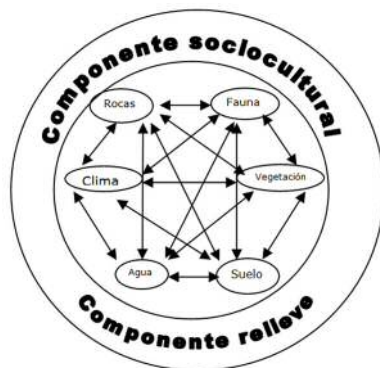
Figura 1. Diagrama adaptado para el estudio del sistema de barrancos del río Calderón, Estado de México. La inclusión de los componentes sociocultural y relieve es resultado del análisis realizado en el sistema. Fuente: García, 2002.

El método geográfico permitió ubicar al sistema de barrancos en el contexto local, regional y estatal, al mismo tiempo que aplicar criterios hidrológicos, geográficos, topográficos y ambientales para delimitar el sistema. Se estudiaron las condiciones fisiográficas, destacando su ubicación, coordenadas, condiciones climáticas, composición geológica, estructura geomorfológica, componentes hidrológicos, componentes biológicos, acceso al sistema y las condiciones socioculturales de las comunidades adyacentes. La delimitación cartográfica del sistema de barrancos se realizó con cartas topográficas y geológicas, escala 1:50 000, utilizando para esto el software ArcGis 9, ArcMap y la herramienta Georeference. Con el módulo de ArcCatalog se crearon los layers a manera de puntos, líneas y polígonos que corresponden a cada elemento capturado de las cartas topográfica y geológica, obteniendo finalmente la edición de los mapas.