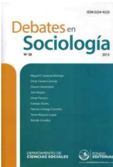
Portada de la revista Debates en Sociología de la PUCP, No. 38, 2013.