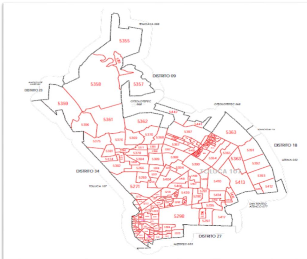
Figura 1. Mapa del distrito federal electoral XXVI, Toluca.