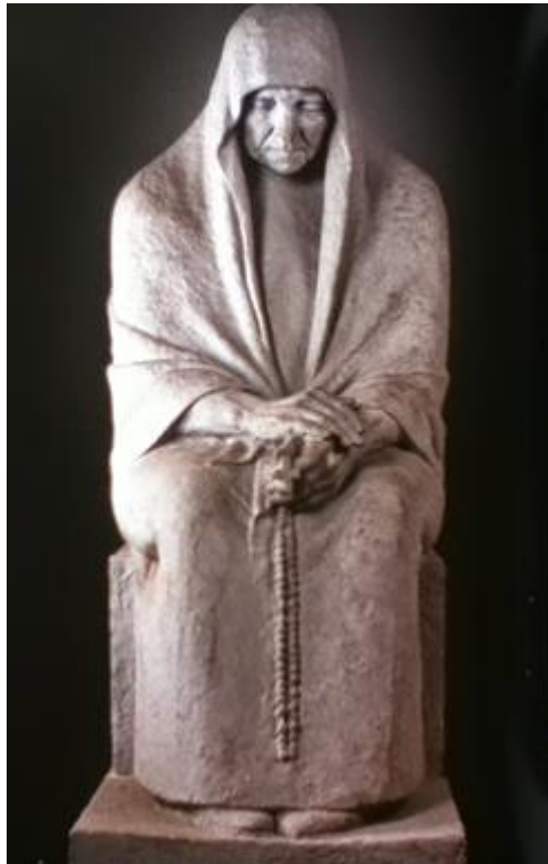
Escultura “Mi Madre” (Imagen tomada de http://terranoca.blogspot.mx/2014/05/ignacio-asunsolo-el-escultor-durangueno.html )

Es de destacar que los desnudos de Asúnsolo resultan en general sujetos y hasta pudorosos, no carnales, pero armoniosos y no carentes de gracia. Algunas de sus formas son a veces apenas sugeridas. Una de sus obras que mejor define esto es la escultura denominada “Mi Madre” que muestra una figura cerrada, vuelta completamente hacia el interior de sí misma, manifestando una atención concentrada, quizá hacia la religión. En esta obra no puede verse afectísimo, ni movimiento, pero refleja un expresión de piedad en las manos posadas una sobre la otra.