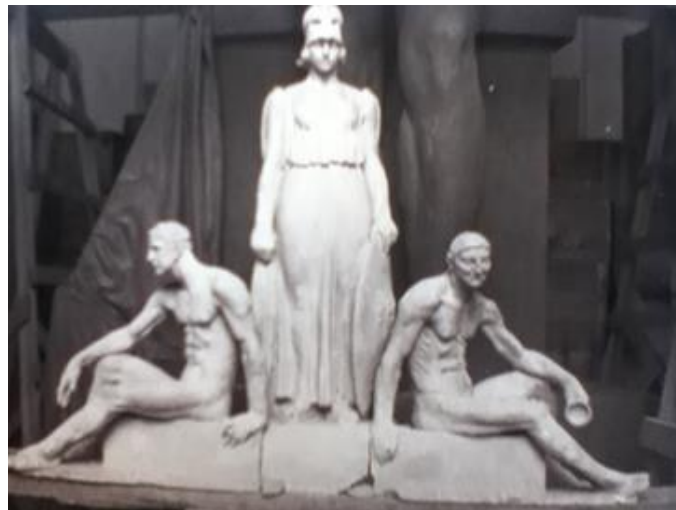
Conjunto escultórico de Apolo, Dionisio y Minerva que se encuentra en el frontispicio de la Secretaría de Educación

No hay que cabe la menor duda de que Ignacio Asúnsolo fue el escultor más apreciado por José Vasconcelos. Parte importante de su biografía son las palabras de alabanza que éste le dedicó con motivo de la terminación del frontispicio que remata la fachada del Edificio de la Secretaría de Educación, consistente en un conjunto escultórico formado por Apolo, Dionisio y Minerva.