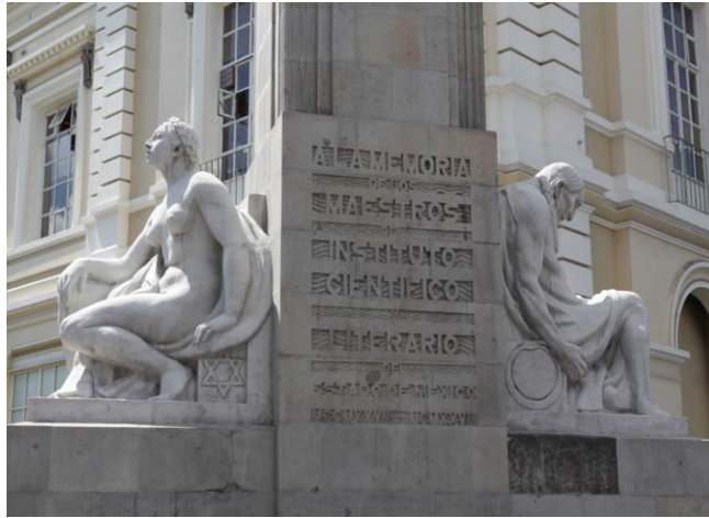
Monumento a los Maestros