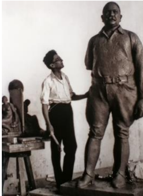
Asúnsolo y su obra en honor a Álvaro Obregón terminada en 1935 y que se encuentra en la ave. Insurgentes Sur

Numerosas fueron las obras producto del genio creativo de este gran escultor y no obstante su educación eminentemente católica, en todas ellas se distingue un toque de liberalidad, acorde con la época que le tocó vivir.