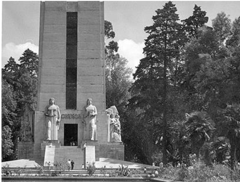
Monumento a Obregón en el parque la Bombilla. Aspecto de la guardia ante el monumento