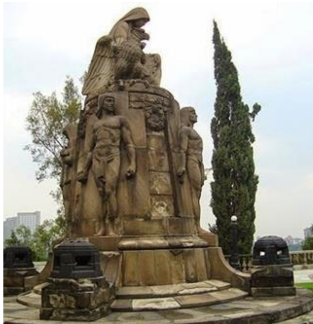
Monumento a los Niños Héroe

Pero quizá el clímax de su homenaje a la mujer lo plasmó en el Monumento a los Niños Héroe, en donde modeló a la patria como una matrona enlutada, fuerte, noble, con una expresión de tranquilo dolor, representando a la mujer mexicana con una gran severidad en la madurez del espíritu.