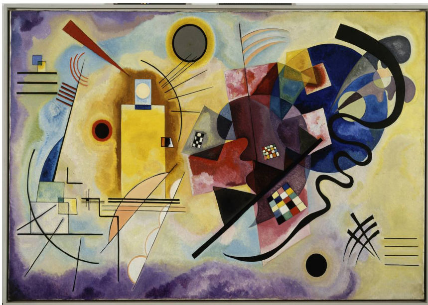
Kandinsky, Vasili (1925). Amarillo, rojo, azul (Óleo sobre tela) Museo Nacional de Arte Moderno, Centre Georges Pompidou. París, Francia

corazón, boca, lápiz, verde, amarillo, rojo, azul, lluvia, tierra, viento, amor. Las pinturas de Vasili Kandinsky son sobre todo disposiciones de elementos diversos que configuran una desterritorialización, con diversas líneas de fuga posibles.