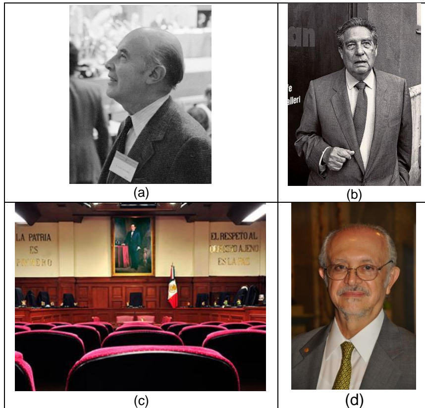
Premio Nobel de la Paz 1982: Alfonso García Robles (a); Premio Nobel de Literatura 1990: Octavio Paz Lozano (b); Premio de Derechos Humanos de las Naciones Unidas de 2013: Suprema Corte de Justicia de la Nación Mexicana (c) y Premio Nobel de Química 1995: Mario Molina Henríquez (d)