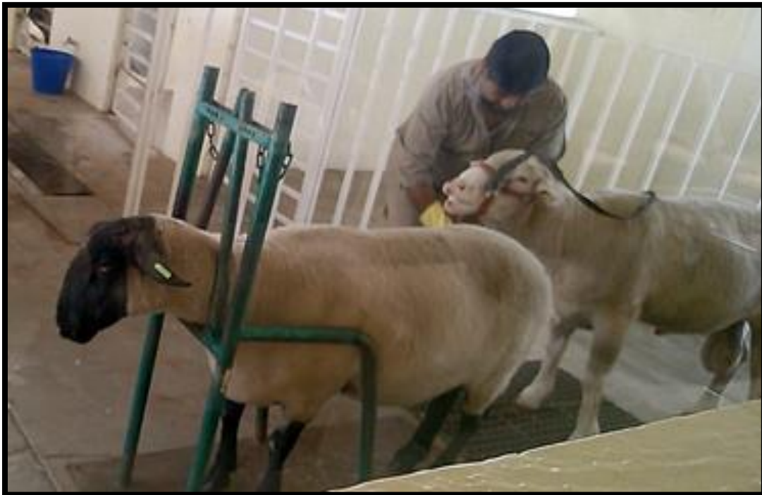
Figura 4. Hembra maniquí instalada en el potro y macho previamente aseado.

Previo a la extracción del semen, se realiza una limpieza en el carnero (lavado y secado del prepucio) para evitar cualquier contaminación sobre la muestra seminal; la hembra maniquí se instala en el potro. El operario en posición de cuclillas se coloca al lado derecho de la hembra. Al momento de la monta se desvía el pene introduciéndolo en la vagina artificial.