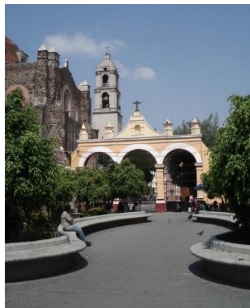
Molino de flores

Capilla de la Enseñanza Primera escuela de América latina, Fray Pieter Van der Moere, conocido como Pedro de Gante, fundó la primera escuela de la Nueva España.