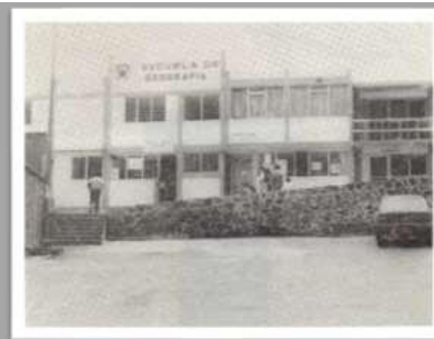
Figura 7. Escuela de Geografía desde 1979.