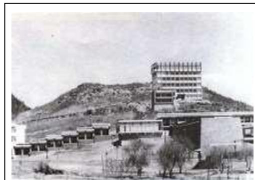
Figura 1. Torre de Humanidades, Ciudad Universitaria, Cerro de Coatepec, Toluca, 1971.

Fue el 18 de septiembre de 1970 cuando el Consejo Universitario aprobó la creación del Instituto de Humanidades (IH), antes Facultad de Filosofía y Letras, y con él la Licenciatura de Geografía. Las primeras clases de Geografía se impartieron en salones del Edificio Central de Rectoría; posteriormente, el Instituto se trasladó al Cerro de Coatepec, en la entonces Torre de Humanidades (figura 1).