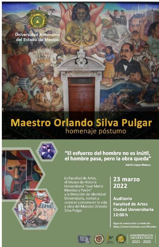
Fig. 1 Cartel alusivo al evento. Diseño: Karen Gómez Gómez

A las 12 del día el auditorio estaba lleno con familiares, amigos, integrantes del Colegio de Cronistas, miembros de la comunidad de artes e invitados que admiran y se interesan por la obra del maestro Silva.