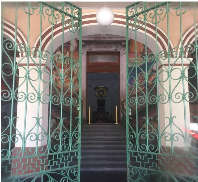
Fig. 8 Acceso principal al Edificio Histórico de Rectoría de la UAEMex. (Autora: María del Carmen García Maza, 2022, acervo del MHUJMMYP)

El espacio elegido para pintar el mural se encuentra frente a la entrada del edificio, invade la mirada del visitante apenas cruza las rejas verdes que lo resguardan. Cubre el cubo de la escalera principal, en su primer descanso se encuentra la entrada al Aula Magna, recinto en el que se realizan las ceremonias más importantes de la institución y de ahí la escalera se bifurca.