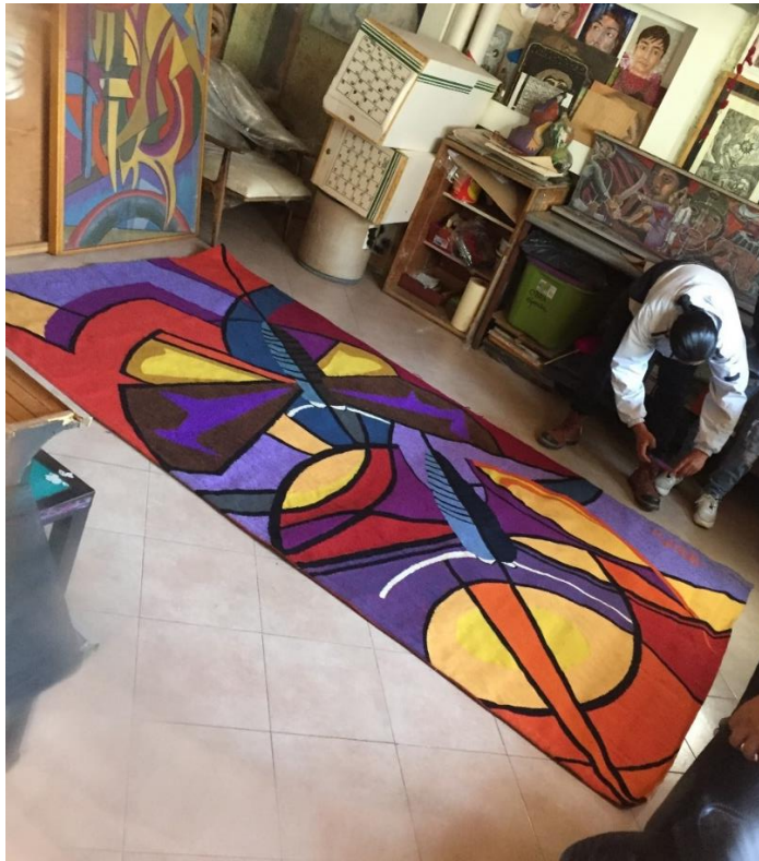
Fig. 10 Tapete de Temoaya con diseño de Orlando Silva. (Autora: María del Carmen García Maza, 2022, acervo del MHUJMMYP)

se encuentra en manos de su familia y de quienes fueron sus amigos.