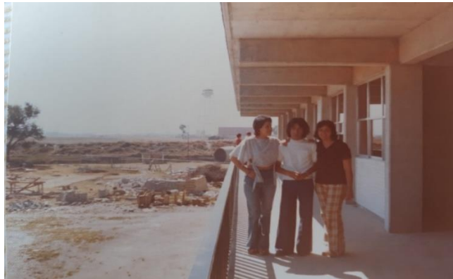
Fig. 4. Fotografía Árbol del Capulín y estudiantes.