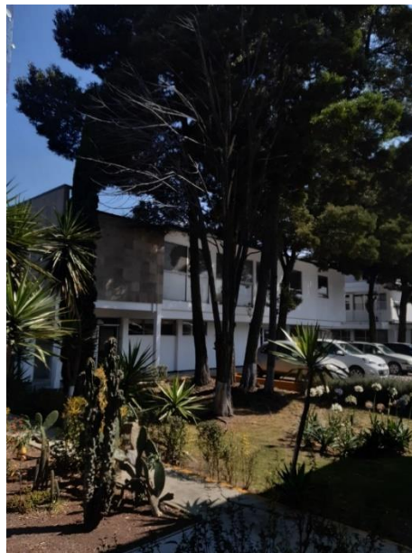
Fig. 2. Árbol de las manitas

El árbol de las manitas en nuestra facultad (lamentablemente ya está inanimado) se encuentra ubicado al frente del edificio del control escolar y frente a la puerta del acceso al escenario del auditorio, considero que este árbol debe ser identificado y conocido como un símbolo más de identidad local Tolucaense, de identidad universitaria y especialmente de identidad de la Facultad de Ciencias de la Conducta por parte del alumnado.