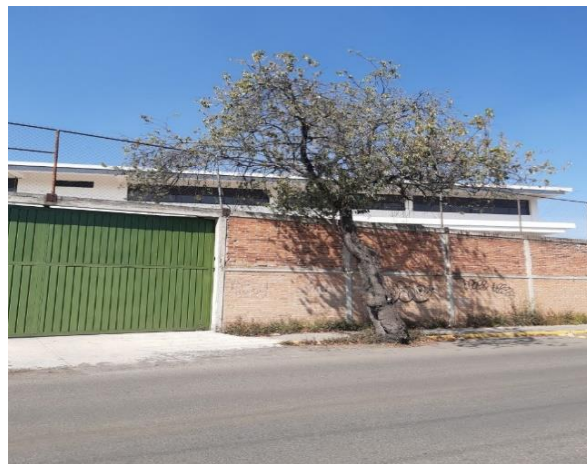
Fig. 3. Fotografía/ Árbol de Capulín/ / 02-05-2022

Es en la difusión de la identidad a través de la historia, donde deseo imprimir la referencia de tres símbolos (El Árbol de la Mora, El Árbol de las Manitas y el Árbol de Capulín) que han formado parte de la identidad dentro de nuestra facultad; en esta ocasión haré referencia al Árbol de Capulín, que desde que se colocó la barda perimetral quedó fuera de ella, pero vale la pena recordar que en su origen, la facultad, no contaba con dicha barda, y el árbol del capulín que se ubica en la entrada correspondiente a la Avenida del río Verdigué, era en sus orígenes el límite que marcaba la parte del río que se encontraba a cielo abierto, y que dada la condición del río en ese entonces, no había ingreso por esa parte en los orígenes de la Facultad.