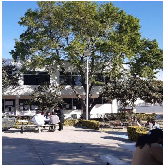
Fig. 1. Fotografía de la Mora.