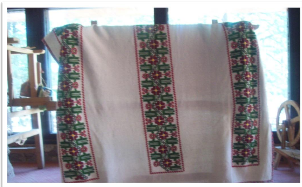
Fotografía 1: Colcha de lana tamaño matrimonial, hecha con punto de cruz.