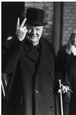
(Churchill haciendo la “v”, 1941)

al Servicio Secreto británico para que el premier usara la V como un gesto popular de victoria frente a la esvástica de los nazis. (Gavaldà, 2020)