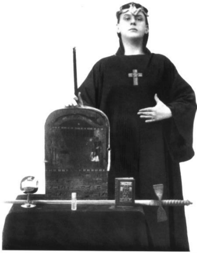
[Crowley Joven]. (1895).

A sus 20 años, Crowley comenzó a estudiar Letras en Cambridge, alejado del control familiar, escribió sus primeros ensayos, novelas y poemas eróticos. Allí también empezó a mostrar un gran interés en la magia tras leer el libro La Cábala desvelada (Gavaldà, 2020) y durante esta época logró ingresar en una de las más prestigiadas órdenes de magia de su tiempo: la Orden Hermética de la Aurora Dorada .