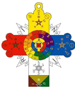
Emblema mágico de la Golden Dawn.

Su propuesta mágica -de la Golden Dawn- se funda sobre una vinculación sistemática entre varios conjuntos simbólicos como la cábala, tarot, astrología, alquimia, hermetismo, pertenecientes a la llamada “tradición occidental”, algo similar con la Sociedad Teosófica, que, a diferencia de la primera, la Golden Dawn no solo uso doctrinas mágica, sino que también uso otras ramas del ocultismo -astrología y alquimia- para la realización de sus prácticas.