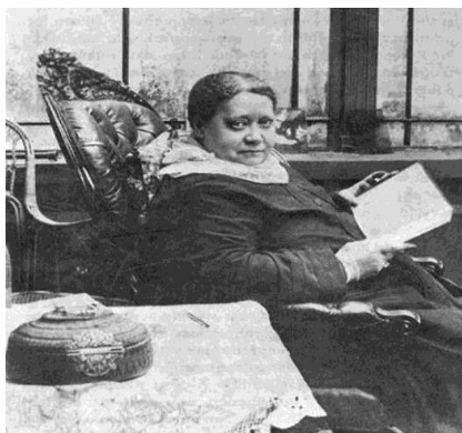
Helena Blavatsky leyendo. (Desconocido, 1887)

Ya que se ha mencionado a Helena Petrova Blavatsky, hay que decir que un último rasgo del ocultismo -del cual la magia es apenas una de sus ramas- es la creciente participación femenina. La “democratización” del ocultismo cuestiona la separación de magia culta y magia popular. Esto se hará subvirtiendo la división sexual dominante, que asignaba la Alta Magia a los hombres y la magia popular a las mujeres. El feminismo creciente en la sociedad occidental también se va a hacer notar en el ámbito ocultista, ya que no sólo como administradoras de alguna doctrina sino como instauradoras y dirigentes de sociedades iniciáticas, dando con ello un dote de empoderamiento y sobre todo la de ser maestras en estas ciencias que estuvieron dominadas durante años por hombres.