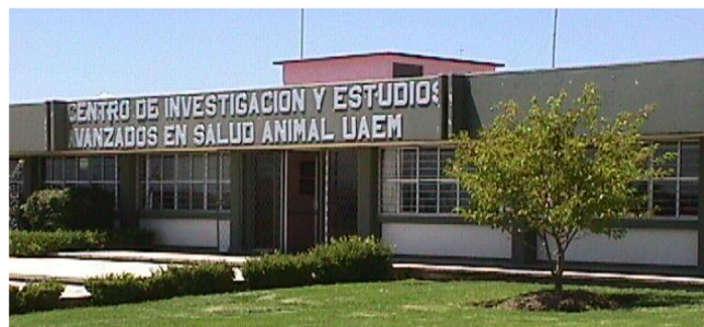
Fachada principal del Centro de Investigación y Estudios Avanzados en Salud Animal (CIESA).