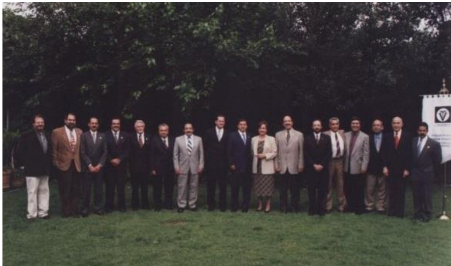
Médicos Veterinarios Zootecnistas que han recibido la "Presea al mérito veterinario" del Colegio Estatal de Médicos Veterinarios Zootecnistas, A.C.. Agosto de 2002