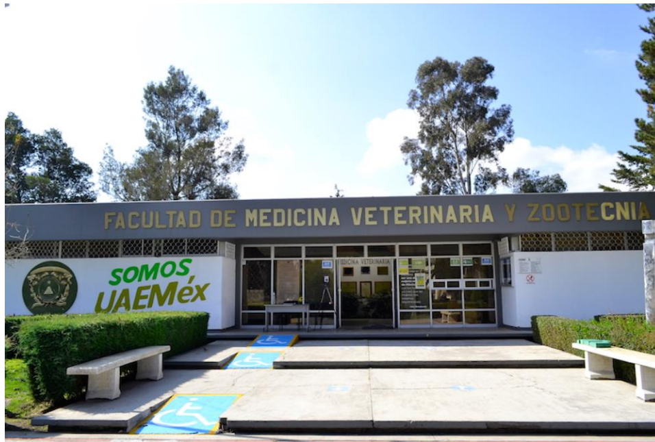
Fachada de la entrada al Edificio Administrativo de la Facultad de Medicina Veterinaria y Zootecnia de la UAEM. (FMVZ-UAEMex, 2022)

A partir de 1984 y hasta su jubilación el 31 de diciembre de 2019 se desempeñó en la Facultad como Catedrático de Tiempo Completo Definitivo categoría “F”, impartiendo clases en la licenciatura de las asignaturas de Clínica de aves, Zootecnia de Aves, Inmunología y Bacteriología y Micología; en la Maestría en Salud Animal en las asignaturas de Infectología y cuando pasó a ser Maestría en Ciencias Veterinarias en las asignaturas de Investigación I y II. (Bringas, 2022)