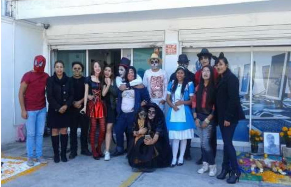
Concurso de disfraces asignatura individuo y sociedad (inclusión)

Aprender y enseñar se convierte en un gran desafío especialmente ahora ya que estamos rodeados de tecnología, redes sociales, distractores que desorientan a los alumnos cuando esta no se usa de manera correcta, empezar a adquirir nuevas estrategias para que estos se interesen en estudiar.