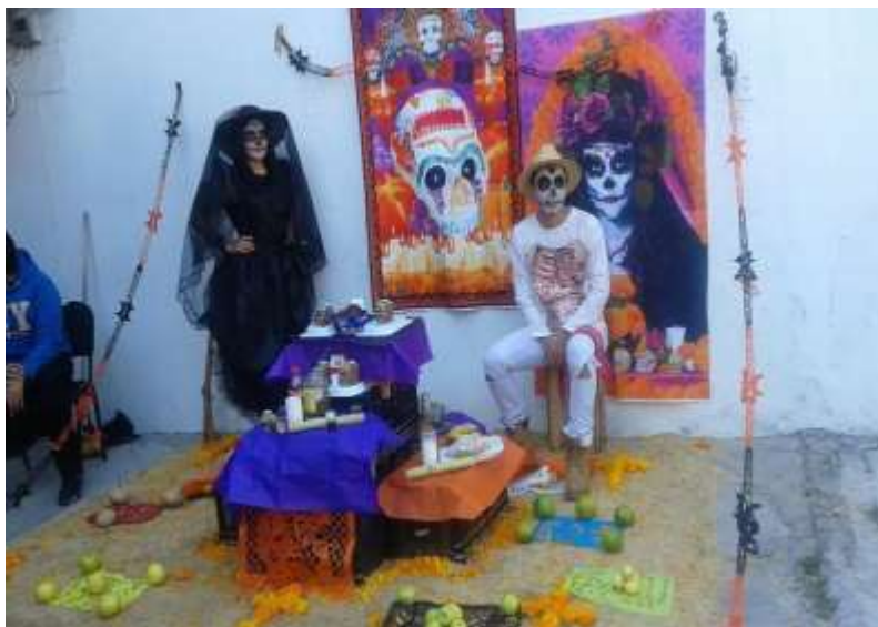
Presentación de ofrendas asignatura Historia de México

pienso que la formación cívica y ética sería ideal para el antropólogo, ya que tiene un carácter eminentemente humano, así cada uno puede sentirse implicado dentro de los temas que estudiábamos dentro de los módulos. En este periodo laboral, ser docente e impartir una diversidad de materias en bachillerato, compartir sentimientos similares con los alumnos, ponían más atención, su retención de datos de aprendizaje eran mucho mejor. Ahora contamos con el apoyo de la pedagogía, antropología de la educación, para mejorar la calidad de la misma.