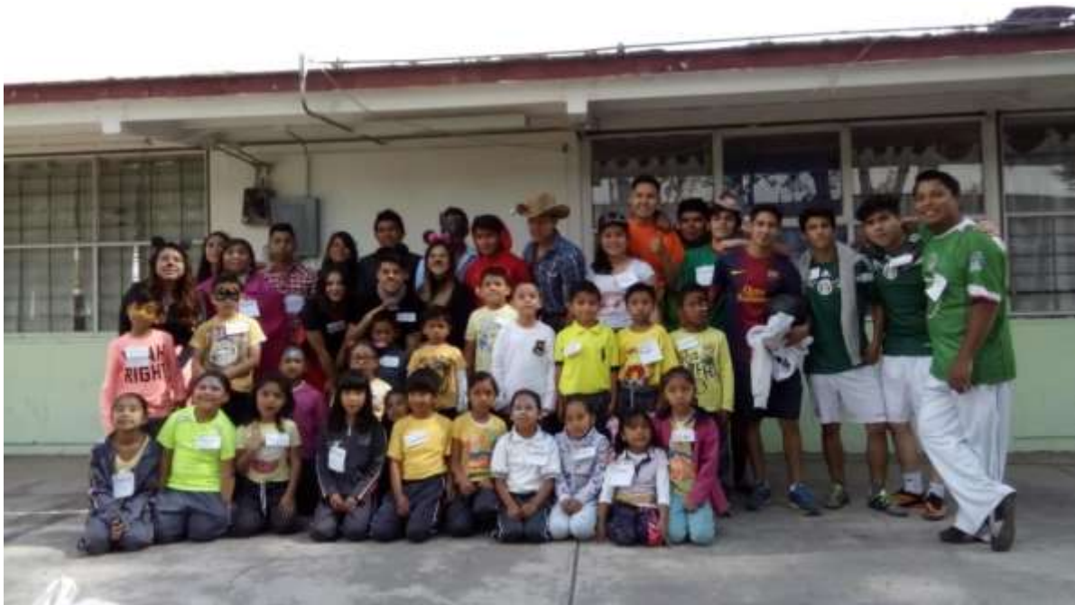
Actividad con participación en primaria para celebrar el día del niño asignatura ética

metas cuando de verdad estas comprometido con la educación Otras escuelas exigen calidad por lo que te lleva a prepararte el doble, y aun así este trabajo sigue siendo subestimado, y desechable. La misión del docente independientemente de lo individual, es proponer que el estudiante se interese porcontinuar, o por aprender lo mínimo, ya que es una satisfacción, ver a los alumnospreparados.