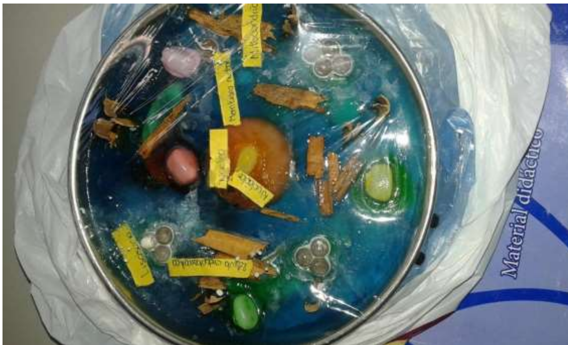
Maquetas “La célula” asignatura biología

Cambie mi evaluación haciéndola más dinámica, y pues como el trato es con adolescentes una estrategia fue utilizar tecnología, redes sociales, y actividades que hicieran participar a los alumnos, cabe mencionar que todos participaban.