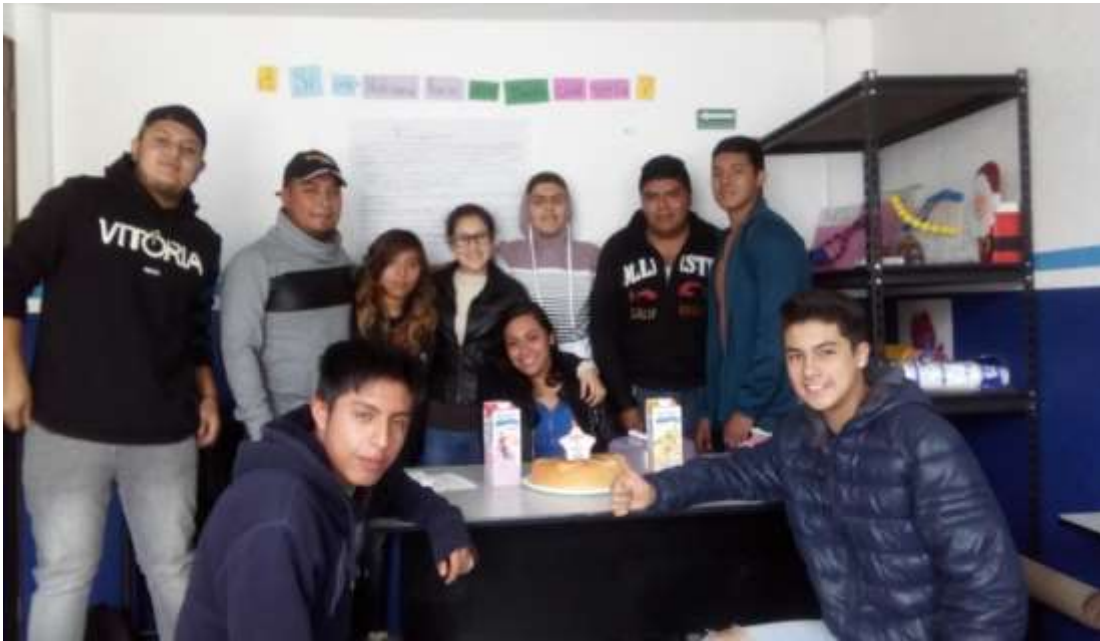
Grupo de lunes a viernes

Hice la misma dinámica que había hecho en la semana, facilitaron la clase, ellos tenían trabajo previo así que empezaron a trabajar y a exponer, con ellos cambie totalmente la evaluación que se les había asignado, ya que eran personas que deseaban terminar sus estudios, pero trabajaban, repito cada alumno tenía materias diferentes.