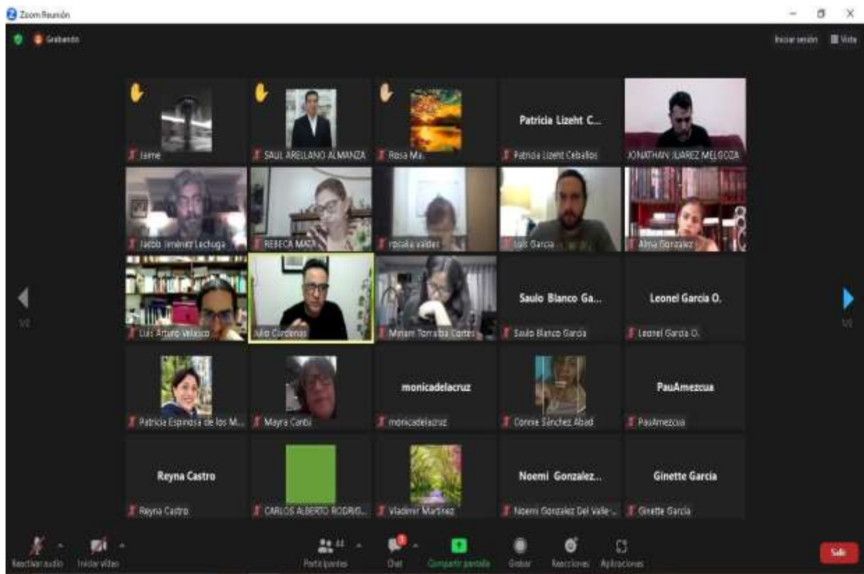
Uso de plataforma zoom clase de filosofía