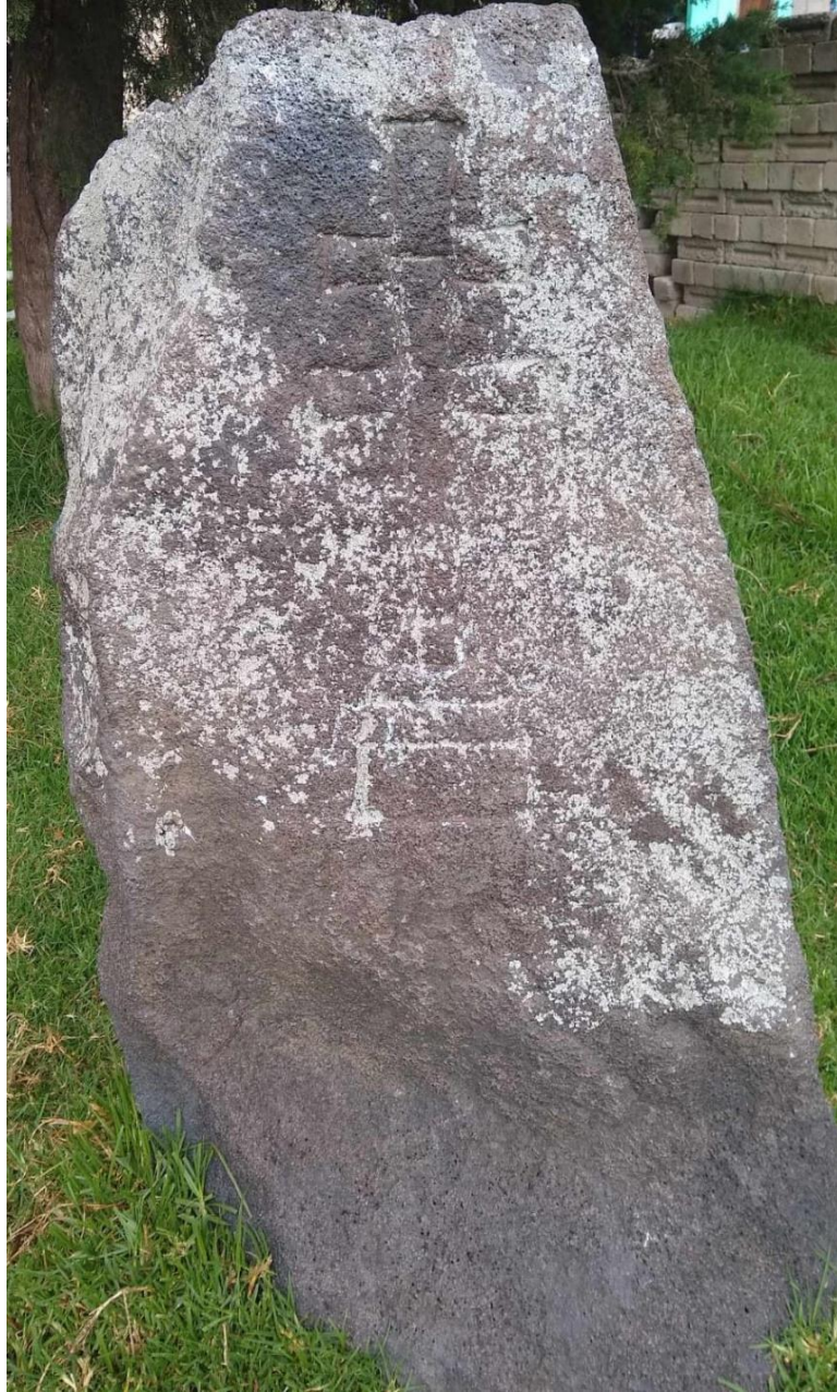
Fotografía tomada por Laritza Martínez González de la mojonera entre Santa Cruz Atizapán y Almoloya del Río, se reconoce como mojonera porque tiene labrada la Santa Cruz de Caravaca.