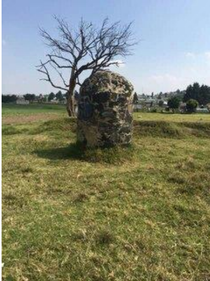
Mojonera de Santa Cruz Atizapán “Aculco” ubicada en las tierras de Chapaniel., que es el punto trino en el que colindan Santa Cruz Atizapán, Texcalyacac y el pueblo de San Lucas Tepemajalco, (Municipio de San Antonio la Isla)