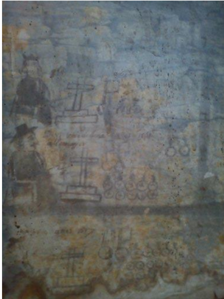
Fuente: Fotografía tomada por Laritza Martínez, matrícula de tributo que contiene el Título Primordial de Santa Cruz Atizapán, resguardada por el presidente de bienes comunales, Aurelio Monroy.