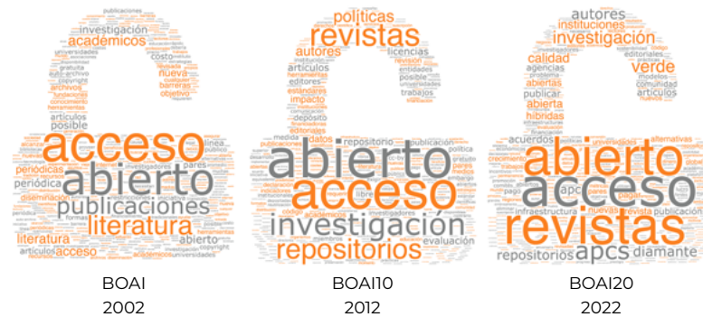
Figura 1. La evolución en el discurso de la Budapest Open Access Initiative