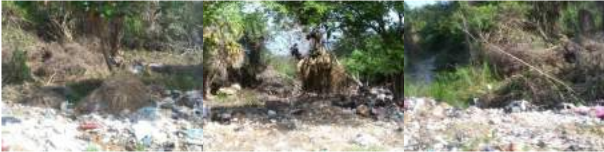
Imagen 2. Tiraderos clandestinos identificados en la zona de La Sabana.