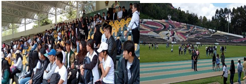
Imágenes. Visita guiada a Ciudad Universitaria por estudiantes. Centro Universitario UAEM Atlacomulco. 24 y 25 de agosto de 2023. Toluca, México.