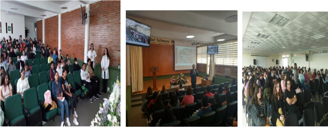
Imágenes. Jornada de inducción para estudiantes de la generación 2023. Centro Universitario UAEM Atlacomulco. 4, 5, 6 y 7 de julio de 2023. Atlacomulco, México.