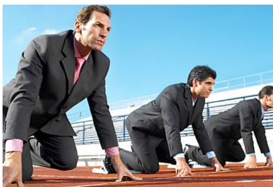
Las Pymes son el futuro del país... ¿Qué hacemos por cuidarlas?

La consultoría es costosa, no es para las Pymes y no la necesito son algunos mitos que se deben superar para tener un verdadero motor de crecimiento.