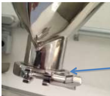
Tapa de vaciado