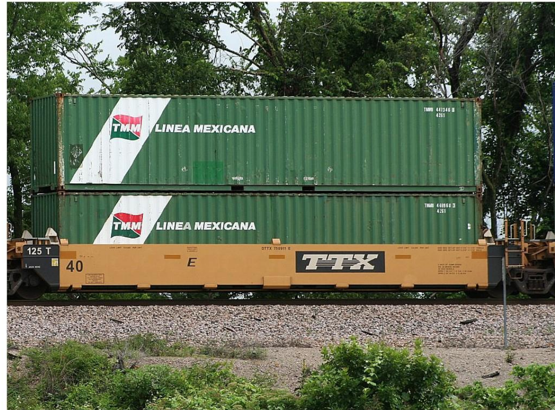
contenedores sobre vagones de plataforma

Los servicios de fletes intermodales terrestres se dividen en contenedores sobre vagones de plataforma (containers on flatcars COFC) y remolques de camiones sobre vagones de plataforma (truck trailers on flatcars, TOFC), algunas veces denominados sistemas de peso a costas.