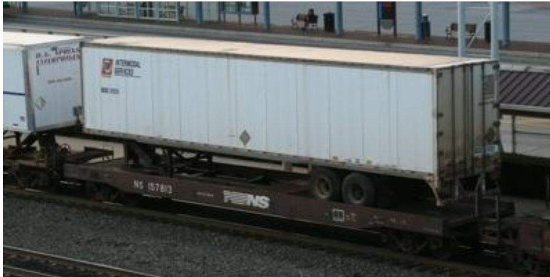
remolques de camiones sobre vagones de plataforma

Este segmento permite a los transportistas tomar ventaja de las fuerzas relativas de dos modos ; por ejemplo, los embarques se pueden beneficiar de las economías de largos recorridos por ferrocarril, a la vez que aprovechan los atributos de un servicio de puerta a puerta de los camiones.