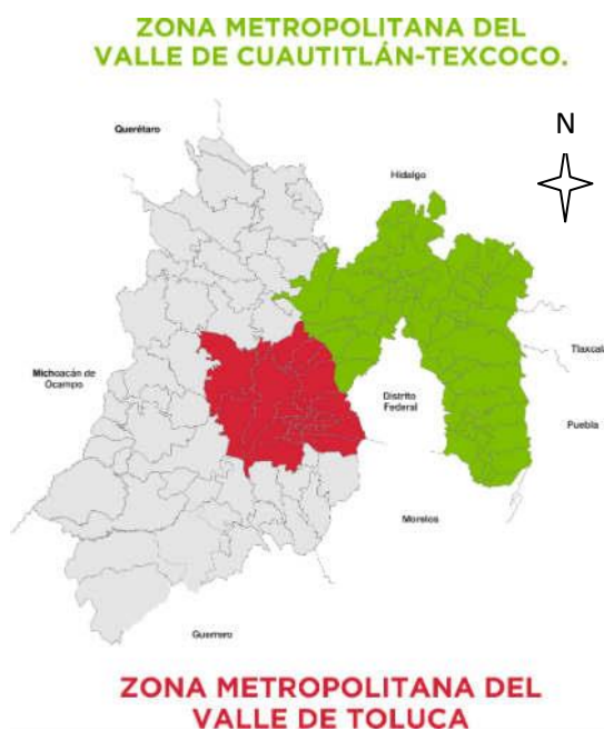
Mapa 1 Localización de las dos zonas metropolitanas del Estado de México, 2008