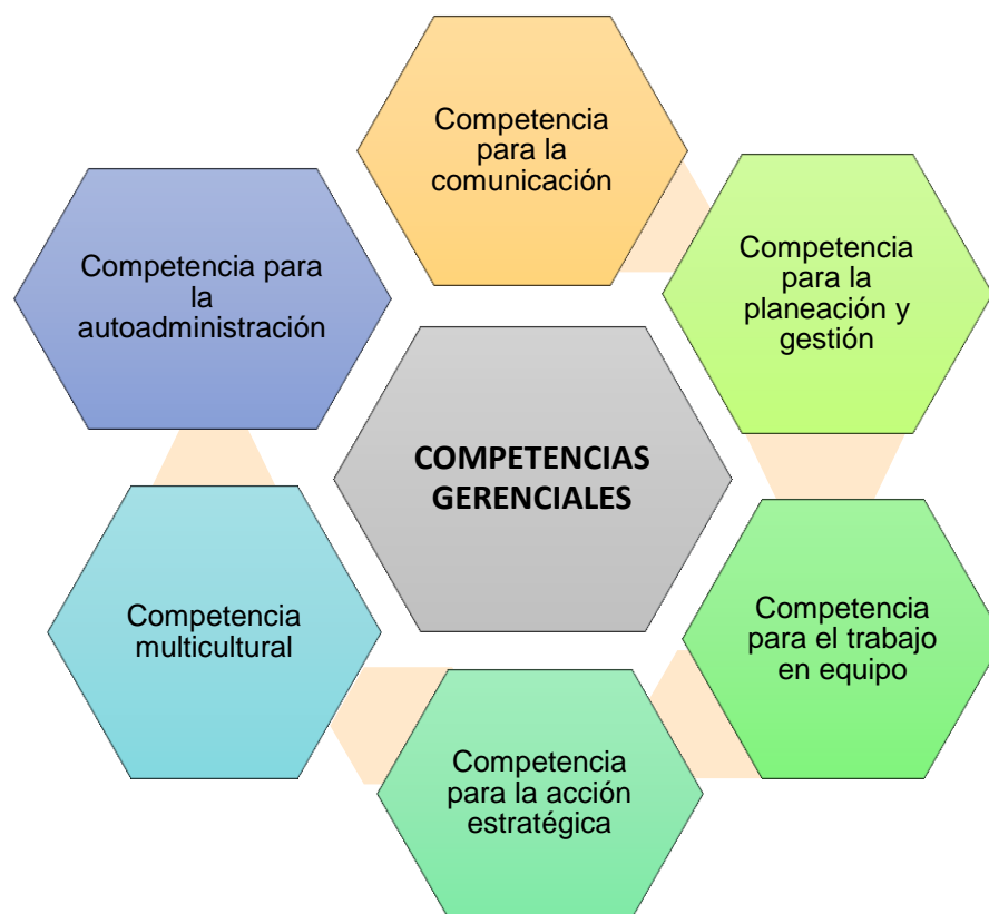
Figura 1: Modelo de competencias gerenciales