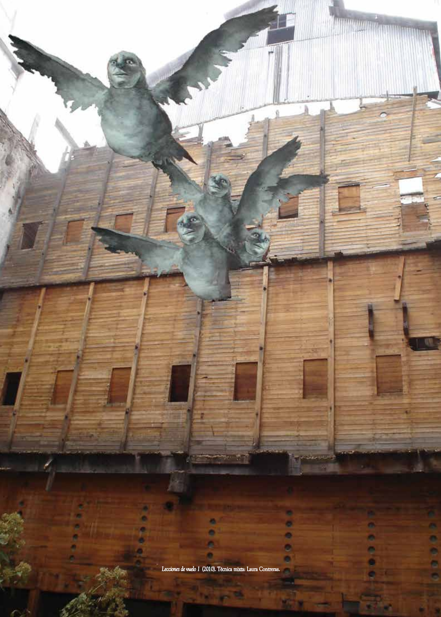
Lecciones de vuelo 1 (2010). Técnica mixta: Laura Contreras.