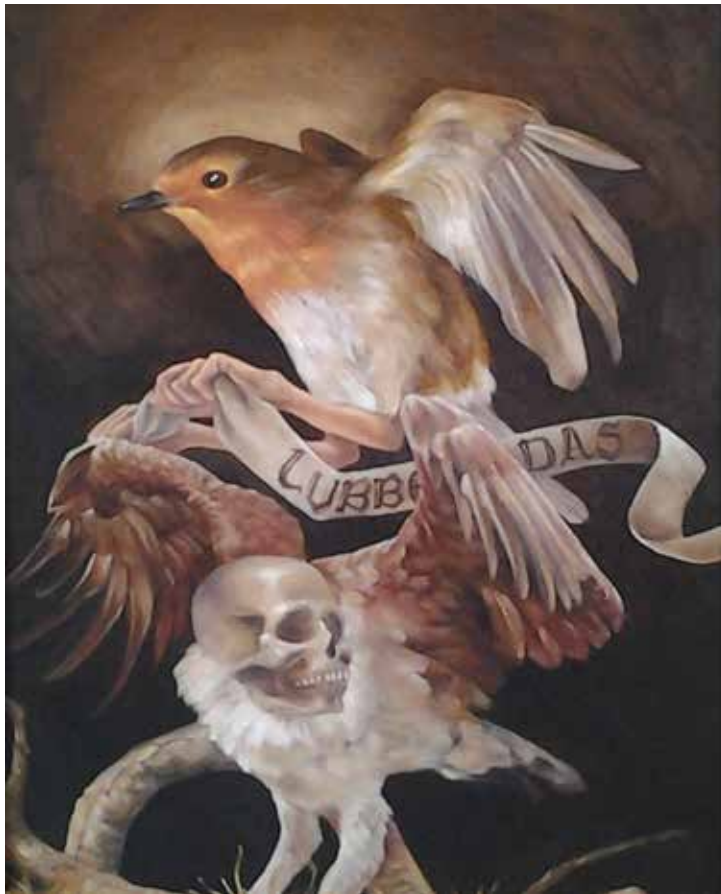
Eros & Tanatos (2015). Óleo: Laura Contreras.

Las influencias, o mejor dicho, coincidencias que podemos rastrear en el caso de la artista son múltiples e incluyen la ilustración de corte fantástico, los cómics, las lóbregas creaciones de Joel-Peter Witkin, la pintura expresionista, la cultura pop y la representación gótica de Santiago Caruso, entre otras. Estos encuentros han creado el cuerpo de una obra plástica rara, pero necesaria en el contexto local.