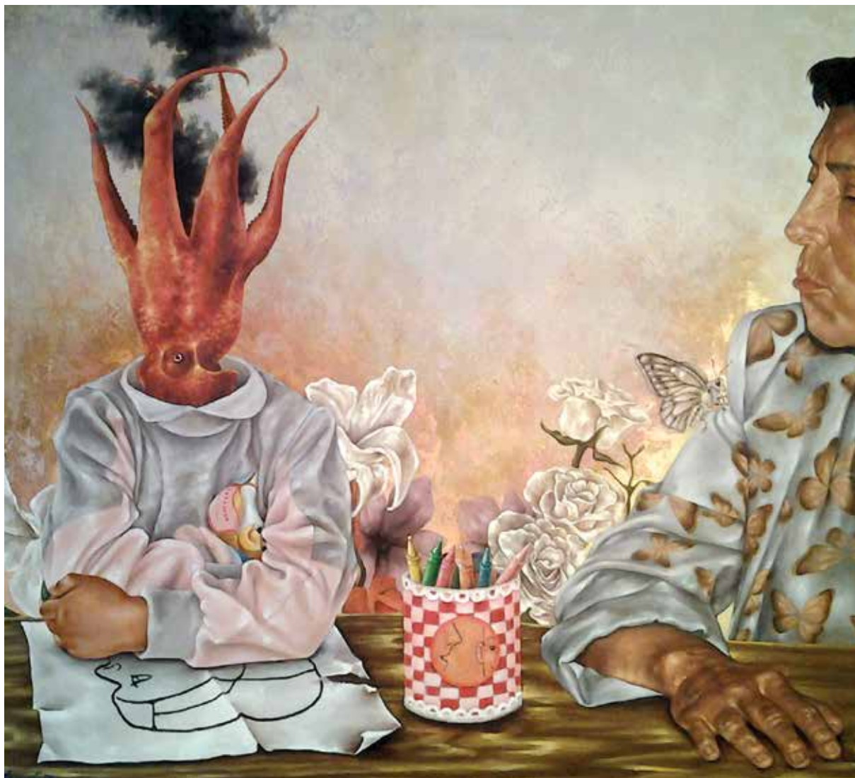
Residente (2014). Óleo: Laura Contreras.

De la misma manera vemos objetos, por ejemplo un caballo de juguete, que previa metamorfosis simbólica pareciera que lucha desesperadamente por evadirse de su condición objetual —aún más, de su propia condición de representación de objetos— para cobrar vida mediante la adopción de las actitudes, las poses y la superficie, casi piel, de un ser vivo.