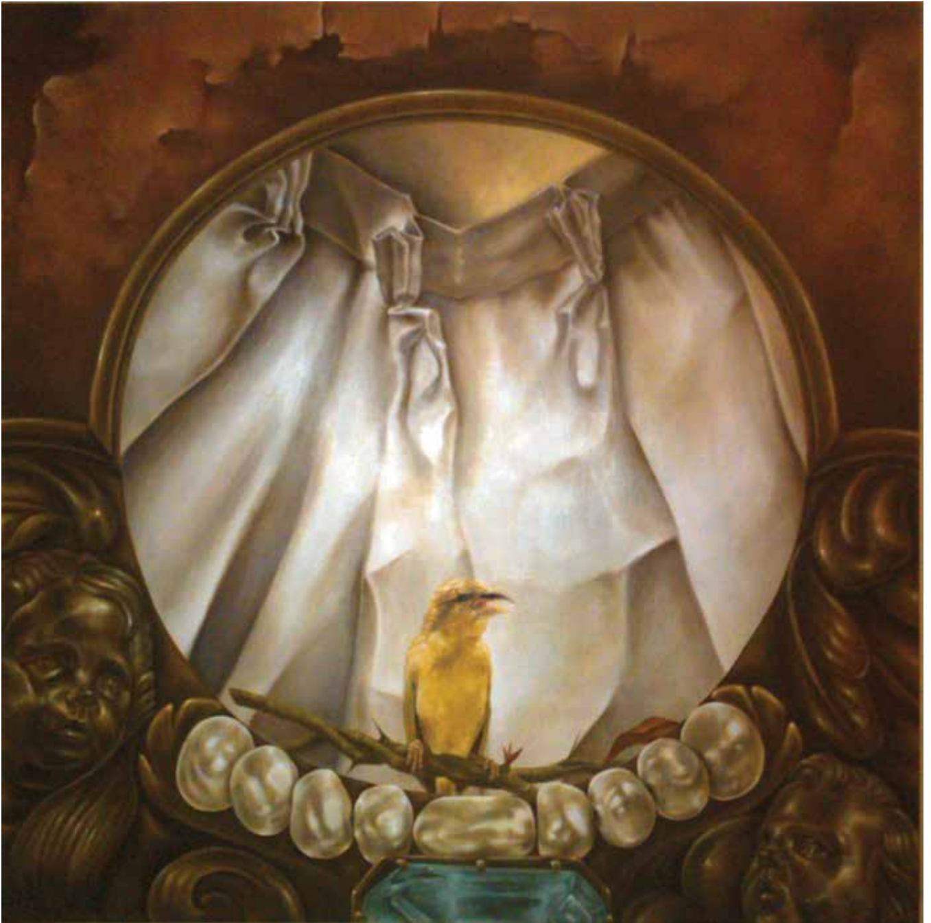
Conflicto de libertad (2013). Óleo: Laura Contreras.