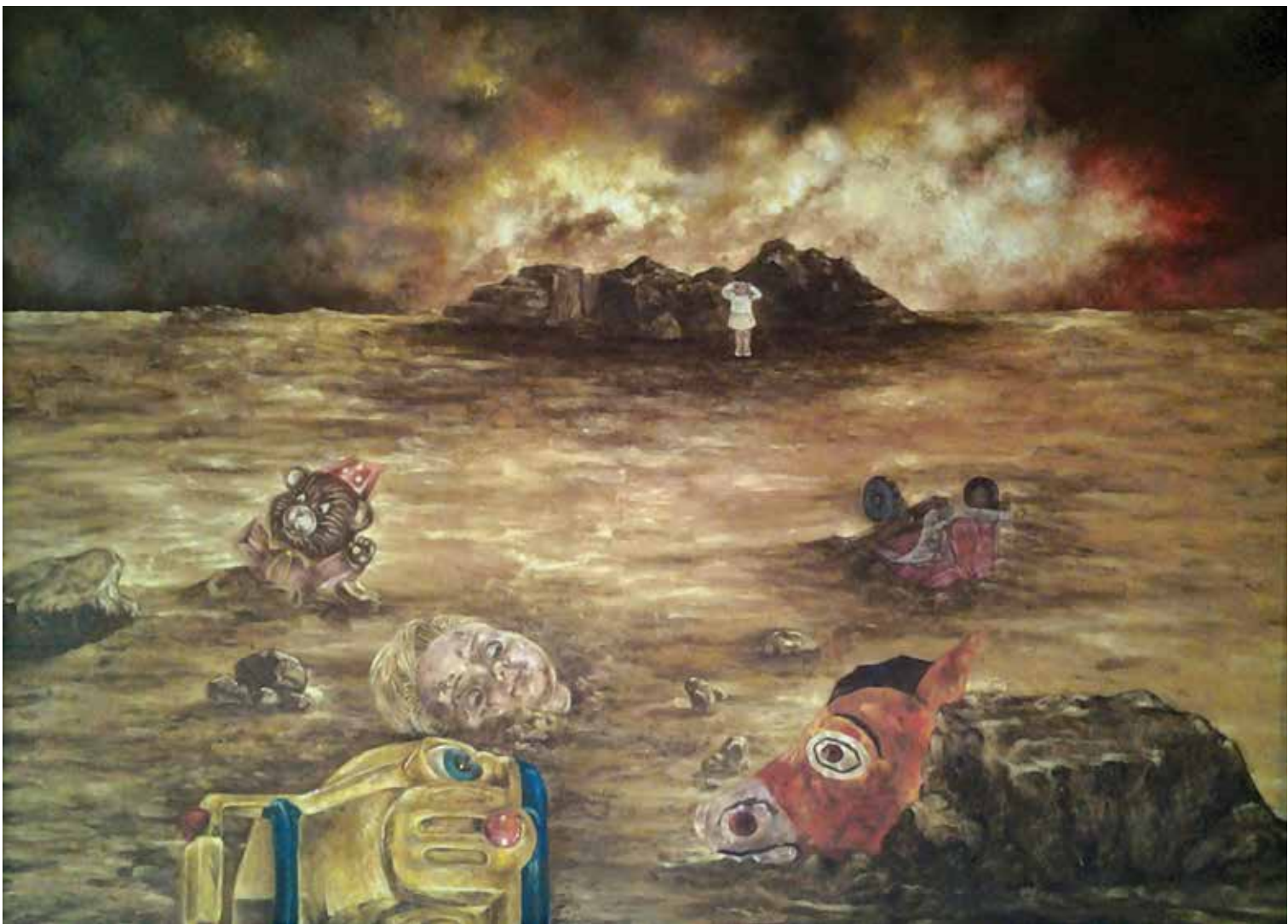
Recuerdos (2011). Óleo: Laura Contreras.