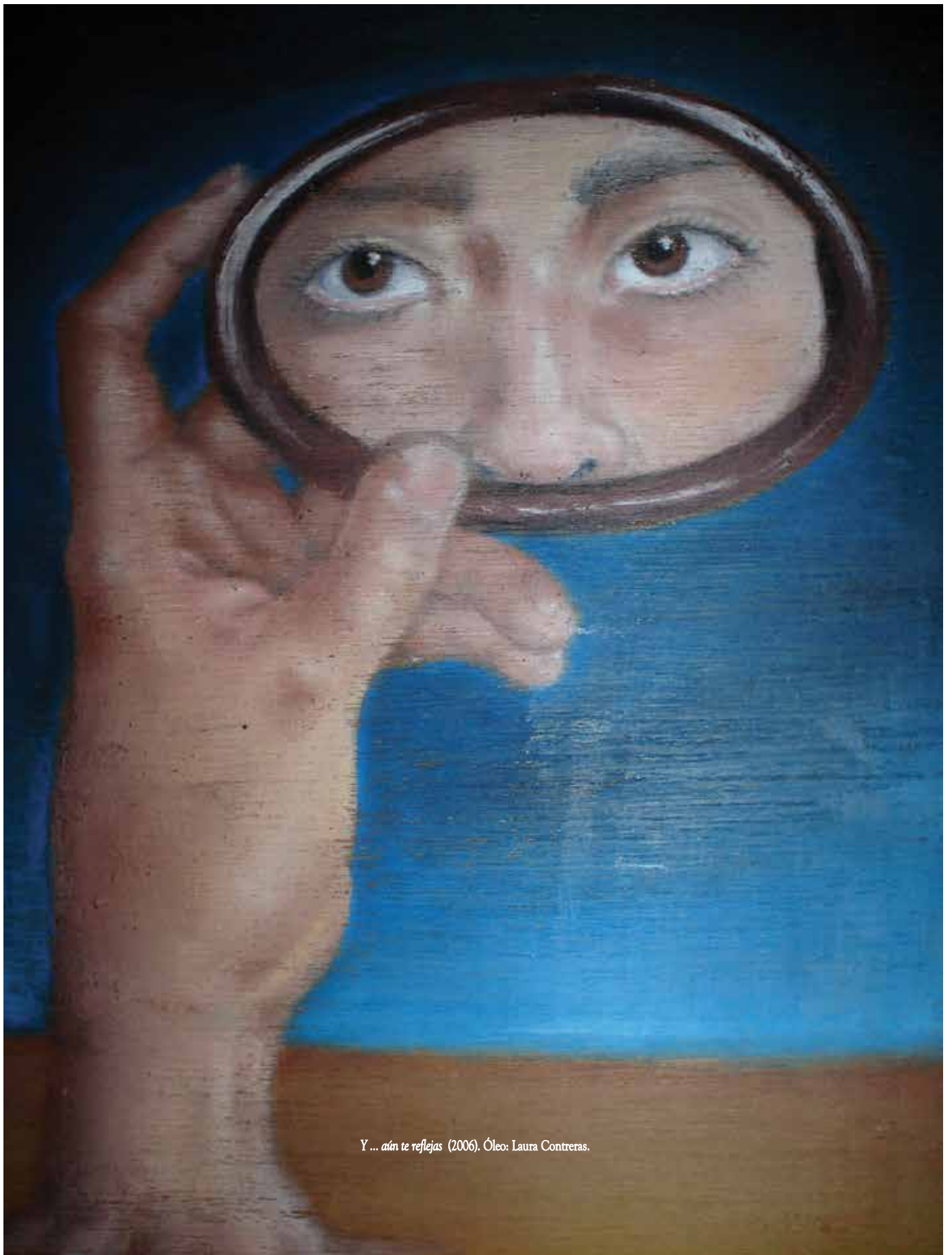
Y ... aún te reflejas (2006). Óleo: Laura Contreras.