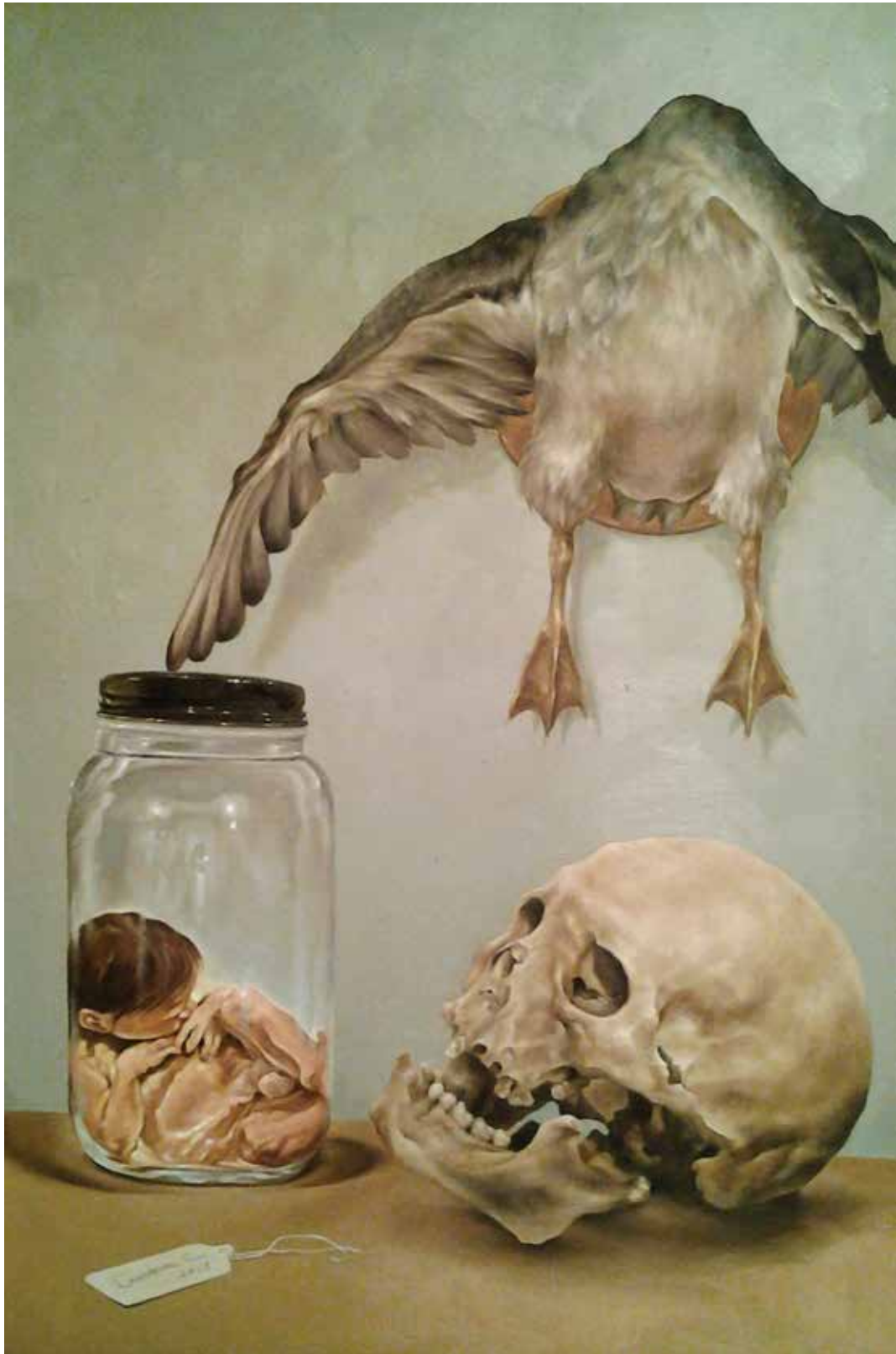
Contemplación (2015). Óleo: Laura Contreras.