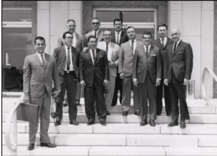
Visita al laboratorio LEDERLE, CYANAMID 1964. Nueva York, Estados Unidos de Norteamérica.