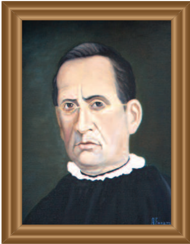
Presb. ( Presb. ) José María García (1857) Óleo sobre tela ( Oil on Canvas ). Augusto Escamilla Guzmán .39 X .49 cm. Original