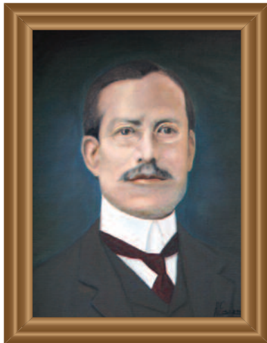
Profr. ( Profr. ) Antonio Albarrán (1916) Óleo sobre tela ( Oil on Canvas ). Augusto Escamilla Guzmán .39 X .49 cm. Original