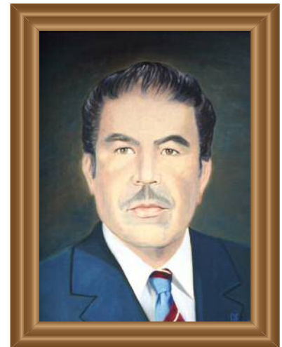
Lic. ( Lawyer ) Mario Colín Sánchez (1952) Óleo sobre tela ( Oil on Canvas ). Augusto Escamilla Guzmán .39 X .49 cm. Original