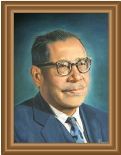
Lic. ( Lawyer ) Marcelino Suárez (1952) Óleo sobre tela ( Oil on Canvas ). Augusto Escamilla Guzmán .39 X .49 cm. Original