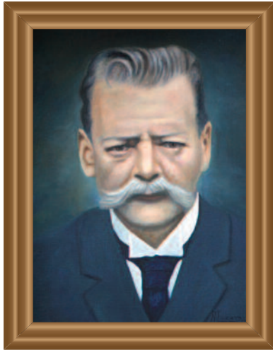
Profr. ( Profr. ) Juan B. Garza (1906) Óleo sobre tela ( Oil on Canvas ). Augusto Escamilla Guzmán .39 X .49 cm. Original