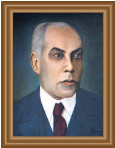
Lic. ( Lawyer ) Leopoldo Vicencio (1917) Óleo sobre tela ( Oil on Canvas ). Augusto Escamilla Guzmán .39 X .49 cm. Original