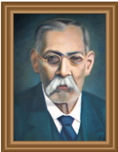
Ing. ( Engr. ) Anselmo Camacho (1915) Óleo sobre tela ( Oil on Canvas ). Augusto Escamilla Guzmán .39 X .49 cm. Original