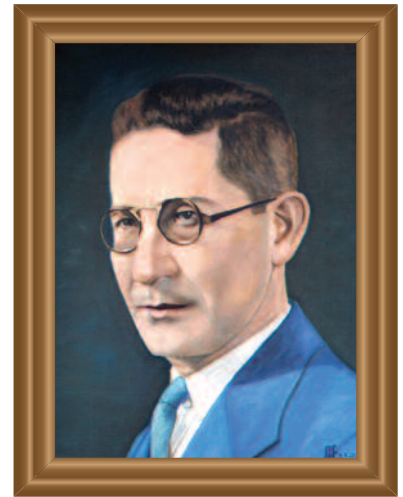
Lic. ( Lawyer ) Carlos Pichardo (1935) Óleo sobre tela ( Oil on Canvas ). Augusto Escamilla Guzmán .39 X .49 cm. Original