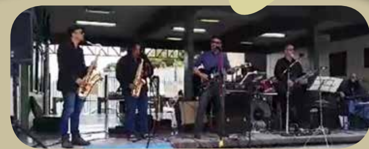
Texto y foto: Diana Laura Jaramillo Velázquez, reportera del Plantel “Ignacio Ramírez Calzada”.