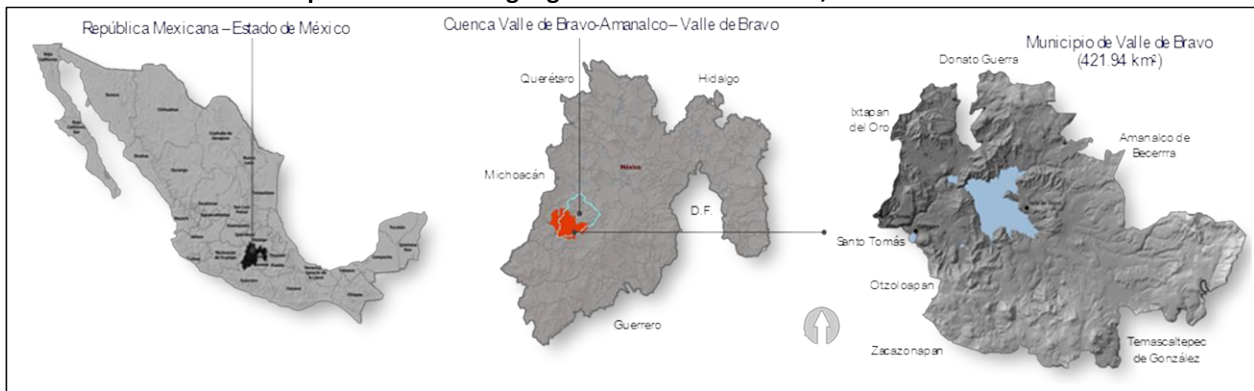
Mapa 1: Localización geográfica de Valle de Bravo, México