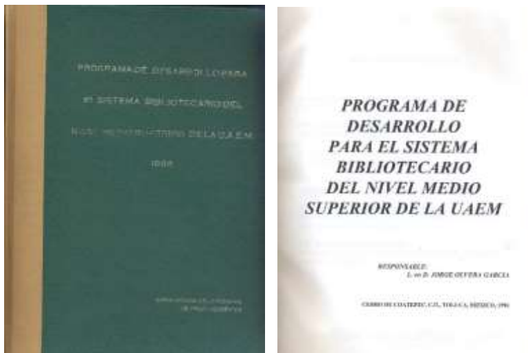
Portada exterior e interior del Programa de Desarrollo para el Sistema Bibliotecario Del Nivel Medio Superior de la UAEM (PDSBNMS)

Este PDSBNMS fue el santo y seña de su administración, sin descuidar, por supuesto, al Nivel Superior y a los Centros de Investigación, que también se diagnosticaron y tuvieron acciones pertinentes.