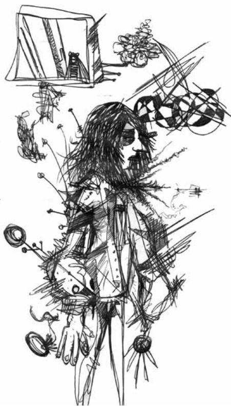
Autorretrato I (2010). Bolígrafo: Luis Enrique Sepúlveda.

él seguía una norma social que implícitamente dice que debes tener alguna ocupación si quieres ser un punto en el mapa.