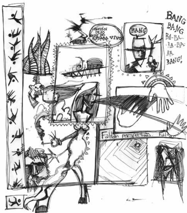
Esto está un poco complicado (2010). Bolígrafo: Luis Enrique Sepúlveda.

El capítulo que concierne al refugio no tiene por objeto acentuar el grado ascético de un artista, aun cuando mucho se haya dicho que el artista forzosamente debe ser un ente dado a la melancolía y a la tragedia, esta idea de “ver la poesía bajo rasgos trágicos y a situarla bajo la estrella desafortunada del sufrimiento, cuya