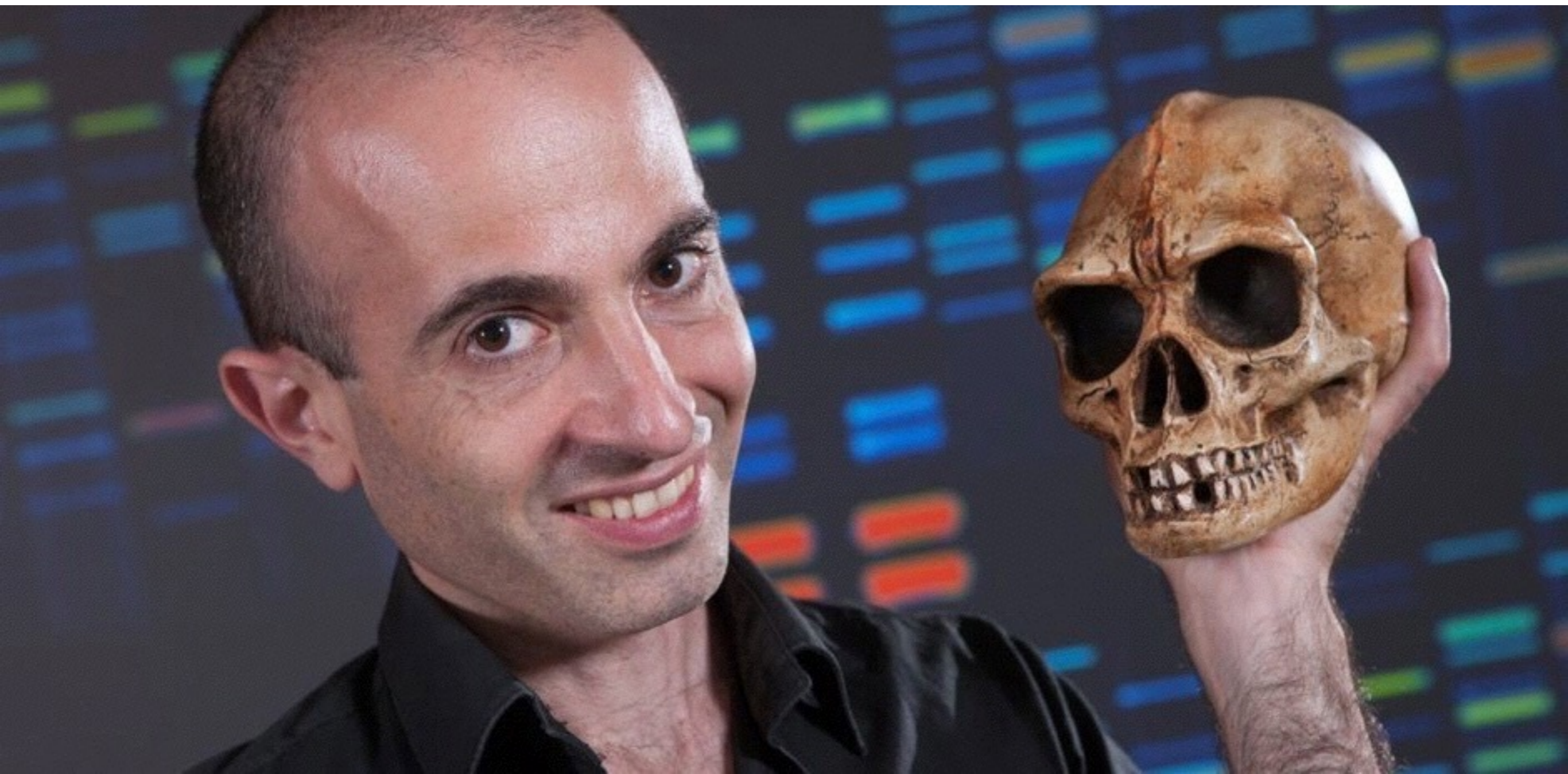
Yuval Noah Harari