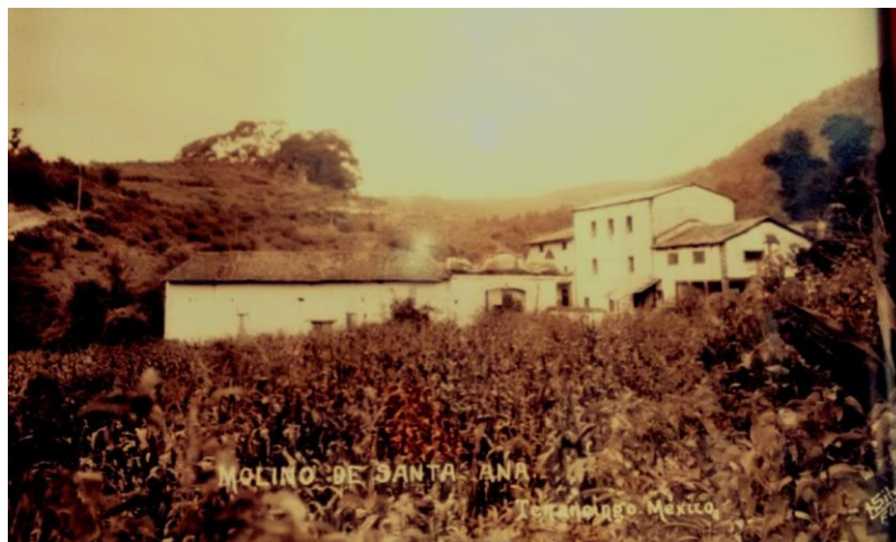
EL MOLINO DE LA LUZ.

En la revisión efectuada en el Catálogo Nacional de Monumentos, aparece registrado únicamente el Molino de Santa Ana (conocido antiguamente como el Molino de la Luz) que como se ha confirmado, perteneció a la hacienda, junto con otro inmueble conocido como la Fábrica de hilados y torzales La Guadalupe. La fecha de construcción del Molino descrita en el catálogo de monumentos lo ubica en el siglo XVIII, información que permite suponer que el resto de la propiedad podría pertenecer a la misma fecha.