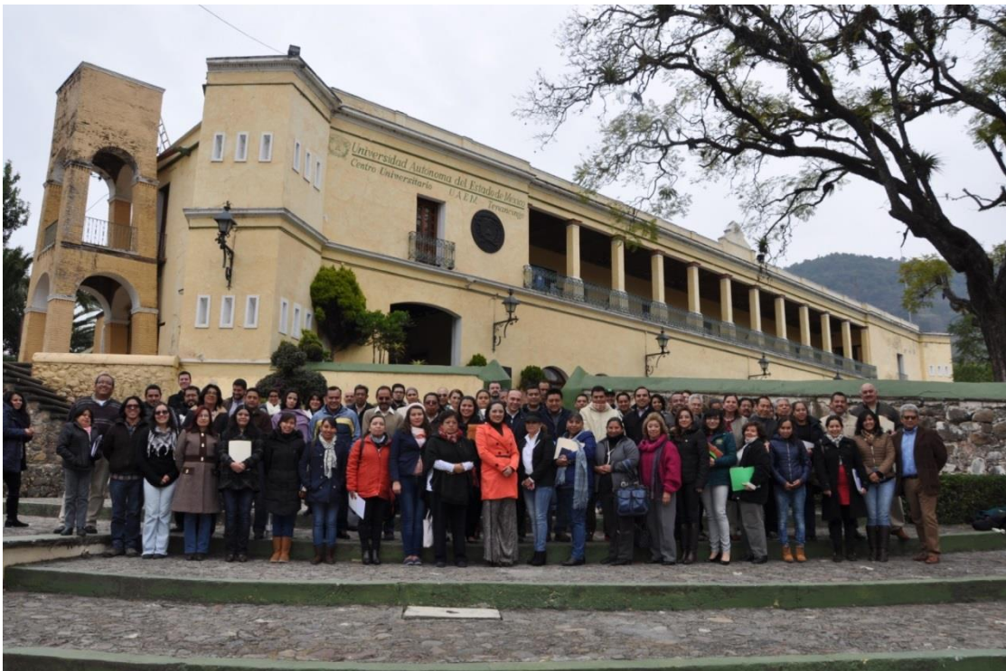
PLANTA DOCENTE DEL CICLO ESCOLAR 2016B, ORGULLOSAMENTE CUT.

EL CENTRO UNIVERSITARIO UAEM TENANCINGO, UN BREVE RECORRIDO POR SU HISTORIA ANTIGUA Y RECIENTE.