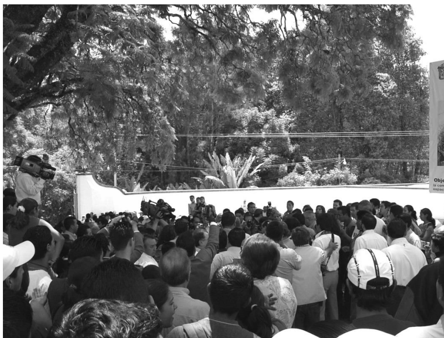
INAUGURACIÓN DE LA UNIDAD ACADÉMICA PROFESIONAL TENANCINGO.

reconocían día y noche, todo con el firme propósito de que tres días antes de la inauguración todo se encontrara listo para el inicio formal de las actividades académicas. La entrega de las instalaciones a la UAEMex por parte de las autoridades del gobierno del Estado de México se realizó el día 10 de septiembre de 2003 y la ceremonia inaugural encabezada por el entonces gobernador Lic. Arturo Montiel Rojas, al día siguiente.