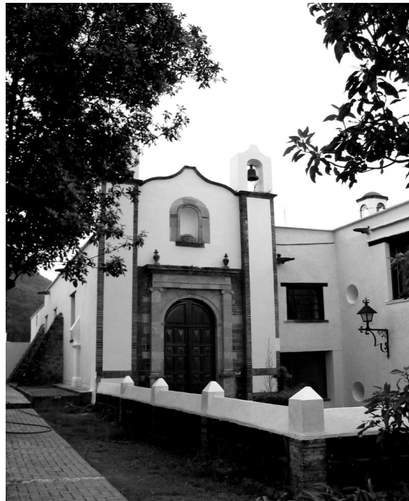
LA CAPILLA DE SANTA ANA

Por su parte, la capilla se distingue por una portada sobria esculpida en cantera de estilo Neoclásico. Se aprecia un nicho vacío que debió albergar una escultura en bulto de alguno de los santos a los que se dedicó este espacio sagrado.