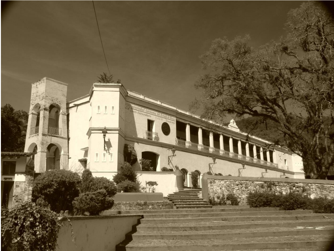
EXHACIENDA DE SANTA ANA, UN ESPACIO CON HISTORIA.