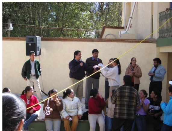
PRIMERA POSADA EN LA UNIDAD ACADÉMICA PROFESIONAL EN 2003.