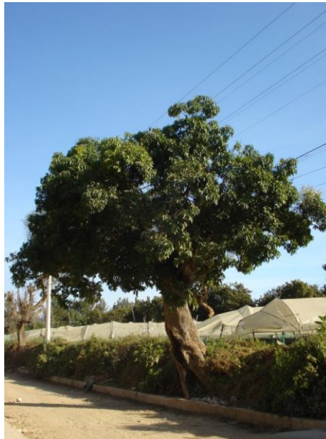
EL SAPOTE DE LOS CRISTEROS.

Durante la etapa “Cristera”, ocurrida entre 1926 y 1929, se desató en México uno de los episodios más dramáticos de la historia nacional en el que se confrontó el gobierno encabezado por el presidente Plutarco Elías Calles (1926 – 1929), con la llamada “Cristiandad mexicana”. Se sabe que la capilla de Santa Ana se vio involucrada en este suceso histórico, ya que fue cerrada debido a la prohibición del culto católico. Hacia la parte suroeste del centro universitario, sobrevive un árbol en el que se dice que colgaron a quienes defendieron sus creencias de la prohibición impuesta por un estado represor.