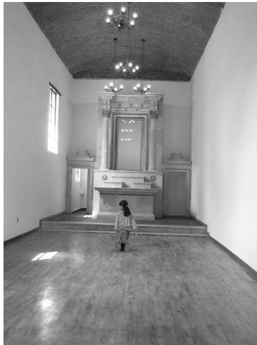
INTERIOR DE LA CAPILLA DE LA EX HACIENDA DE SANTA ANA FOTO. RUBÉN NIETO, 2003.

Se nos informó que es la imagen que actualmente se encuentra en la parroquia de San Francisco en la cabecera municipal de Tenancingo, aunque también se afirma que existe otra más que se encuentra en la capilla de Santa Ana Ixtlahuatzingo. En el interior sobrevive un magnífico altar de estilo neoclásico, elaborado en cantera en el que se veneraba a Señora Santa Ana. Del resto de las imágenes que debieron formar parte de toda la parafernalia sagrada, no queda nada. En el año de 2003, se logró recuperar un óleo sobre tela con la representación de la Virgen de Guadalupe que se halla bajo el resguardo del Centro Universitario.