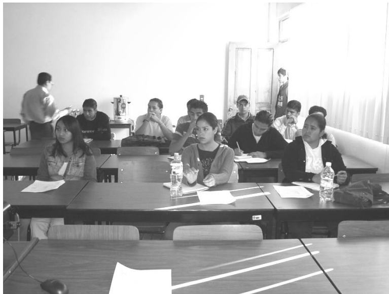
PRIMER GRUPO DE ALUMNOS DE LA CARRERA DE INGENIERO AGRÓNOMO EN FLORICULTURA (2003).