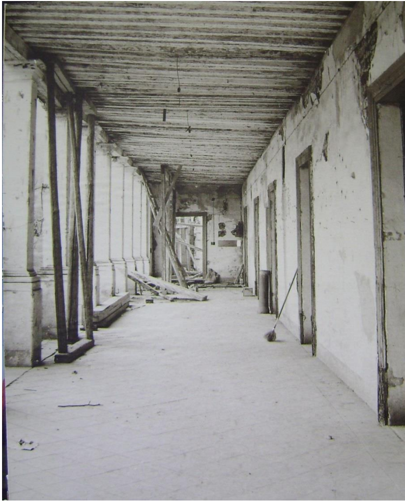
FIGURA 2 . IMAGEN DEL DETERIORO EN EL CORREDOR SUPERIOR DEL CASCO HISTÓRICO ANTES DE LA INTERVENCIÓN DEL GOBIERNO ESTATAL..

cubierta del casco histórico fue construida a base de vigas, tablas, terrados y tejas, distinta a las bóvedas que se aprecian en este momento.