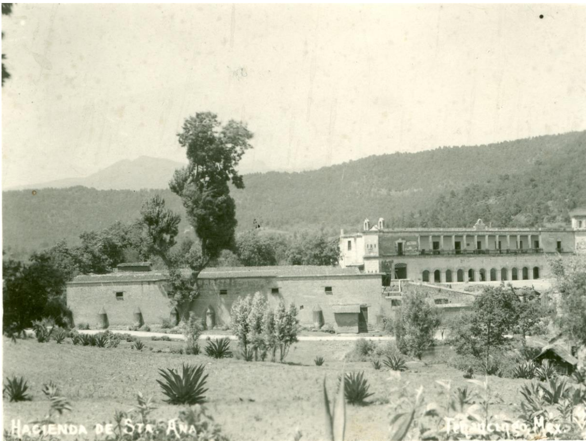
LA HACIENDA DE SANTA ANA EN 1920. AUTOR ANÓNIMO. CORTESÍA DEL LIC. SERGIO OSCOS.