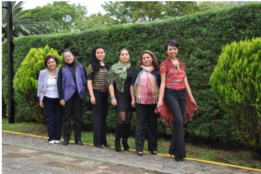
COMPAÑERAS DEL ÁREA ADMINISTRATIVA-ACADÉMICA PORTANDO SU REBOZO.

Entre las acciones más significativas que realiza el centro universitario, destaca la promoción de una de las prendas que han estado ligadas a numerosos eventos de la historia nacional. Se trata del rebozo, producto elaborado por las diestras manos de artesanos tenancinguenses, cuya creación requiere de mucho tiempo en su confección. Los efectos positivos de la difusión que realiza el CU Tenancingo se reflejan en su reconocimiento a nivel nacional e internacional. Cabe agregar que en cada actividad académica (congresos, coloquios) se organizan pasarelas en las que desfilan alumnas y profesoras que portan orgullosamente su rebozo y muestran las múltiples maneras de utilizarlo.