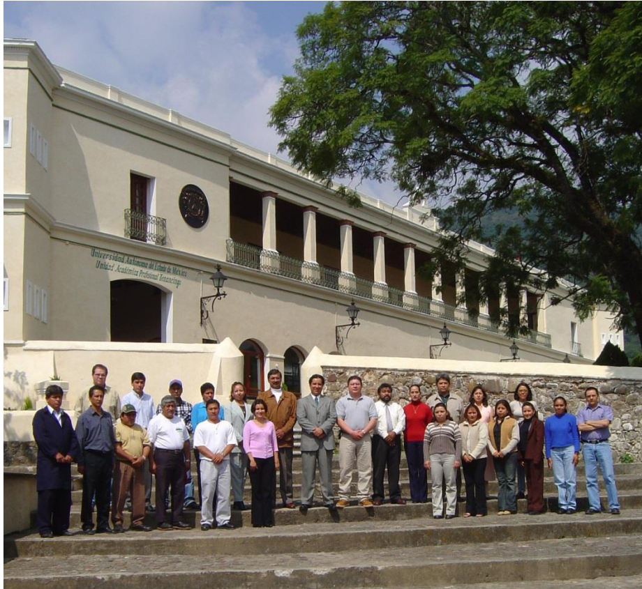
INTEGRANTES DEL PRIMER EQUIPO DE TRABAJO QUE INICIA ACTIVIDADES EN EL AÑO 2003