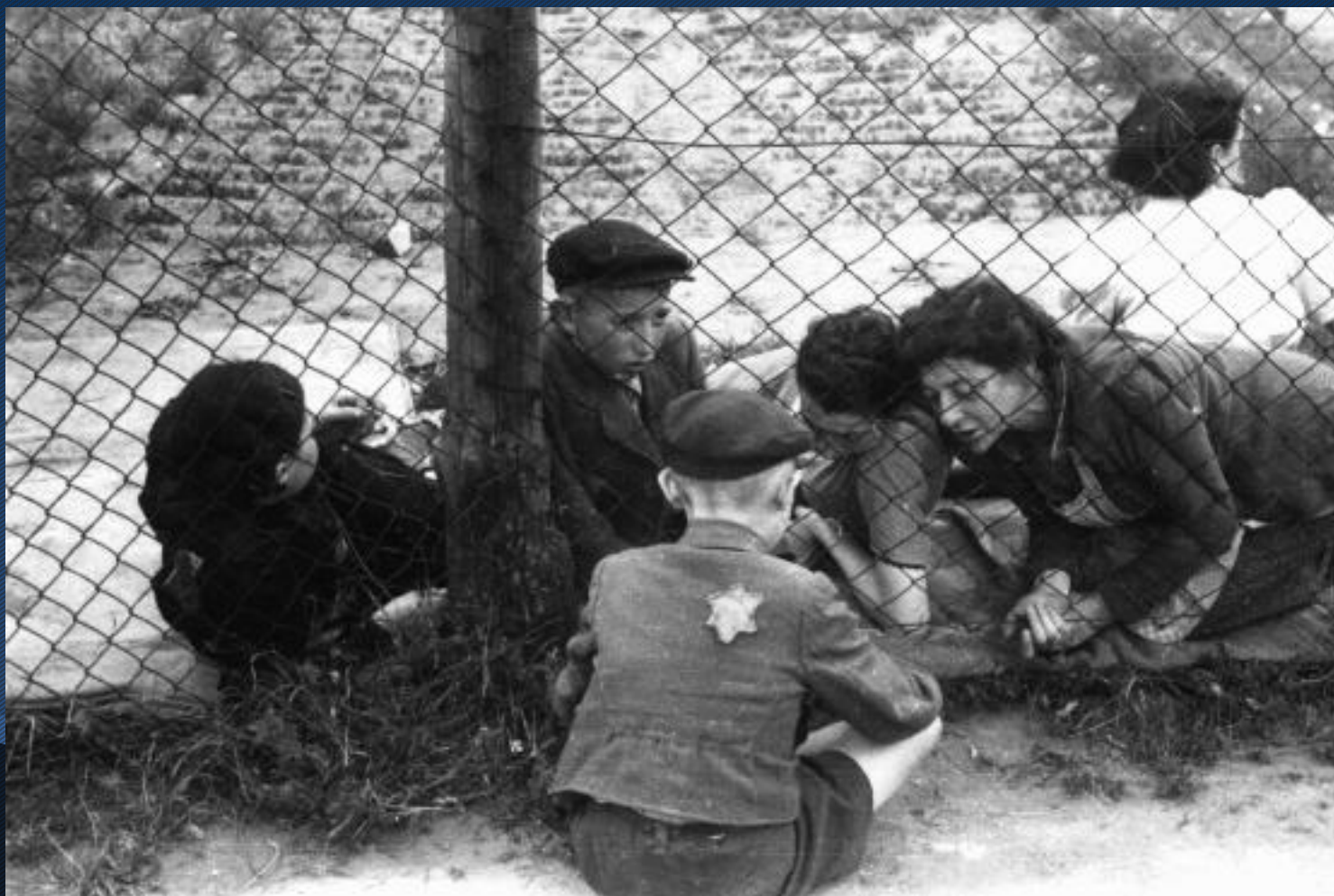
3.- Chelmno durante la "Gehsperre Aktion". Lodz, Polonia, septiembre de 1942