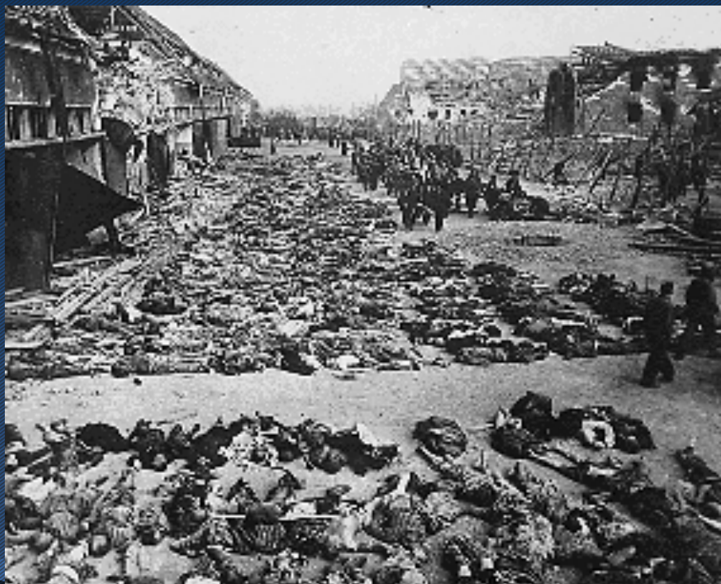
11. Nordhausen (12 de abril de 1945)