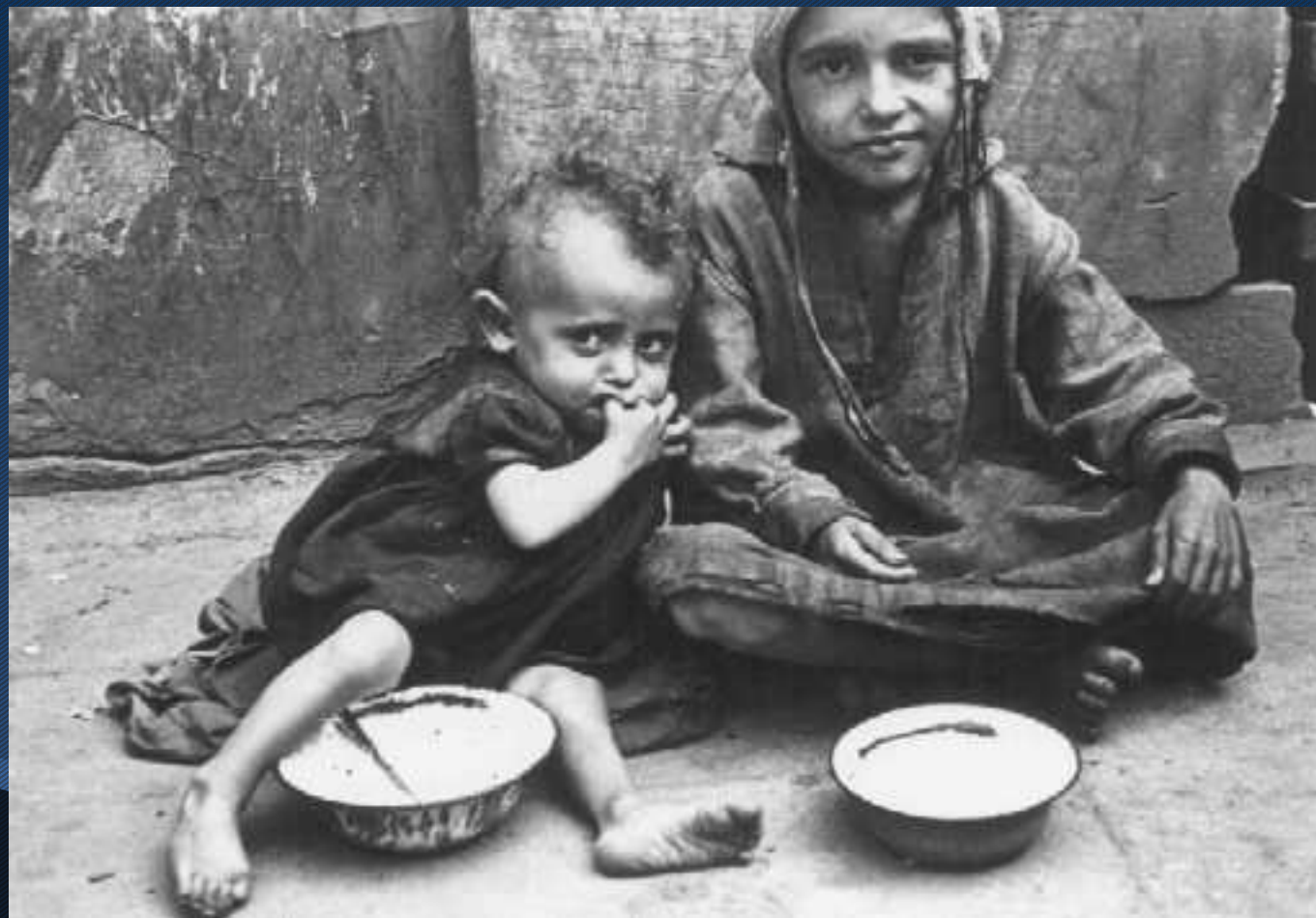
2.- Niños comiendo en las calles del ghetto. VaVarsovia, Polonia, entre 1940 y 1943.rsovia