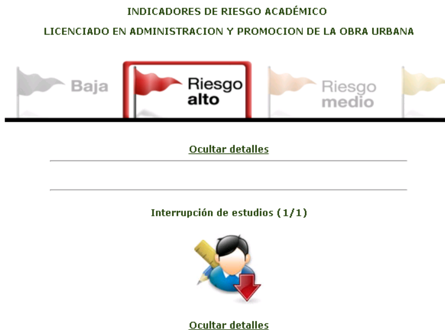
Figura-2 "Indicadores de Riesgo Académico"

Como primera acción después de haber ingresado al portal, el sistema le mostrará "el indicador de riesgo" que guardan los estudios, este se clasifica en: baja, alto riesgo, riesgo medio, riesgo bajo, o sin riesgo. Desde aquí se podrán revisar los detalles correspondientes al nivel de riesgo registrado y se mostrará la información con los motivos que los causan.