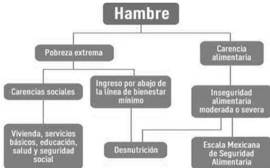
Figura 3 Derecho a la Alimentación