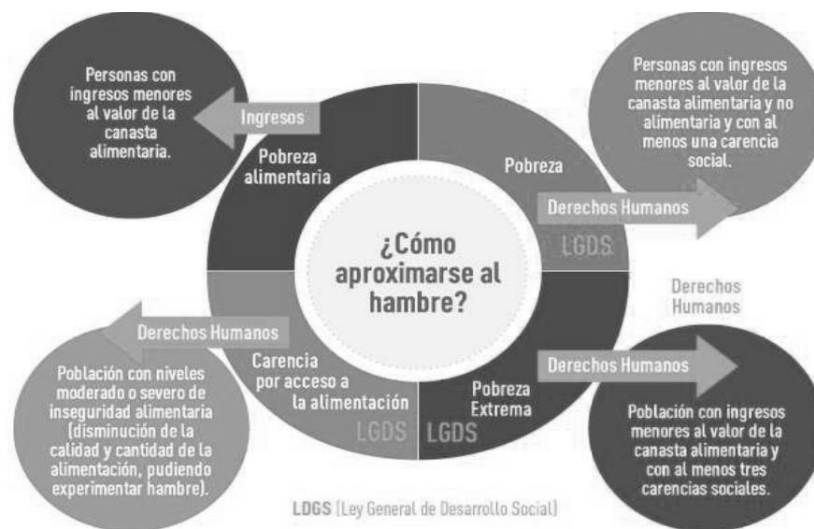
Figura 2 Aproximación del Hambre