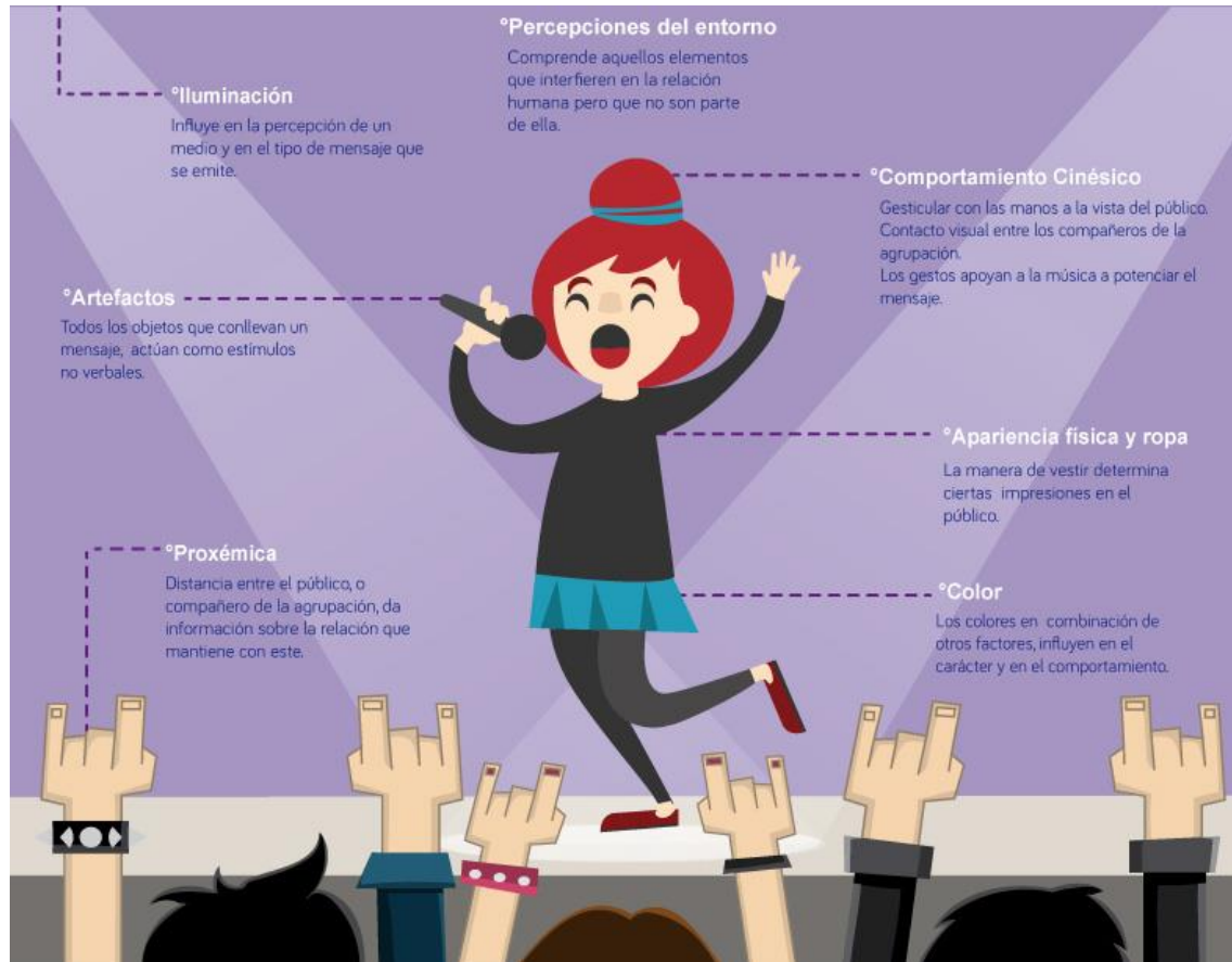
Figura 1. Unidades de análisis de la comunicación no verbal en el intérprete musical.