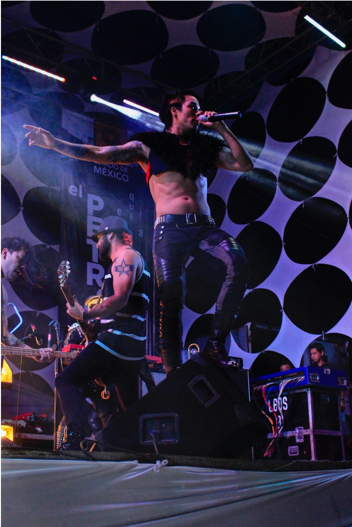
6. Víctimas del Dr. Cerebro, Ranas.