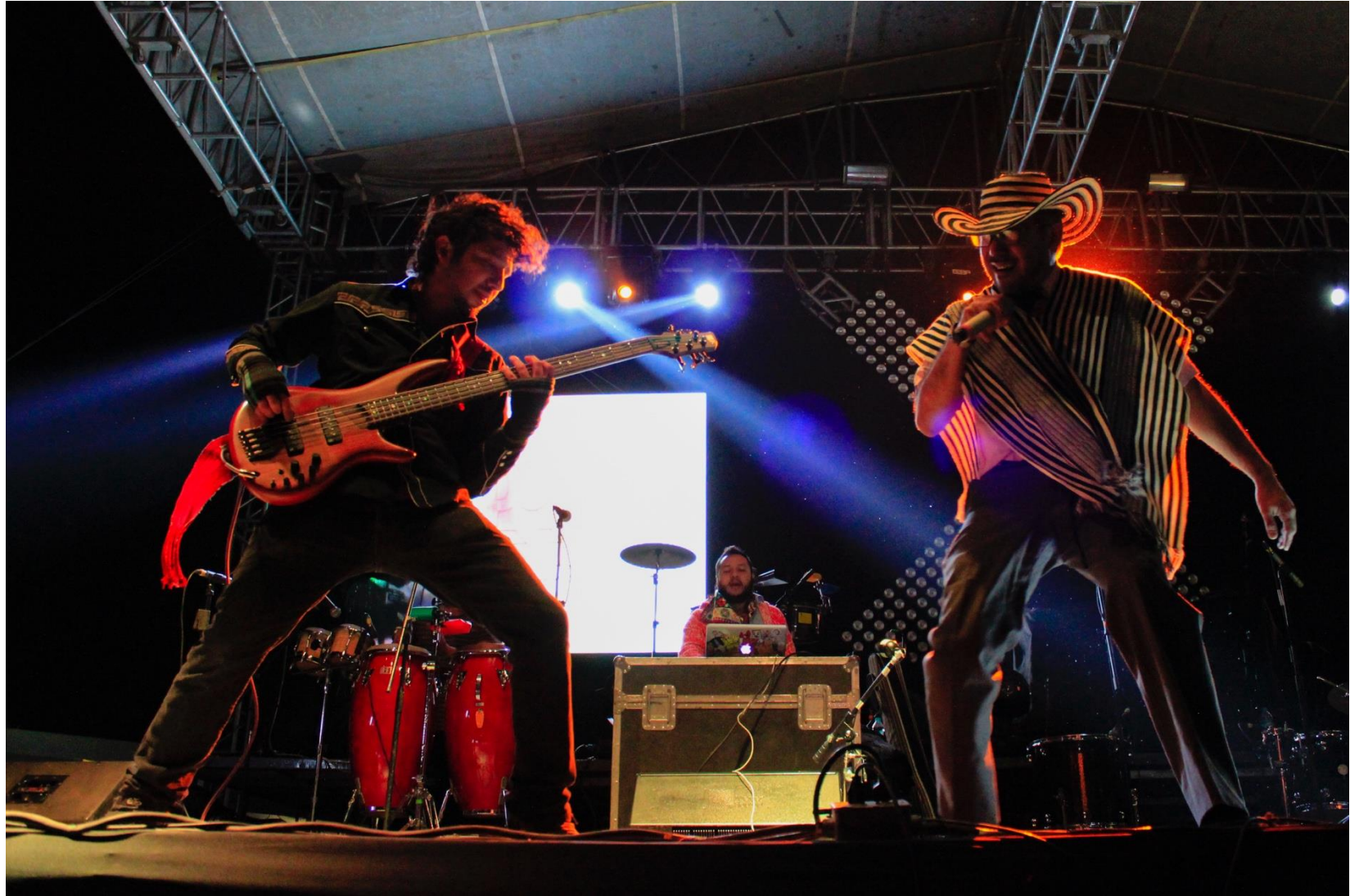
26. Sonido San Francisco.