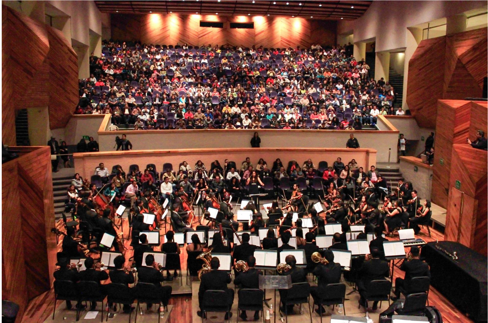
10. Orquesta Sinfónica Juvenil de la UAEM.