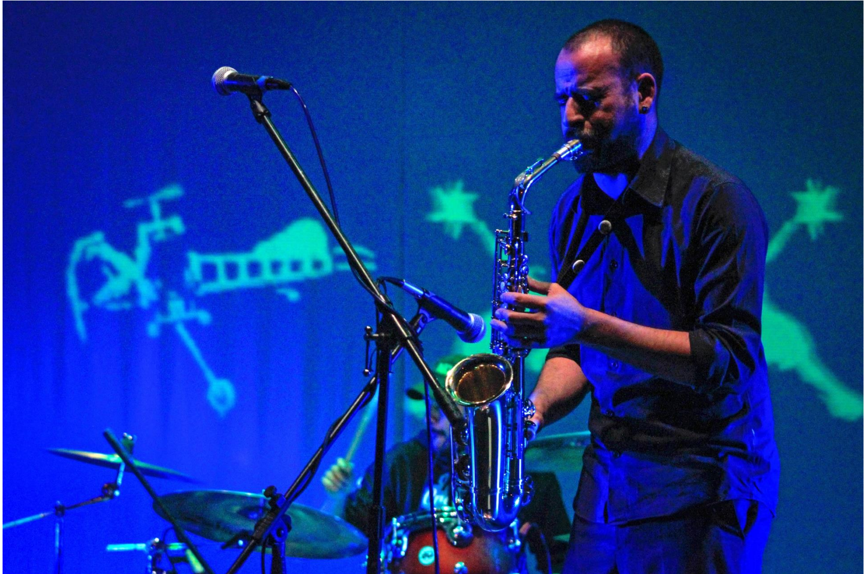
29. Laberinto del Caos, Abraham Yacaman.