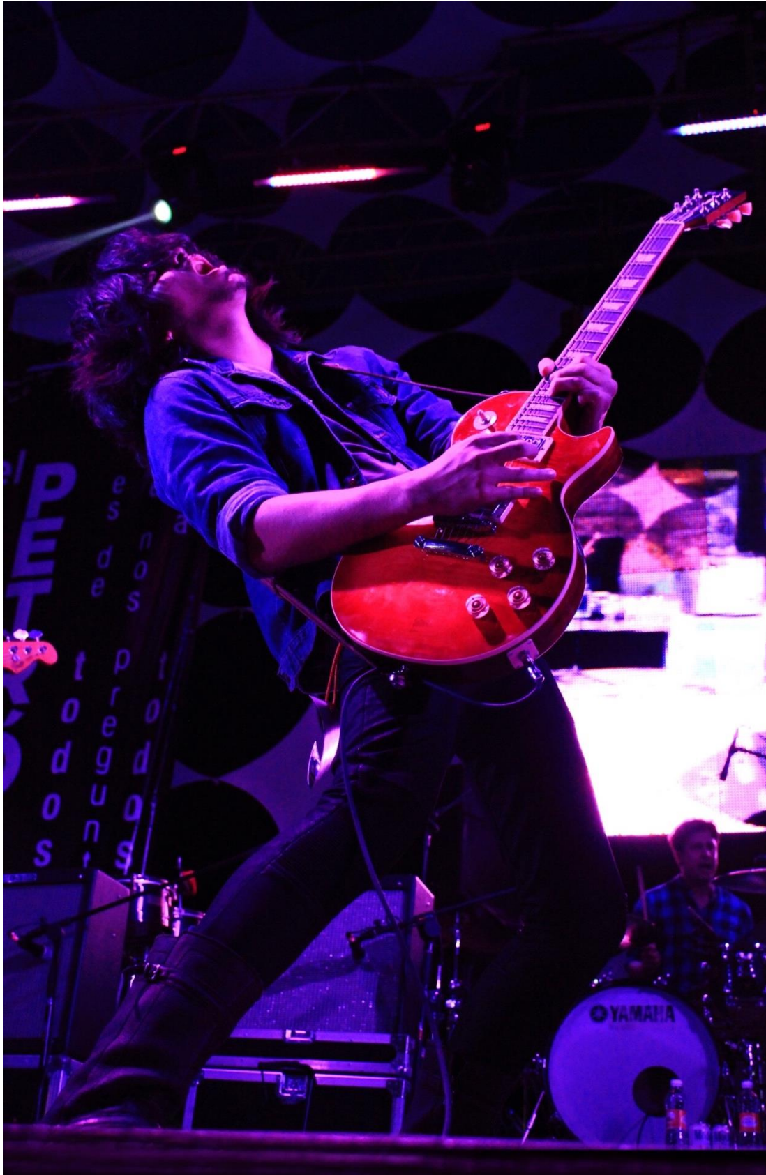
4. Elis Paprika & The Black Pilgrims