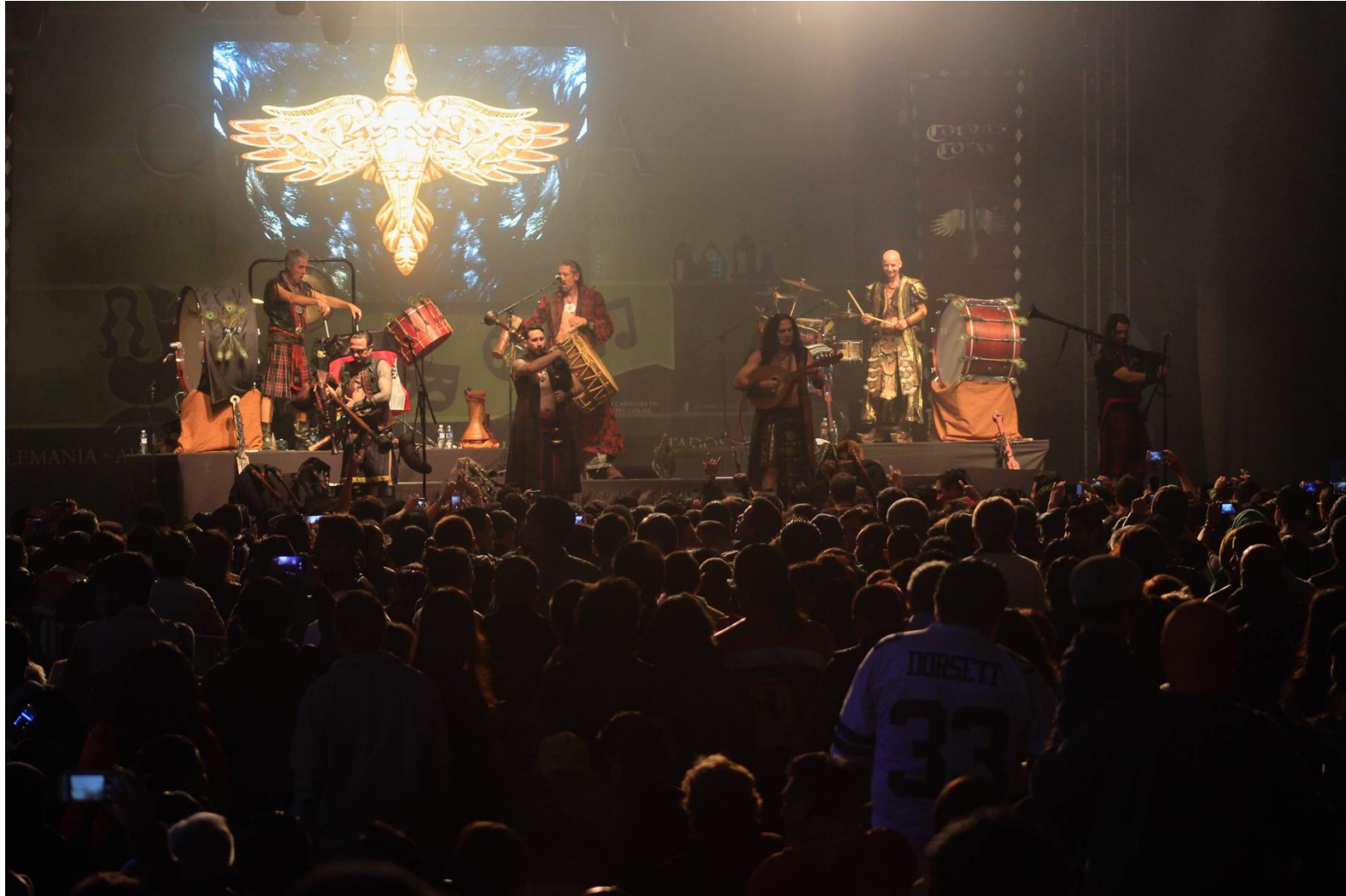
11. Corvus Corax.