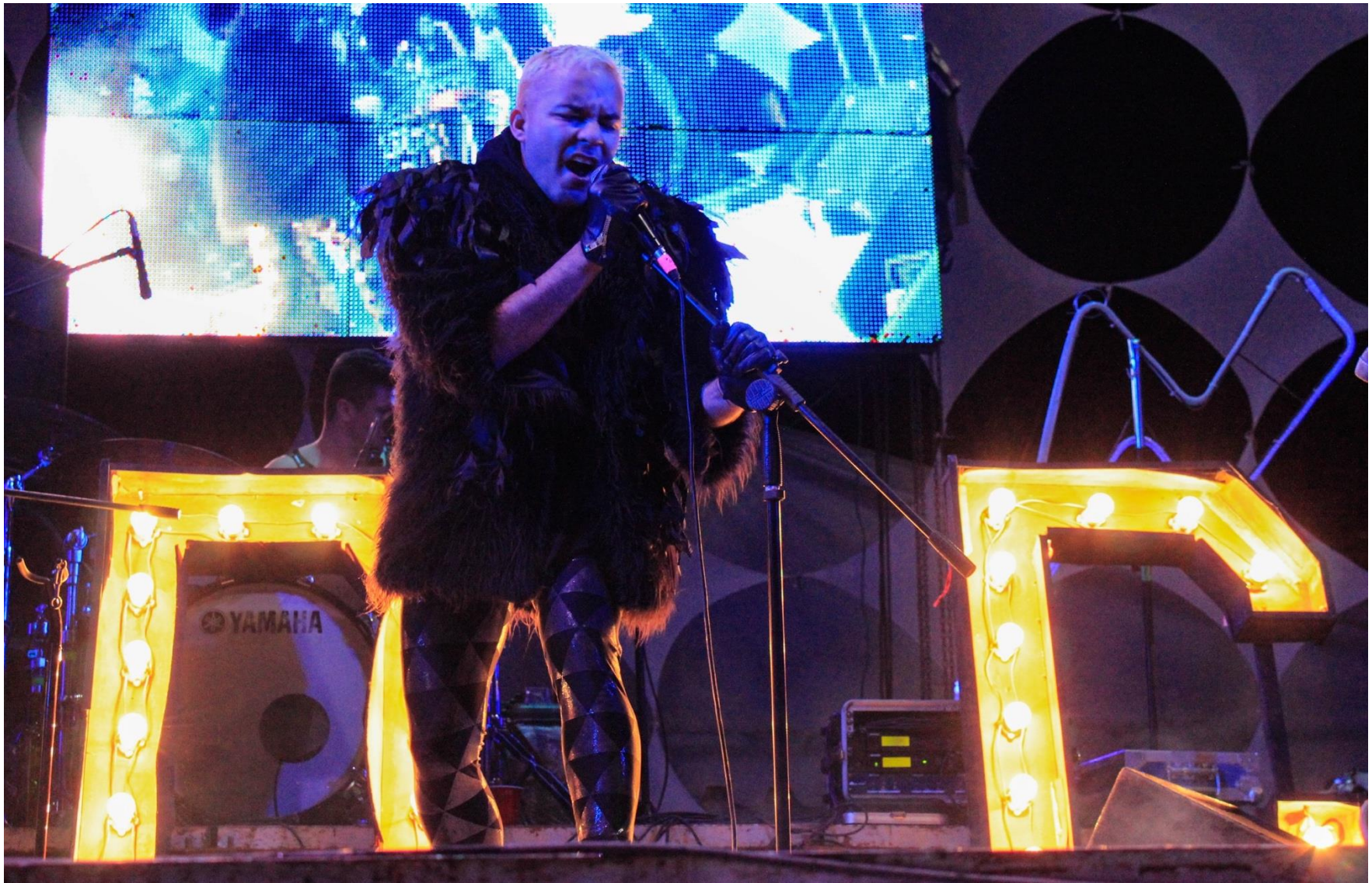
7. Víctimas del Dr. Cerebro, Abulón.