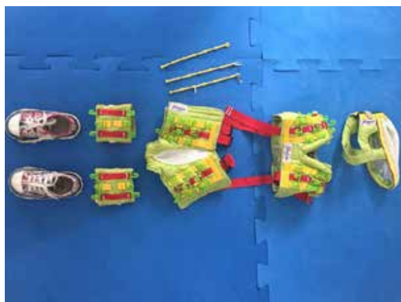
Figura 1. Vestimenta utilizada para a realização da terapia

para isquiossurais, suporte para plantiflexores com ajustes para correção de valgismo no membro inferior esquerdo, flexão dos joelhos e rotação interna de membros inferiores. A Figura 2 mostra a unidade de exercícios onde a terapia foi realizada.