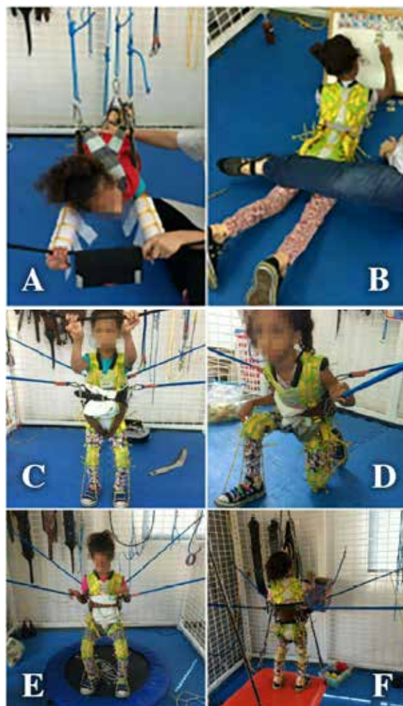
Figura 3. Dentre as atividades propostas, a intervenção consistiu em exercícios de extensão de tronco (A), descarga de peso em membros superiores e alcance (B), transferência em ortostatismo (C), passar de ajoelhada para semi-ajoelhada (D), pular na cama elástica sem auxílio (E) e atividade de basquete (F).

ajoelhada e de pé; rotação de tronco; descarga de peso e equilíbrio em ortostatismo na gaiola spider e fortalecimento muscular de membros superiores e inferiores na gaiola monkey . Algumas atividades realizadas estão ilustradas na Figura 3.