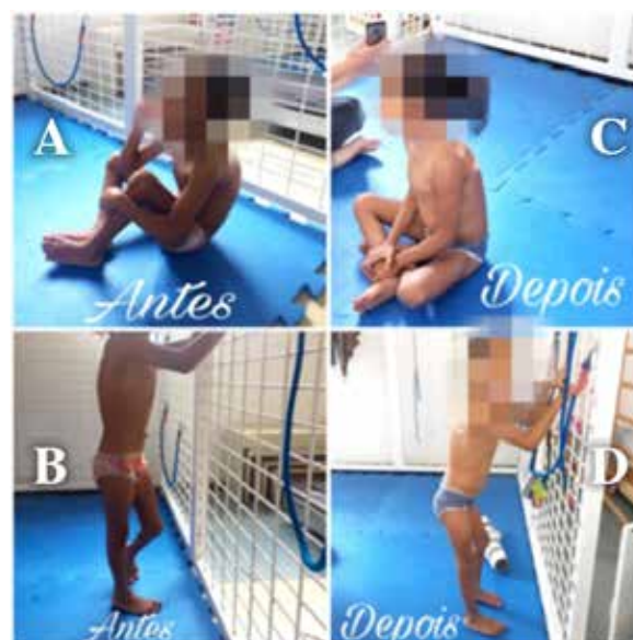
Figura 4. Alinhamento biomecânico nas posturas sentada e de pé com apoio, antes (A e B) e depois (C e D) da intervenção.

variações entre os estudos em relação ao tempo diário do tratamento, duração, exercícios realizados, fatores ambientais e períodos de descanso, portanto os resultados apresentaram pequeno efeito pós-terapêutico 10 . Já um estudo de caso único com uma criança com diplegia espástica reportou melhora significativa na função motora grossa, apresentando como resultado uma variação de 11.2% pré-pós tratamento 18 .