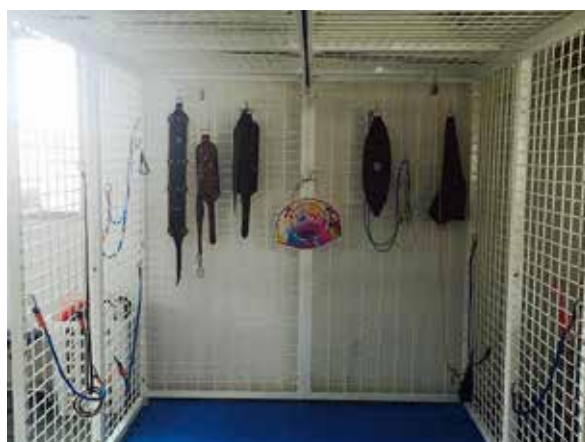
Figura 2. Unidade de exercício

De acordo com o procedimento padrão do método, a criança passou por uma adaptação e todos os dias de atendimento eram iniciados como protocolo de escovação cutânea em membros superiores e inferiores para ganho de propriocepção e aquecimento onde eram realizados alongamentos passivos e movimentação ativa das articulações 9 . Após esse protocolo, foram realizados exercícios de transferência de peso na postura sentada e em ortostatismo; alcance à frente, para os lados e acima da cabeça com a criança sentada na bola suíça; estímulo para pular na cama elástica sem auxílio do terapeuta, treino de marcha no andador e na esteira; atividade de basquete, circuito com obstáculos; descer e subir escadas; extensão de tronco em decúbito ventral; agachamento; passar de ajoelhada para semi-