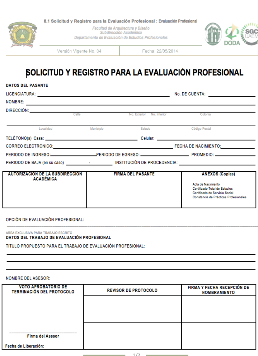
Imagen 3: Formato de solicitud de registro para la evaluación profesional.

A continuación se presentan los formatos que solicita el Departamento de Evaluación Profesional de la Facultad de Arquitectura y Diseño con el fin de que el alumno os identifique y tenga conocimiento de los procesos finales una vez que el director de la investigación ha liberado el documento