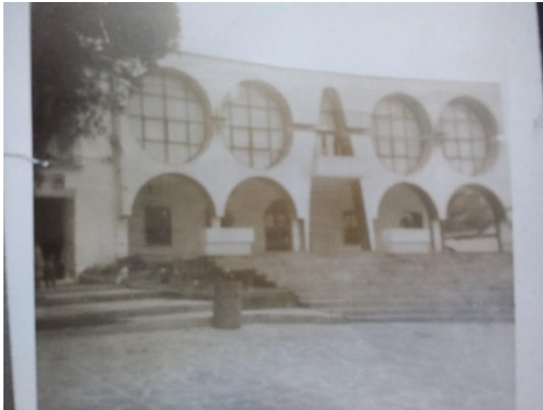
Palacio Municipal en su inauguración