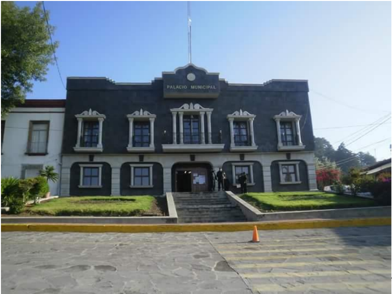
Palacio Municipal actualmente