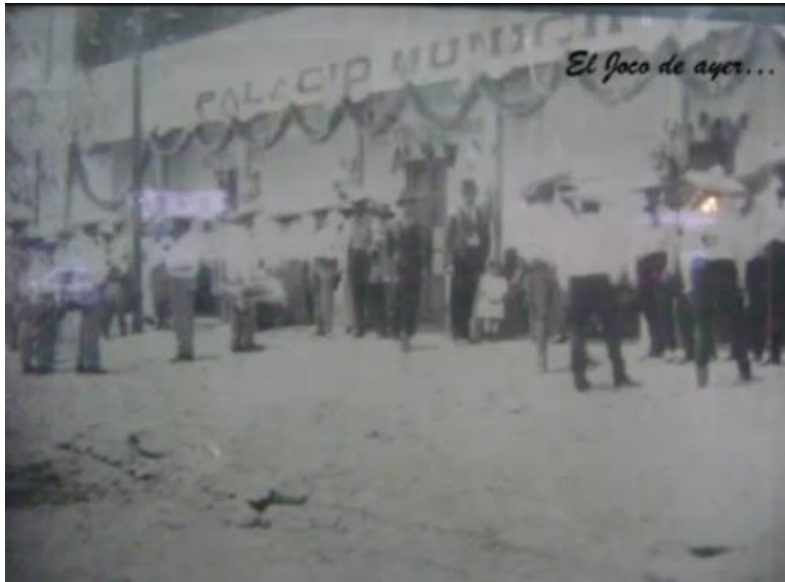
Palacio Municipal en un acto cívico en la primera mitad del siglo XX

Este edificio estuvo en servicio más de cien años con sus respectivos mantenimientos, aunque cuando se demolió se veía con cierto abandono, según me acuerdo.