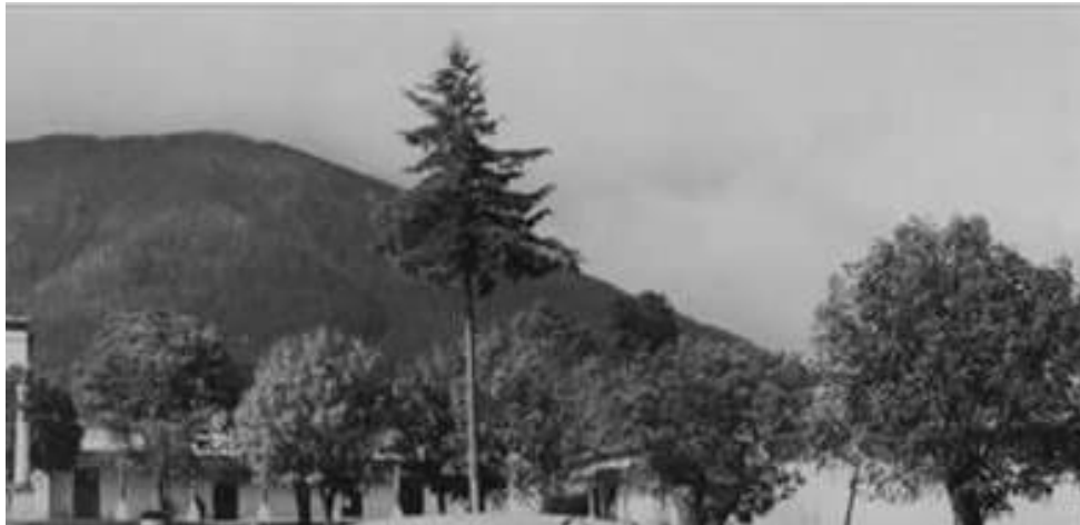
Palacio Municipal en 1960

Sería muy largo enumerar a todos los Presidentes Municipales y sus cabildos que usaron este edificio, pero quiero dejar testimonio de que sirvió para marcar la trayectoria de progreso de Jocotitlán.