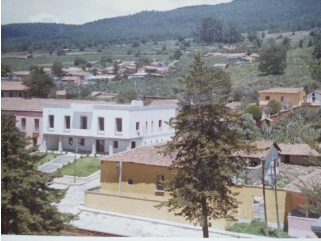
Palacio Municipal remodelado en 1973