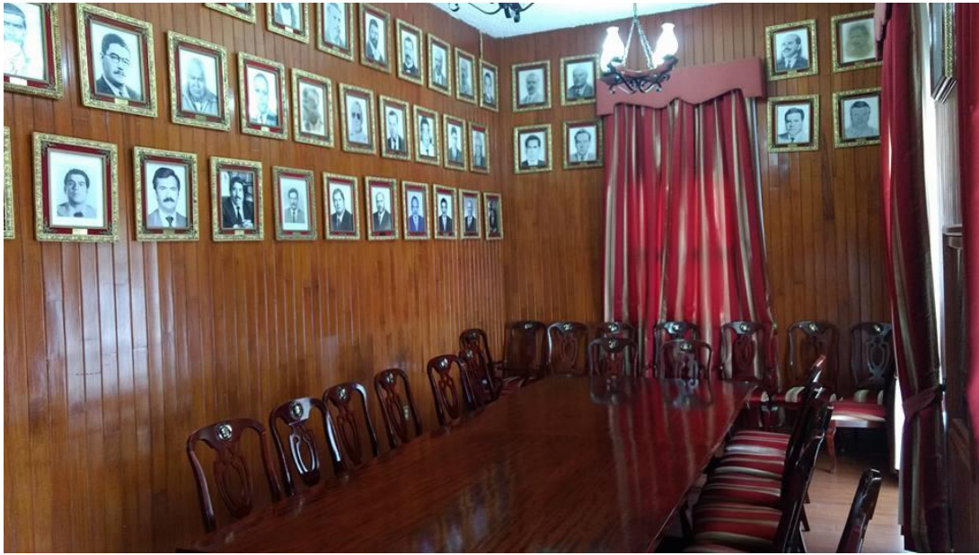
Salón de Cabildos y de Presidentes actualmente