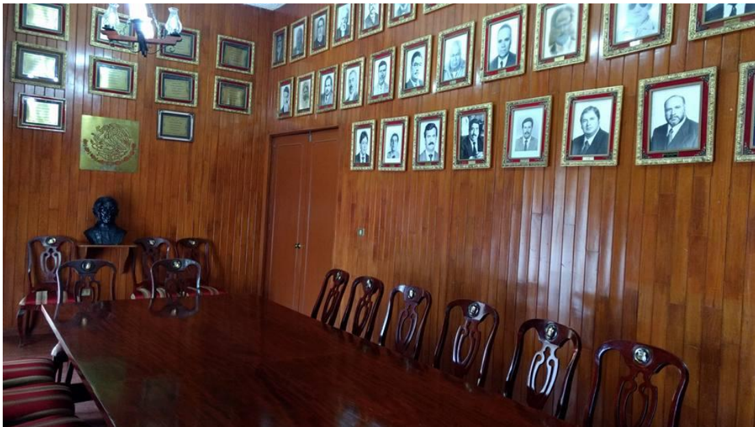
Otra toma del salón de Cabildos

Retomando las tres fachadas del actual edificio se pudiese pensar que fueron tres edificios, pero es el mismo con sus respectivas modificaciones.