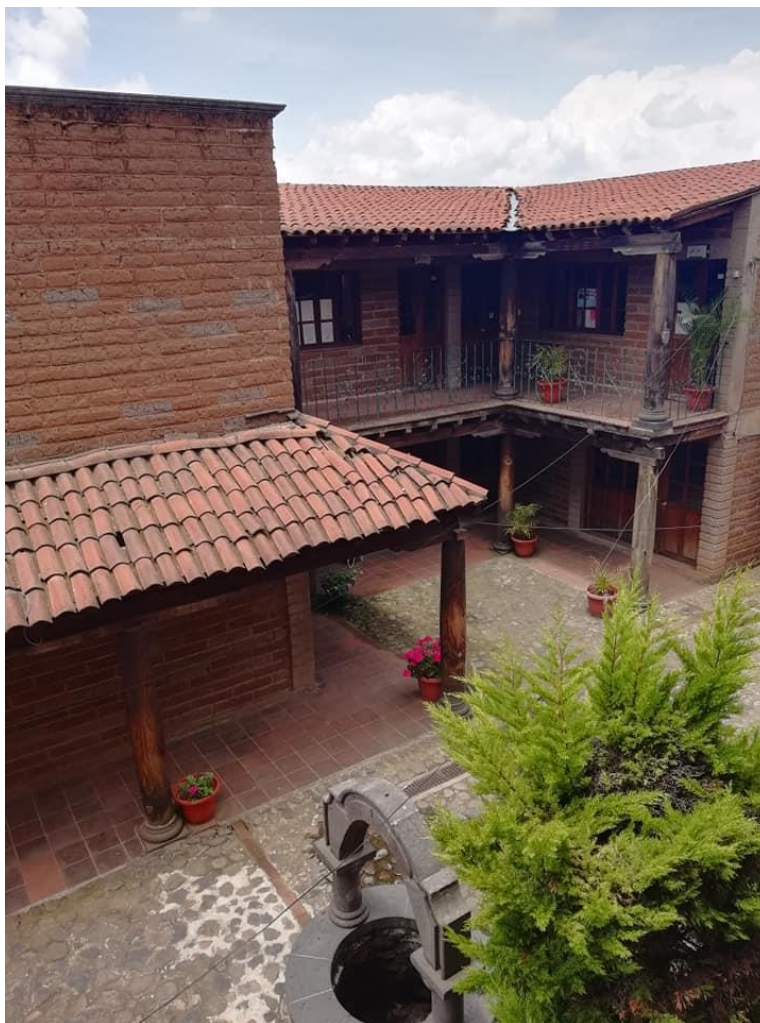
Oficinas administrativas atrás de la Casa de Cultura

Cabe hacer mención que el edificio donde se encuentran estas nuevas oficinas administrativas se construyeron con un esquema de la misma construcción de Casa de Cultura, con la finalidad de que conservara la misma relación.