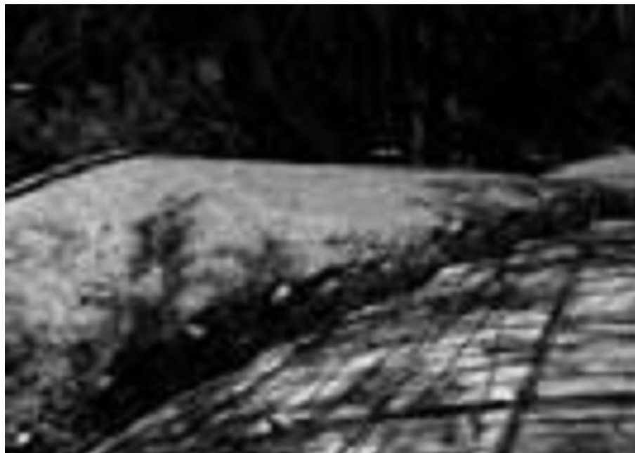
Fotografía 9 y 10 Colocación de capa de concreto ligero.