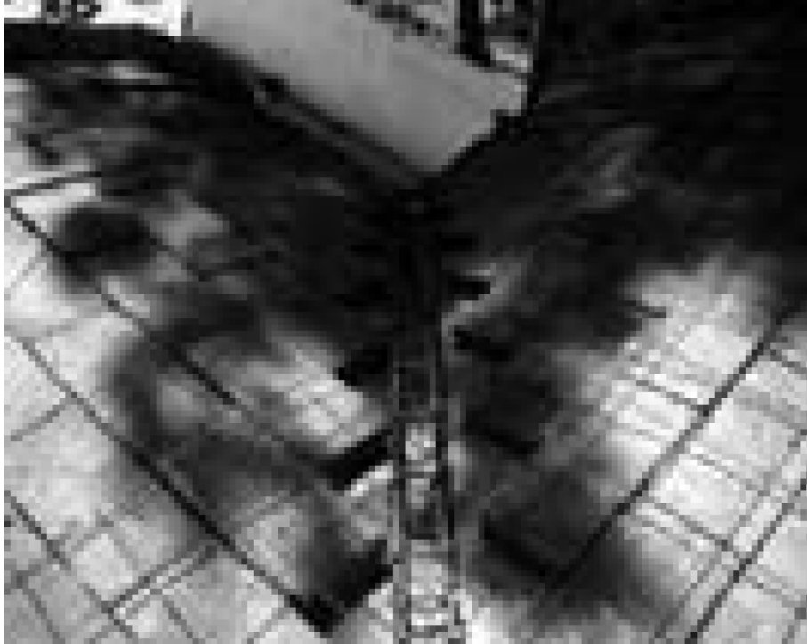
Fotografía 8 Nervaduras de refuerzo. Información propia, 2015.

El diseño de la colocación del adobe, tiene como característica, su estabilidad que reside en el recuete o recargamiento. A semejanza del llamado efecto dominó, donde cada adobe se sostiene sobre el otro. La colocación del adobe apoyada por otros factores a su favor, permite ligereza a la cúpula.