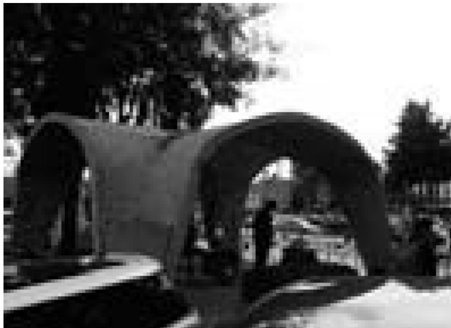
Fotografía 12 Usos polivalentes de la cúpula.