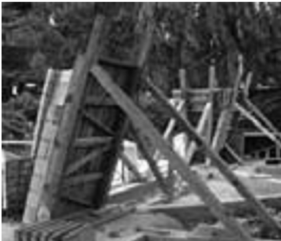
Fotografías 3 y 4

Adobe tecnificado cuyo trabajo estructural es de manera conjunta con el concreto armado. Información propia, 2015.