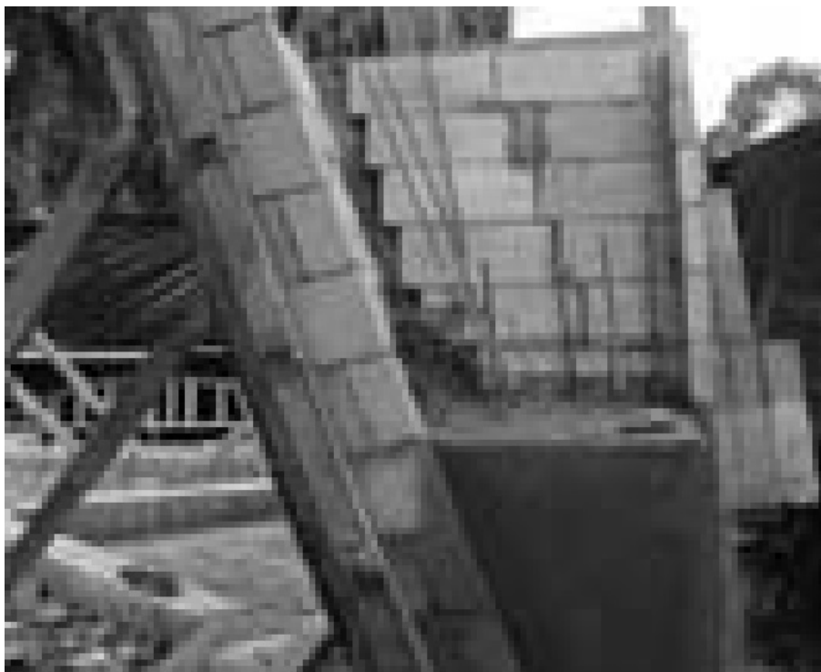
Fotografías 4 y 5

Adobe tecnificado cuyo trabajo estructural es de manera conjunta con el concreto armado. Información propia, 2015.