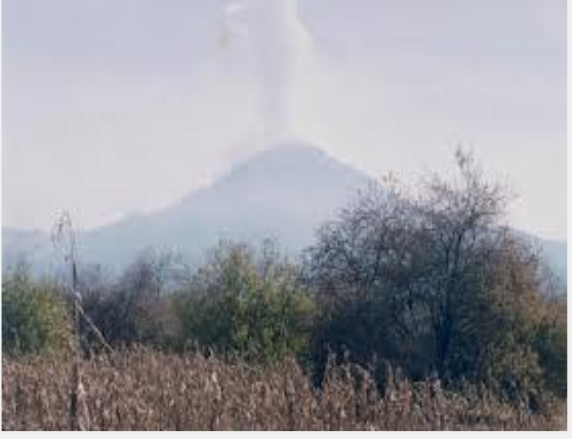
Foto 5. Volcán Popocatepetl, vista desde el municipio de Ecatzingo Abraham Augusto Hernández García.