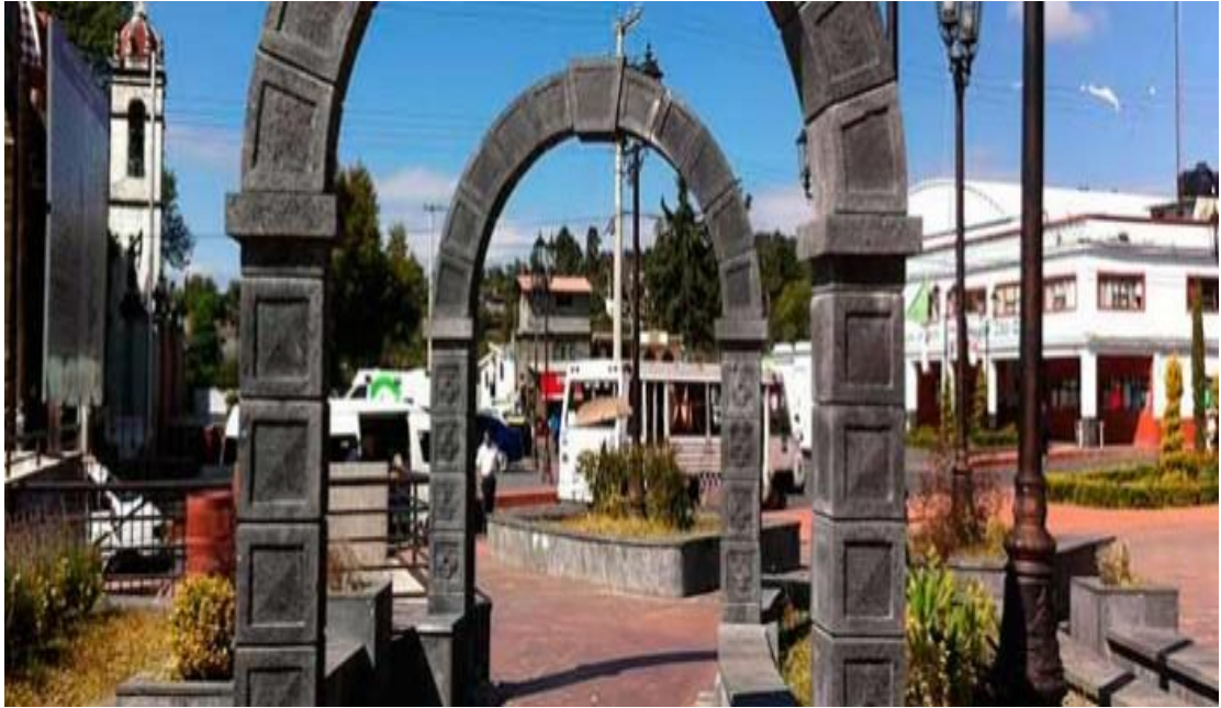
Foto 4. Entrada el kiosco municipal en donde se encuentra la Biblioteca subterránea.