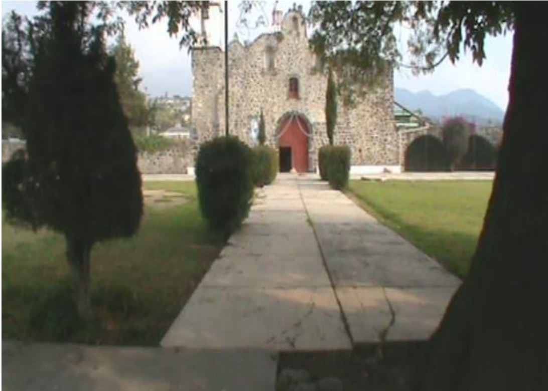
FOTO VISTA DE FRENTE DE LA PARROQUIA A SAN AGUSTIN