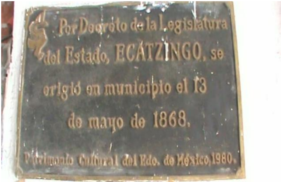
FOTO PLACA REPRESENTATIVA DE ERECCIÓN DEL MUNICIPIO DE ECATZINGO