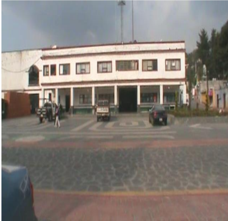
FOTO. VISTA DE FRENTE DE EXPLANDA Y PALACIO MUNICIPAL Abraham Augusto Hernández García.