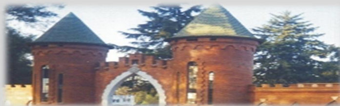
Fachada del Restaurante El Castillo de los Venados.