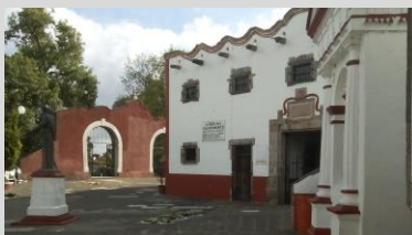
Santuario del Señor del Sacromonte