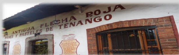
Entrada principal del restaurante.