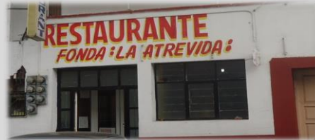
Entrada al restaurante Fonda la Atrevida.