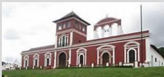
Vista principal de Hacienda Panoaya.