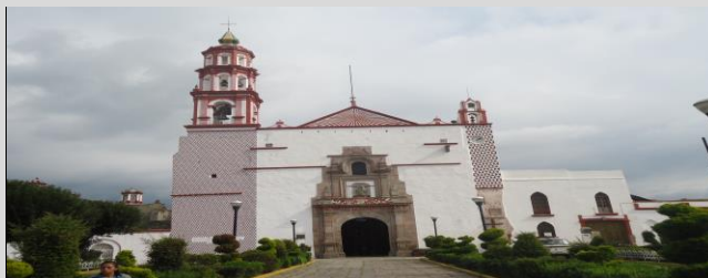
Parroquia de la Asunción