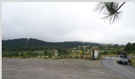
Áreas de esparcimiento en el Parque Izta-Popo