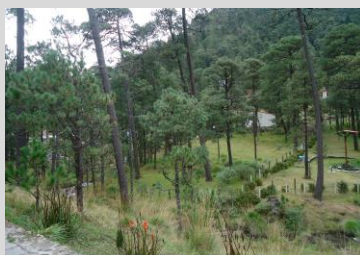
Parque ecoturístico Bosque Esmeralda.