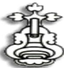
Ilustración 1. Glifo

El glifo de la palabra amatl es un cuadrado blanco; además del significado de papel, Remi Simeón le atribuye la connotación de mapa o plano. Esto sugiere que los papeles que señalan o indican, están referidos a los planos de distribución del agua.