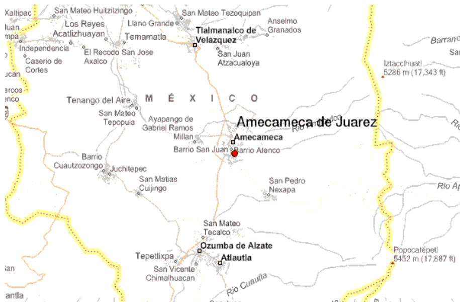
Mapa 2. Micro localización del municipio de Amecameca Estado de México