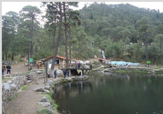
Zonas naturales de la ExHacienda Tomacoco