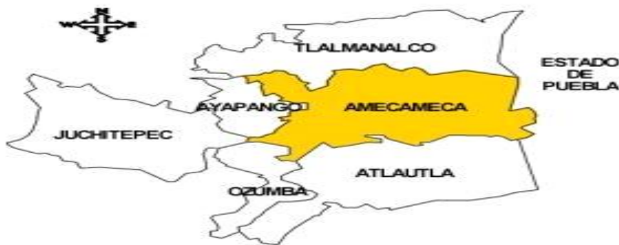
Mapa 1. Macro localización de Amecameca

Amecameca de Juárez es uno de los Municipios más importantes del Estado de México ya que colinda al norte con la carretera Federal México Cuautla que es una de las principales vías para acceder a la Ciudad de México, en el este con el Estado de Puebla y al oeste con el Estado de Morelos.