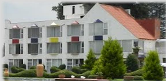
Vista principal de las habitaciones del Hotel Hacienda Panoaya.