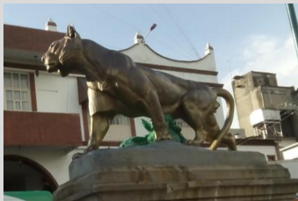
Leones de hierro fundido