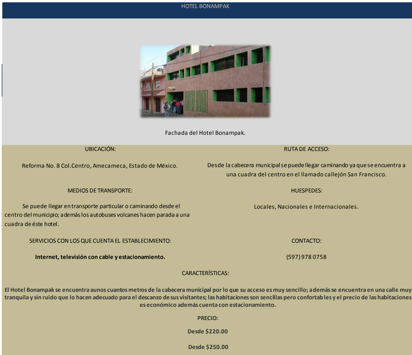
Tabla 11. HOTEL BONAMPAK