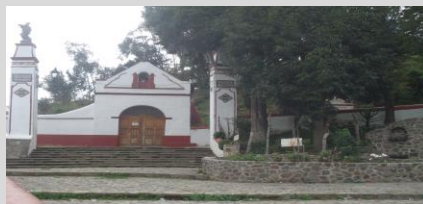
Capilla de la Guadalupe en el cerro del Sacromonte.