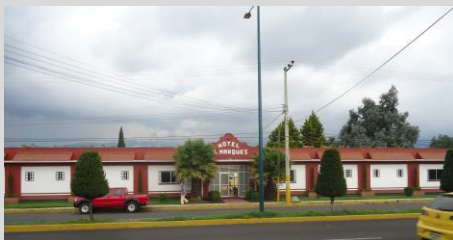
Fachada del Hotel el Márquez.