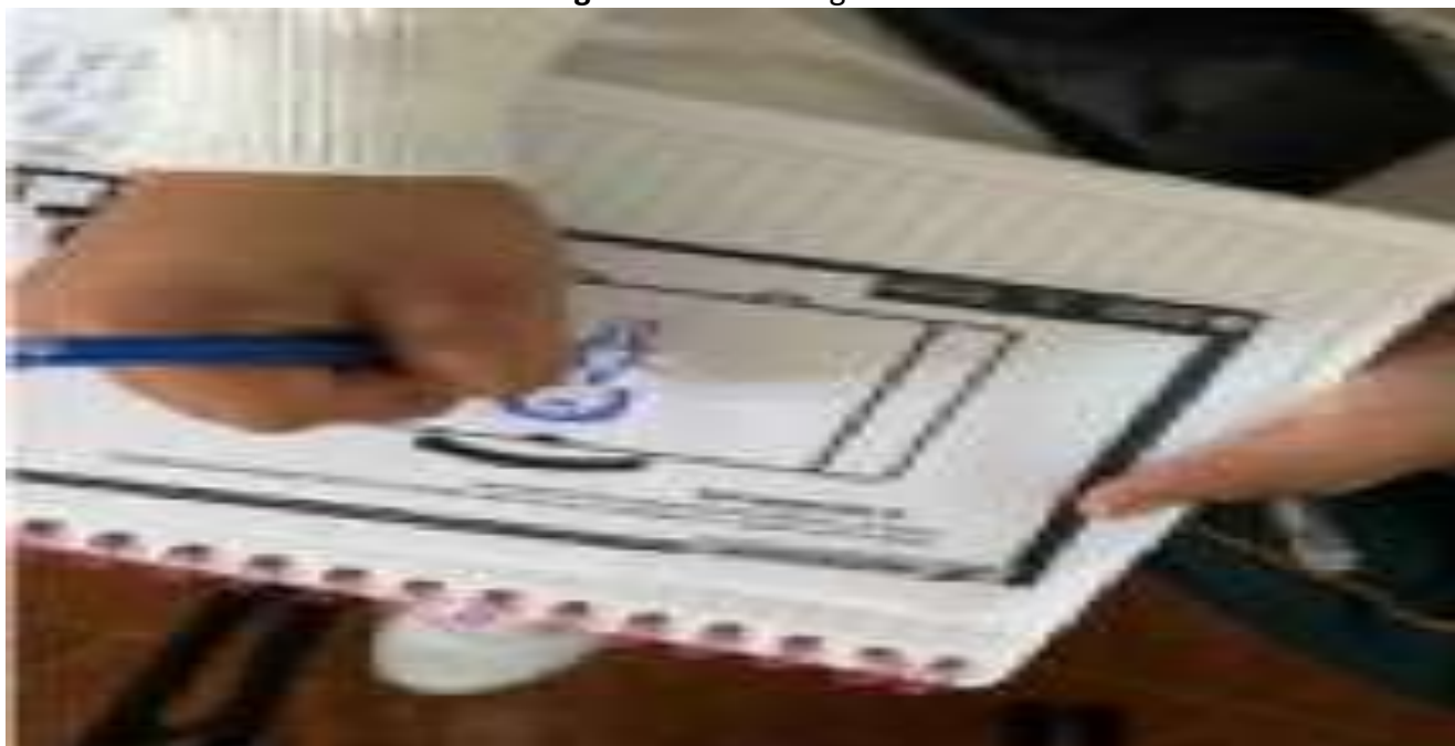
Figura 2. Maleta migrante

Para profundizar en el reconocimiento de los riesgos, en esta investigación se planificó y estructuró el denominado rally de la migración , siendo dos las actividades clave. La primera consistió en la integración de equipos para jugar jenga atendiendo las instrucciones del facilitador. El movimiento de los bloques de la torre dependía de las tarjetas informativas y de ejemplificación de riesgos que recibió cada equipo, de modo que, cuando tomaron aleatoriamente alguna tarjeta que hiciera alusión a los riesgos y vulnerabilidades de la migración irregular cada integrante debía sacar un bloque (ver Figura 3).