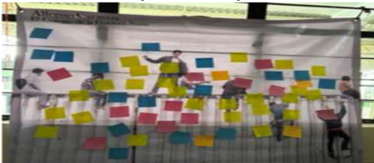
Figura 2. Vínculos con la migración

Como actividad de inicio se partió de un ejercicio de reflexión colectiva orientado a reconocer “¿Qué nos une con la migración?” Esta actividad tuvo como finalidad crear conciencia sobre las experiencias que vinculan directa e indirectamente a estos jóvenes estudiantes con los procesos migratorios hacia Estados Unidos. Su desarrollo fue facilitado con la lectura de una narrativa que aborda la experiencia de una mujer mexiquense que emigró sin documentos al vecino país, enfrentando durante este proceso situaciones de abuso sexual, separación familiar y afectaciones diversas a su salud mental. Posterior a la socialización de dicha narrativa, se repartieron post-it a cada alumno, para que en ellos pudieran plasmar sus lazos con la migración y compartirlos de manera anónima en un cartel representando el muro fronterizo que se dispuso para tal fin (ver Figura 2).