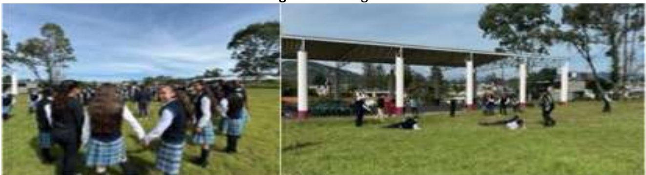
Figura 4. La migra

La segunda actividad denominada la migra se realizó con aros que simulaban el encierro, el hostigamiento y la persecución durante esta travesía. Esta actividad, por el interés suscitado entre estudiantes y docentes se convirtió en un espacio de diálogo para profundizar en la explicación de las agresiones físicas y verbales que experimentan los migrantes al ser detenidos y deportados. A la vez que resultó útil para informar sobre las dificultades para permanecer en ese país, particularmente en tiempos de histeria y violencia antiinmigrante, como la que se ha avivado en la actual administración de Donald Trump, en la medida en que las redadas, las persecuciones y los múltiples actos de acoso y vigilancia trascienden en padecimientos de estrés, miedo, angustia, depresión y otros trastornos que afectan la salud mental de esta población (ver Figura 4).