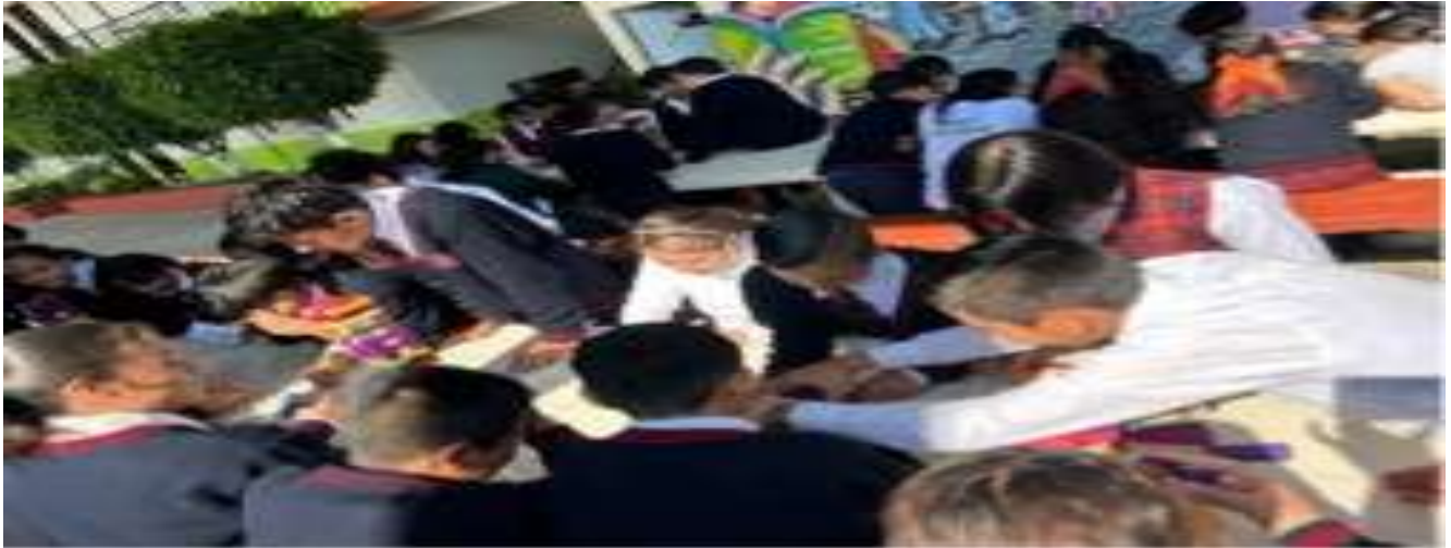
Figura 3. Jenga. Simulador de riesgos

Estos riesgos se precisaron haciendo énfasis tanto en las situaciones específicas que han llegado a vivir niños, niñas y adolescentes, como con la ilustración de casos reales a partir de las narrativas obtenidas en trabajo de campo. En cambio, las tarjetas informativas contenían datos clave sobre los derechos de la población migrante en Estados Unidos, las dinámicas de las ciudades santuario, la importancia de las remesas, los procesos de deportación y regreso forzado a México, entre otros aspectos de conocimiento general sobre las dinámicas de la migración internacional.