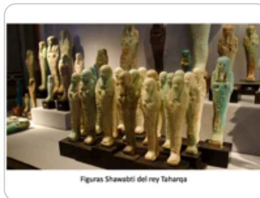
Figuras Shawabti del rey Taharqa