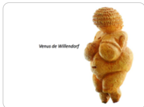
Venus de Willendorf

diapositiva 8-23: Artistas y colecciones. Notas: Mencionar la práctica artística vinculada a recolección: casos